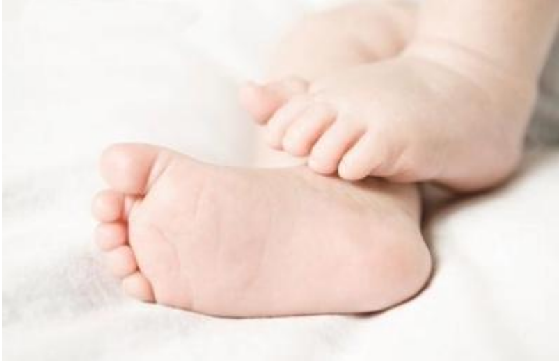
Ένας άνδρας στη νότια Σουηδία

αντιμετωπίζει κατηγορίες για ανθρωποκτονία από αμέλεια μετά το θάνατο του γιου του, ηλικίας 2 ετών, από, όπως πιστεύεται, θερμοπληξία, αφού τον ξέχασε για αρκετές ώρες σε ένα αυτοκίνητο ενώ έκανε ζέστη, ανακοίνωσαν σήμερα αξιωματούχοι.