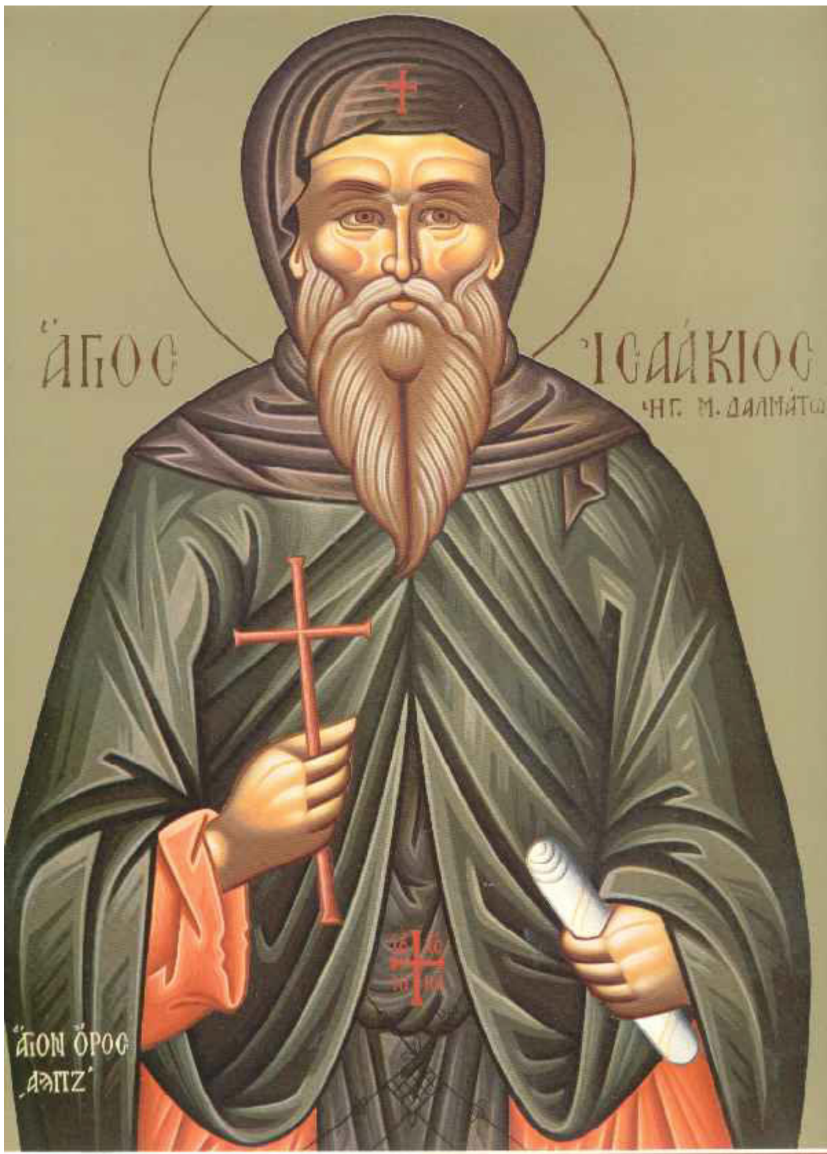
Όσιος Ισαάκιος ο Ομολογητής ηγούμενος Μονής Δαλμάτων