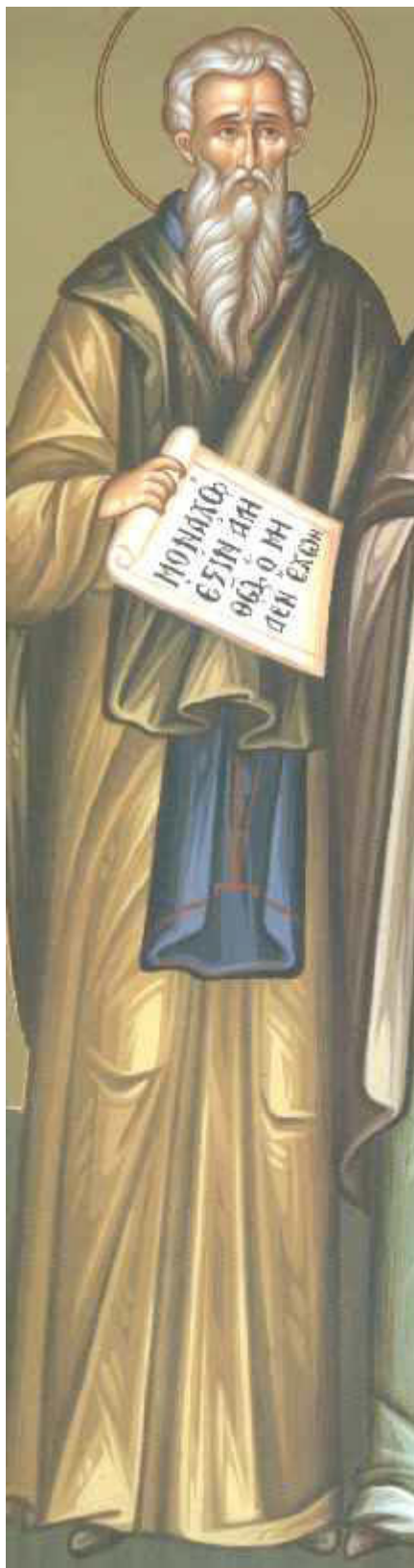
Όσιος Ισαάκιος ο Ομολογητής ηγούμενος Μονής Δαλμάτων