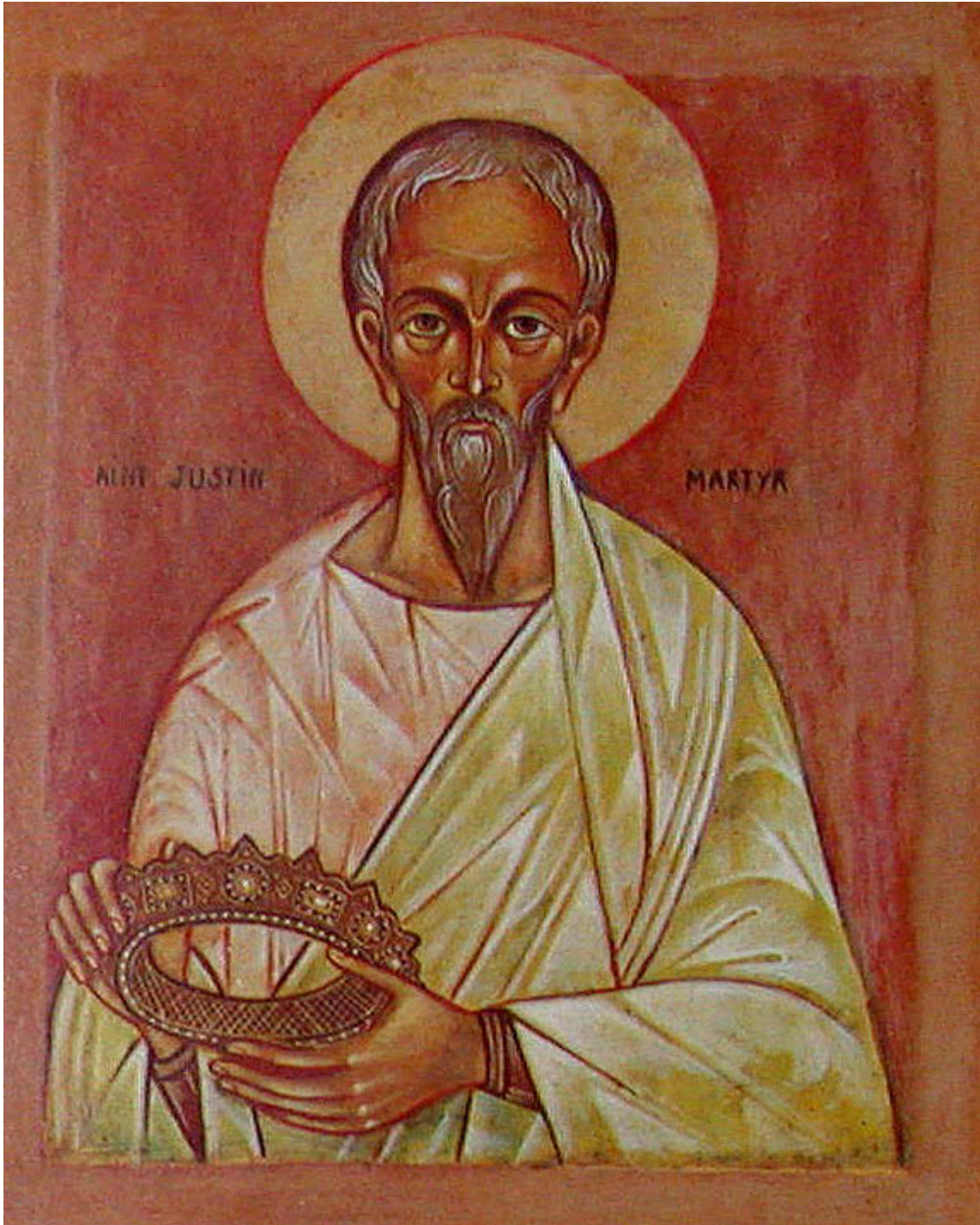
Άγιος Ιουστίνος ο Απολογητής και φιλόσοφος