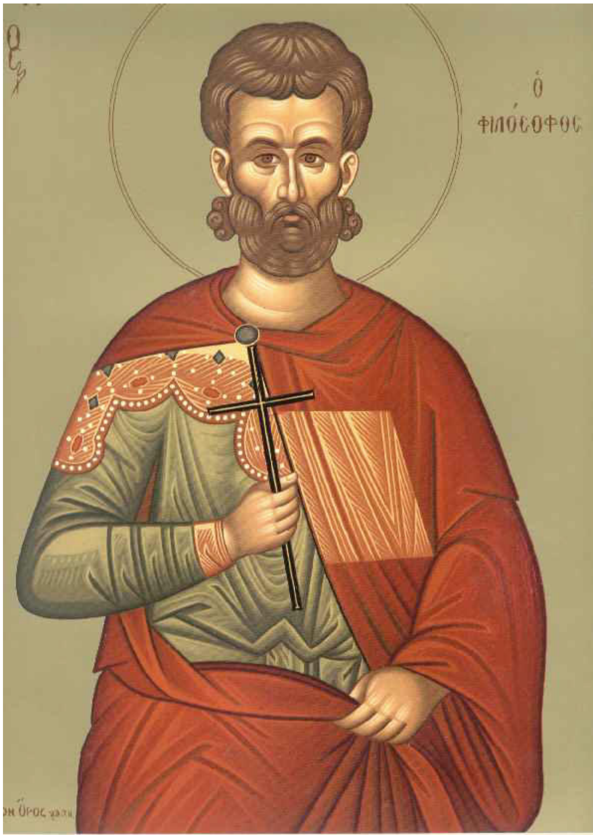
Άγιος Ιουστίνος ο Απολογητής και φιλόσοφος