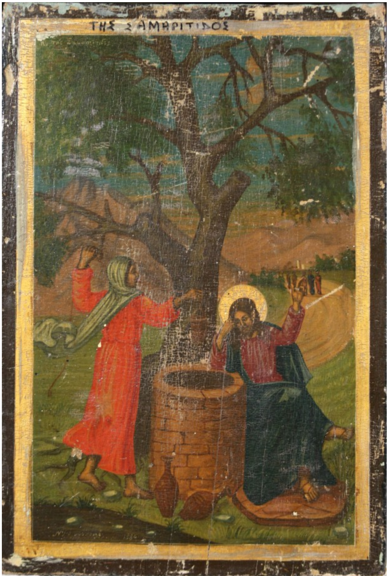
Κυριακή της Σαμαρείτιδος - Ι.Ν. Ζωοδόχου Πηγής, Λαρίσης ( www.panagialarisis.gr )