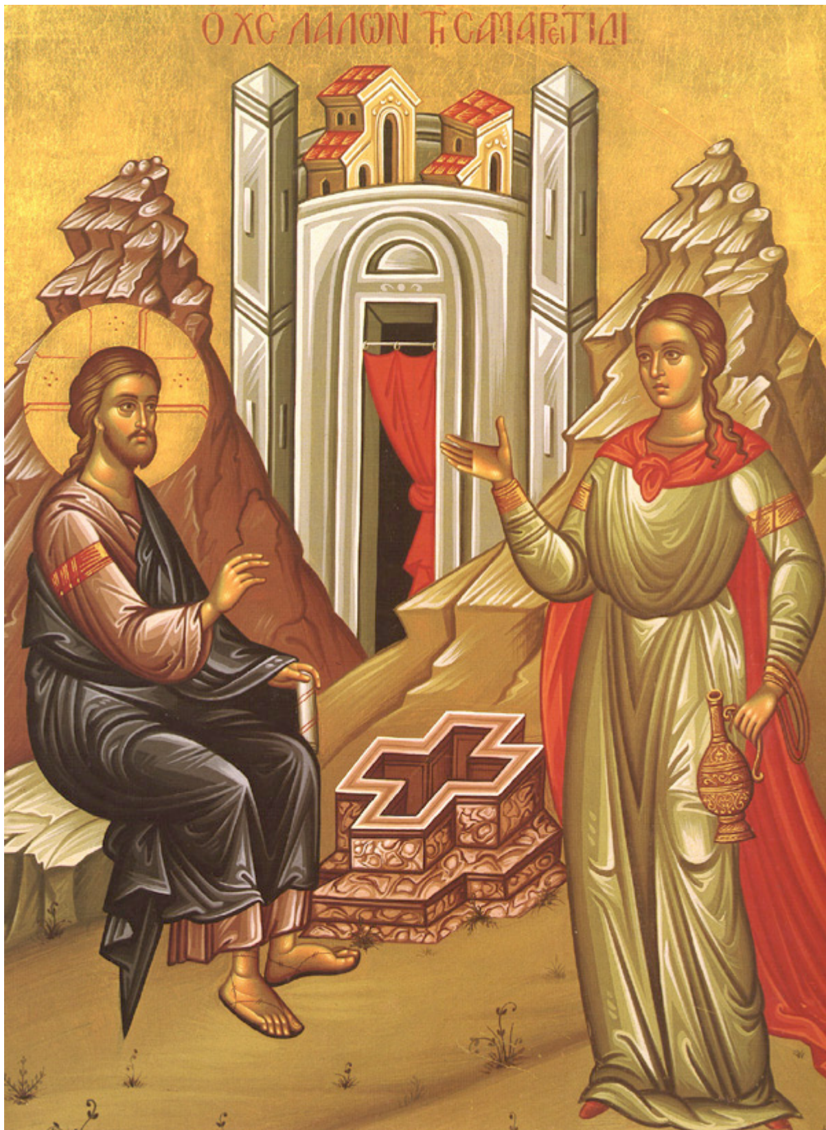
Κυριακή της Σαμαρείτιδος