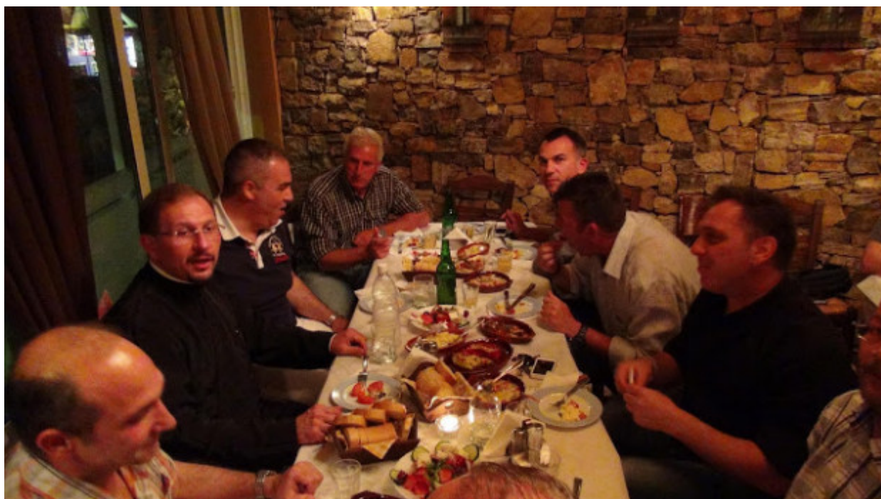
Ο Μητροπολίτης Κυδωνιών δείπνησε και με παλαιούς συμμαθητές του μέσα σε συγκινητική ατμόσφαιρα