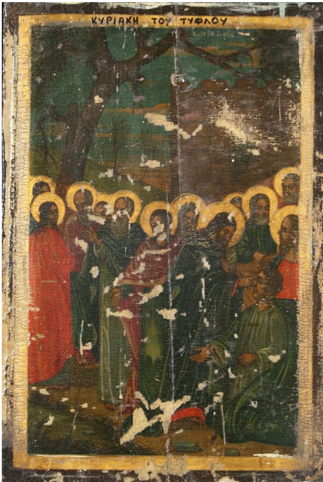
Ο Χριστός ιώμενος τον τυφλόν - Ι.Ν. Ζωοδόχου Πηγής, Λαρίσης ( www.panagialarisis.gr )