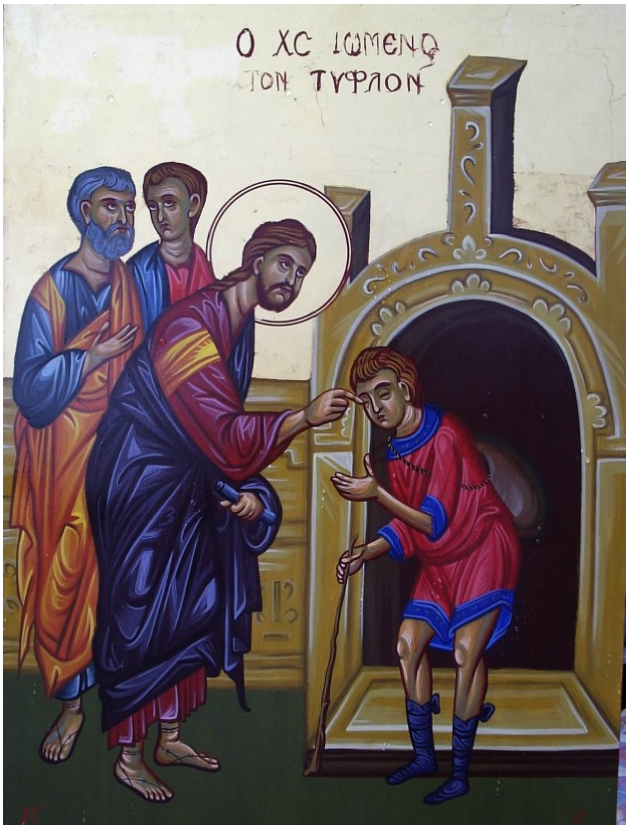
Ο Χριστός ιώμενος τον τυφλόν