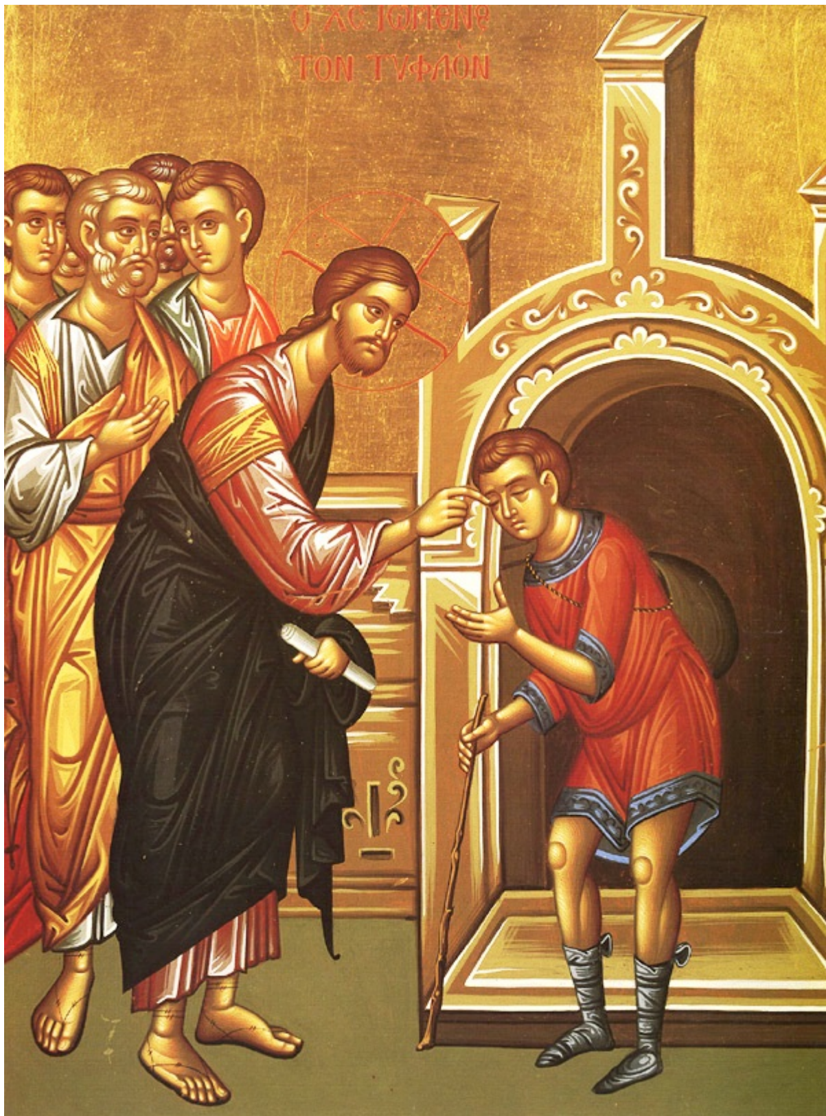
Ο Χριστός ιώμενος τον τυφλόν