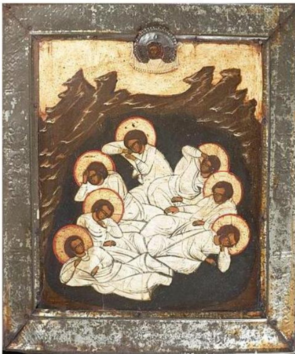
Άγιοι Επτά Παίδες εν Εφέσω