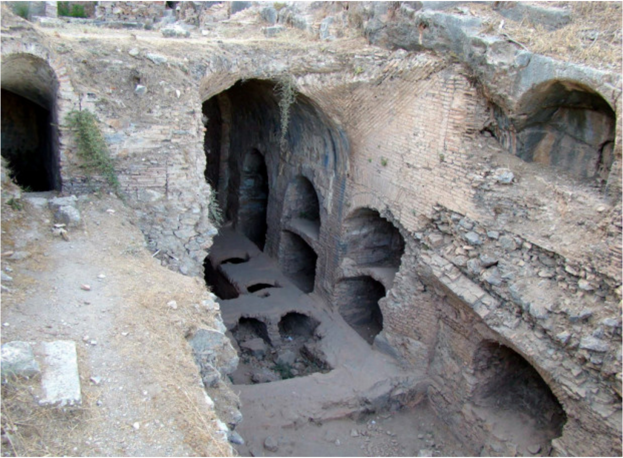
Το σπήλαιο των Επτά Παίδων στην Έφεσο