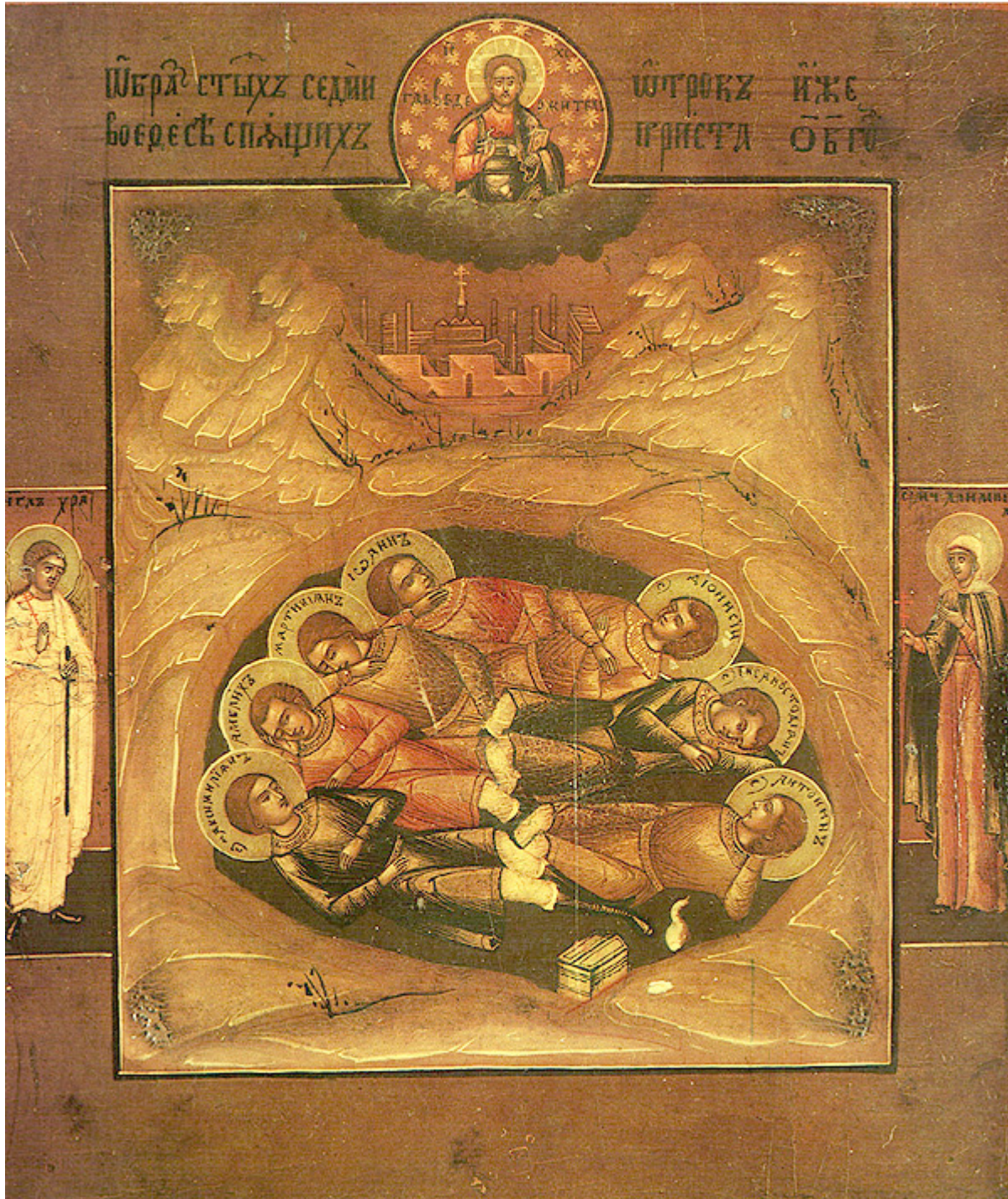
Ἅγιοι Ἑπτὰ Παῖδες ἐν Εφέσω

Τὸν ἑπτάρηθμον τιμῶ χορὸν Μαρτύρων, Δείξαντα Ἀνάστασιν νεκρῶν τῷ κόσμῳ Τῇ δὲ τετάρτῃ νεκροέγερτοι ξύνθανον ἑπτά.