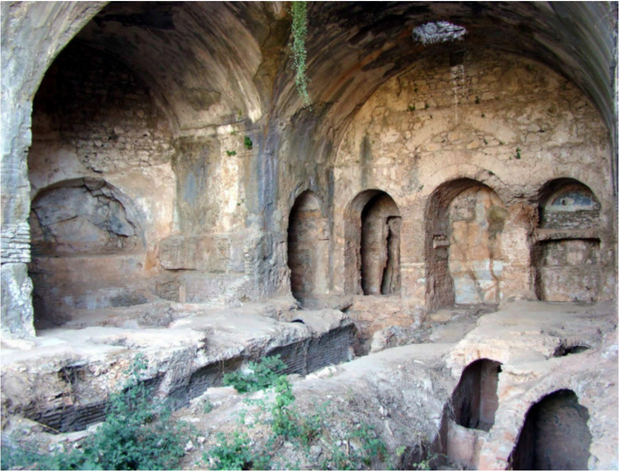
Το σπήλαιο των Επτά Παίδων στην Έφεσο