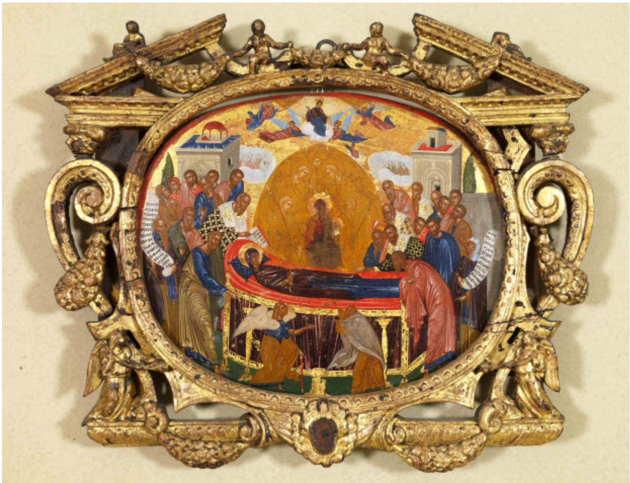
Κοίμηση της Θεοτόκου - άγνωστος ζωγράφος από την Κρήτη, γύρω στο 1600 μ.Χ.