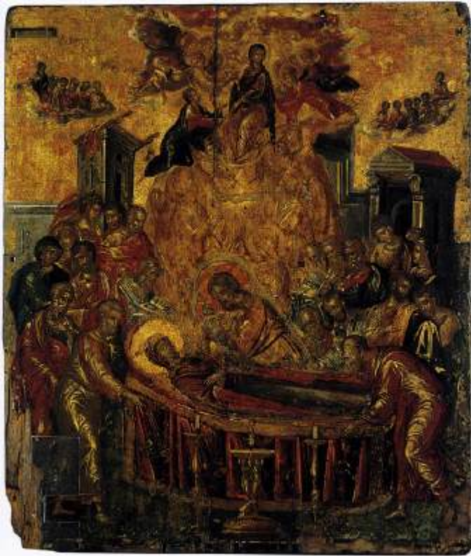
Κοίμηση της Θεοτόκου - Δομήνικος Θεοτοκόπουλος (El Greco) 16ος αι. μ.Χ. - Καθεδρικός Ναός Κοίμησης της Θεοτόκου Ερμούπολη - Σύρος