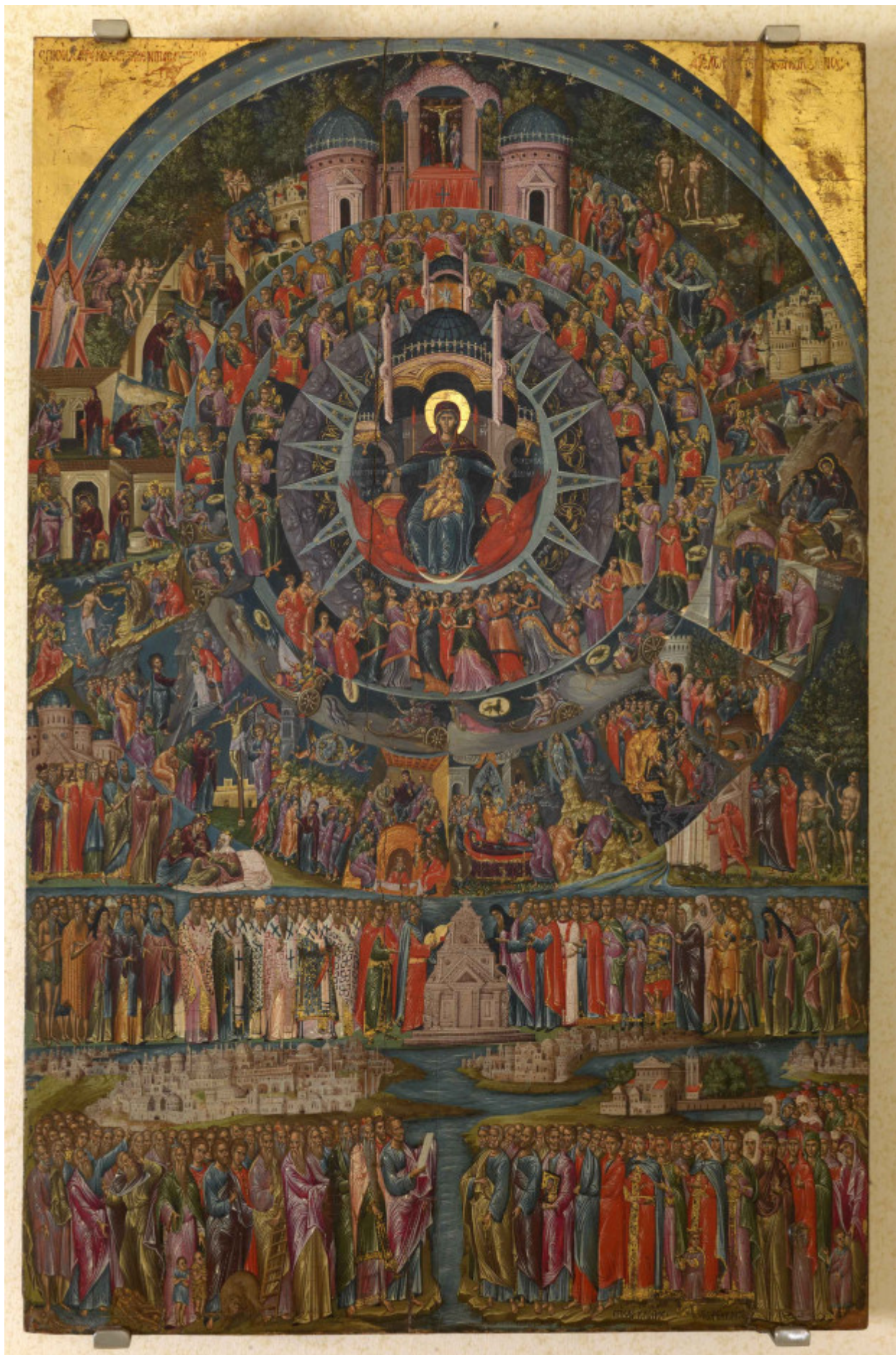
Εικονογράφηση του ύμνου «Επί Σοι Χαίρει», τέλη 16ου αιώνα μ.Χ., Γεώργιος Κλόντζας