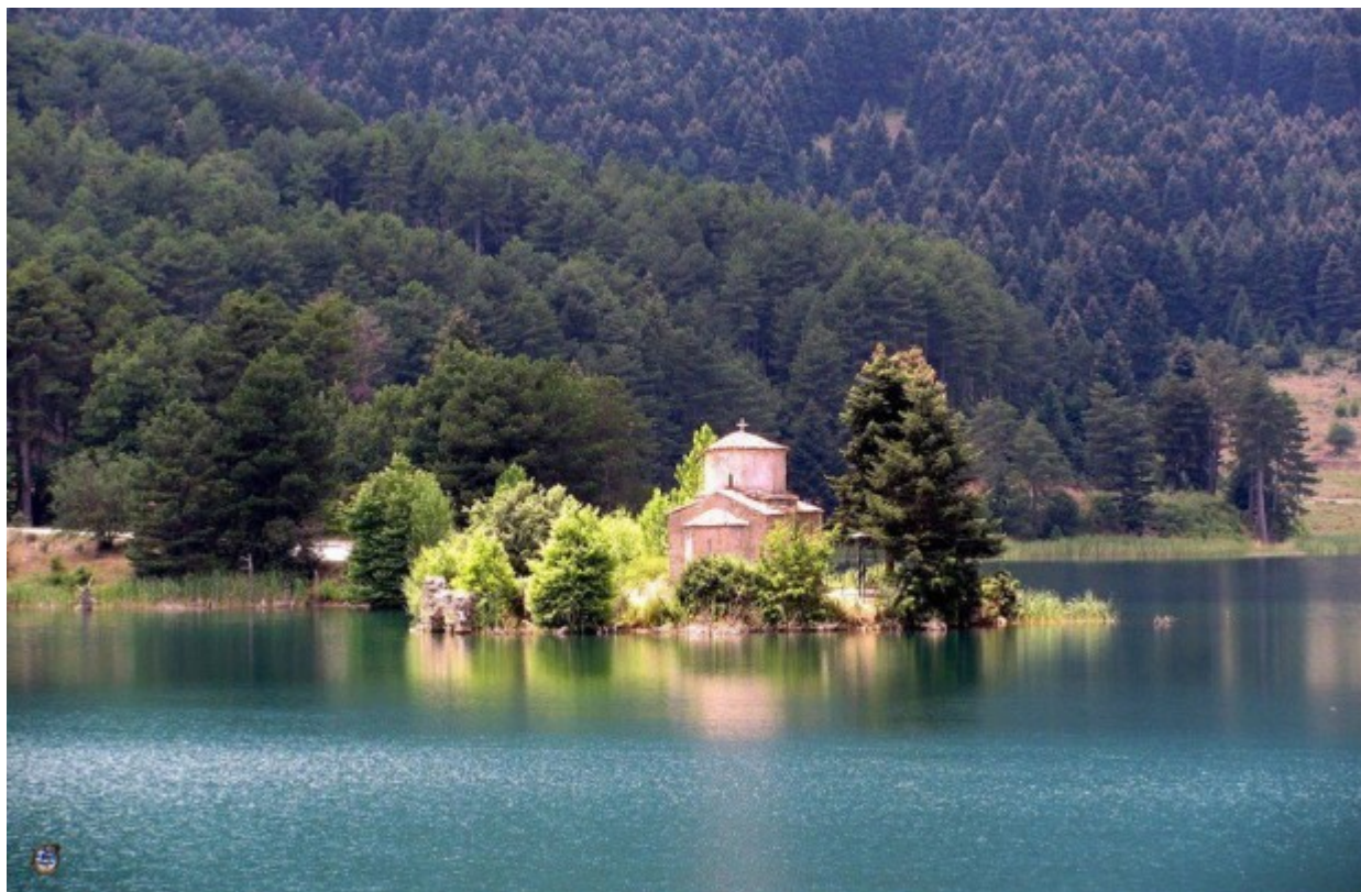
Ο Άγιος Φανούριος στη λίμνη Δόξα