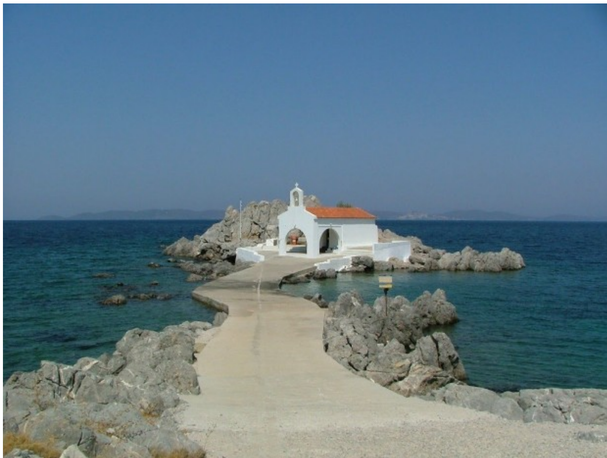
Ο Άγιος Ισίδωρος στο Παντουκιός της Χίου