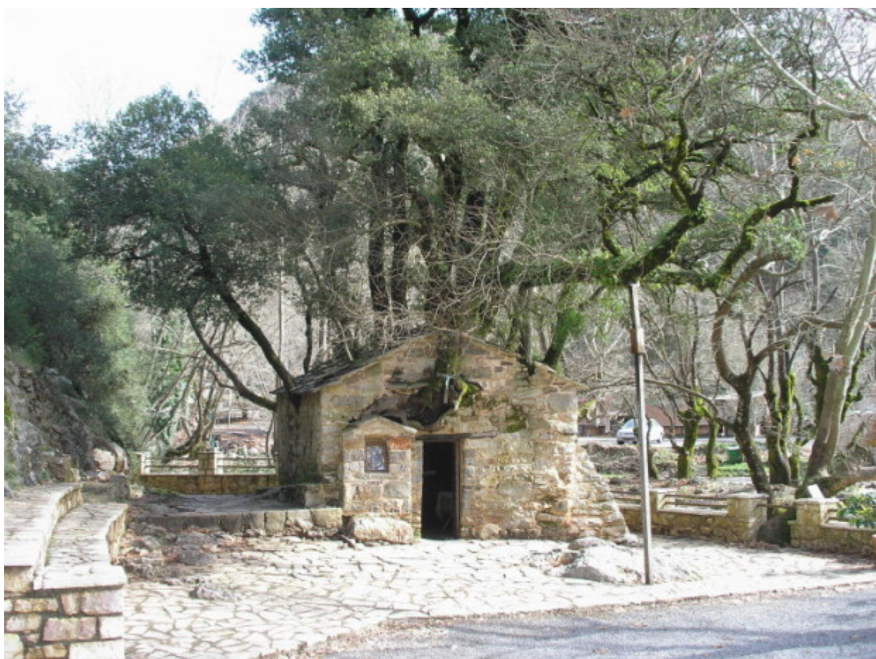
Η Αγία Θεοδώρα στη Βάστα Αρκαδίας