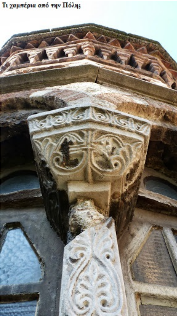
Η Μονή διαθέτει αξιοζήλευτη κεραμόπλαστη διακόσμηση

Στον χώρο της Μονής υπάρχουν τάφοι αυτοκρατόρων και μελών της οικογενείας των Κομνηνών και των Παλαιολόγων, όπως επίσης και ο τάφος του Μιχαήλ Γλαβά στο παρεκκλήσι καθώς και πλήθος αριστοκρατών της εποχής μετά την Άλωση. Πόσοι τάφοι και πόσα λείψανα αυτοκρατόρων και σπουδαίων ανθρώπων βρίσκονται ξεχασμένα στα αγιασμένα χώματα της Πόλης είναι ασύλληπτο να το χωρέσει ο απλός νους.