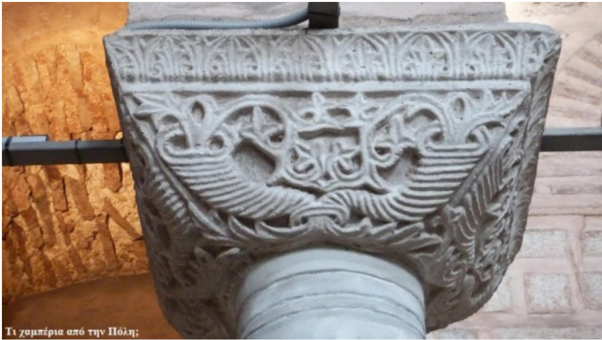
Τι γαμπέρια από την Πόλη;

Λεβητοειδές κιονόκρανο. Η επίπεδη γλυπτή διακόσμηση αποτελεί τον κατεξοχήν βυζαντινό τύπο κίονα