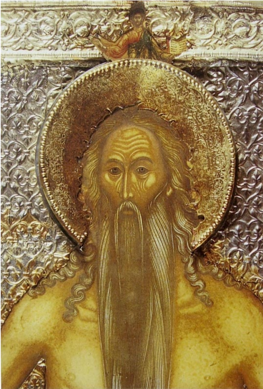
Όσιος Ονούφριος ο Αιγύπτιος