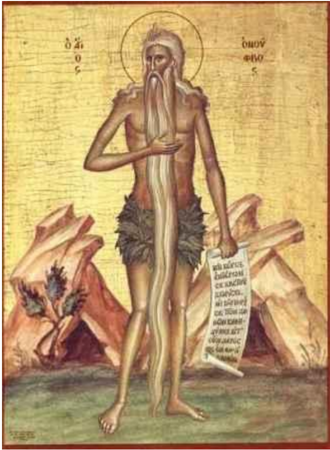
Όσιος Ονούφριος ο Αιγύπτιος