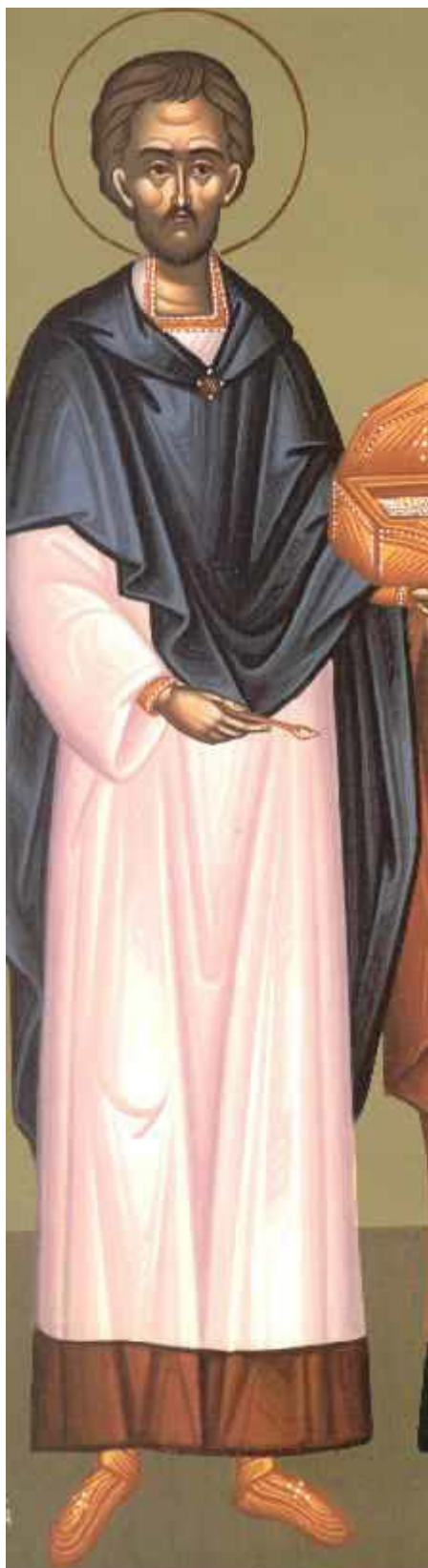
Άγιος Κύρος ο Ανάργγυρος