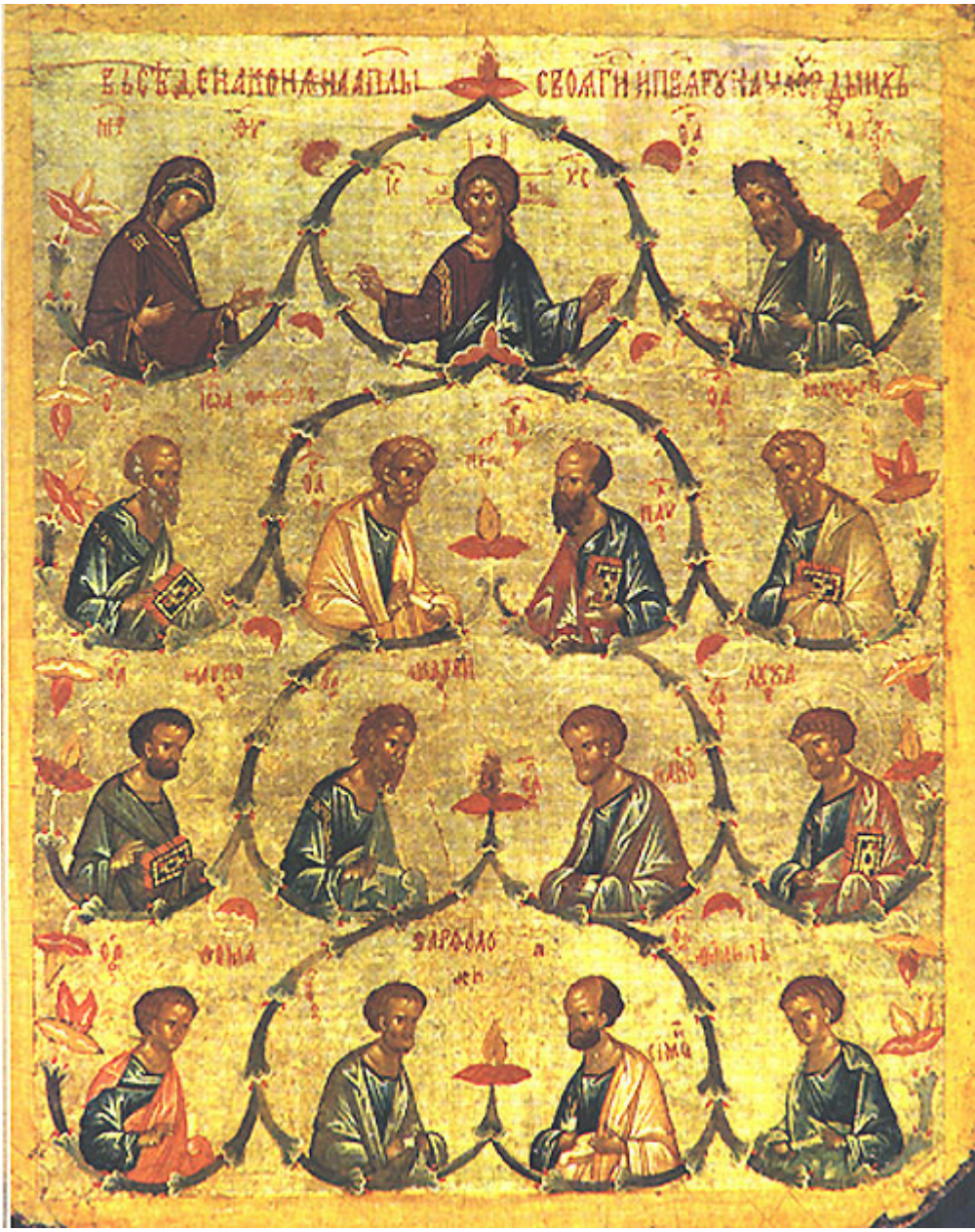
Οι Άγιοι Δώδεκα Απόστολοι