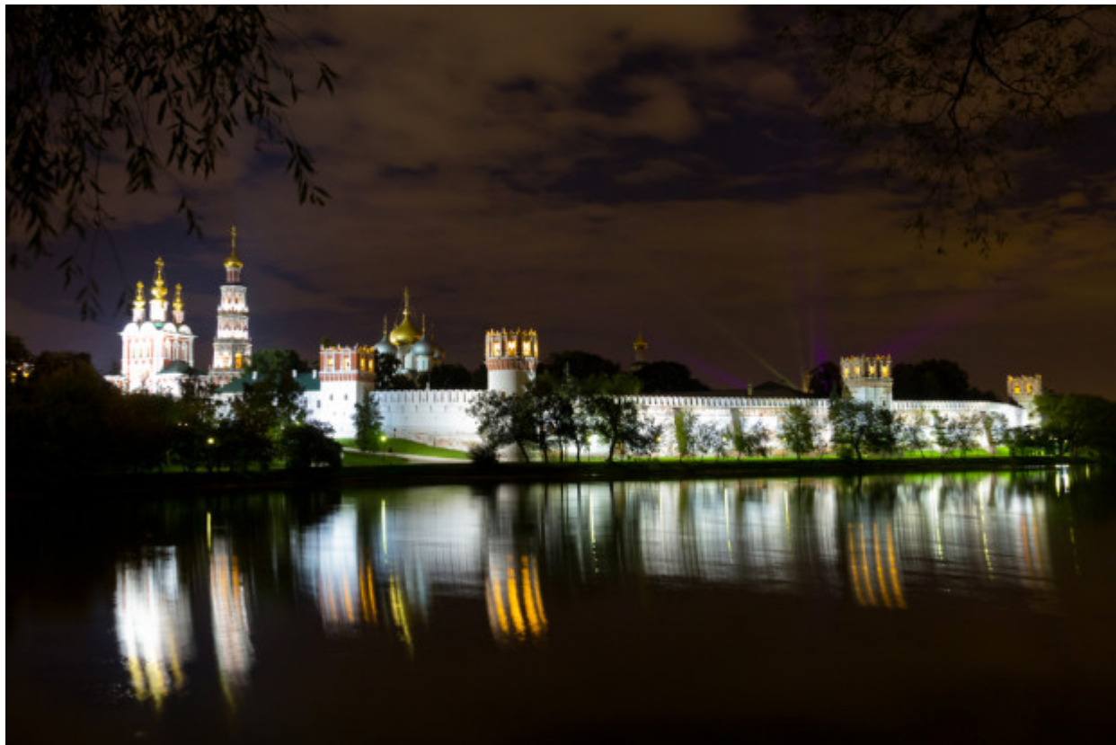
Η ΜΟΝΗ NOVODEVICHIIY. Το Νέο Μοναστήρι Γυναικών βρίσκεται δίπλα στον ποταμό Μόσχοβα και είναι ένα ήσυχο καταφύγιο στην πολύβουη πόλη της Μόσχας. Το συγκρότημα περιλαμβάνει ένα όμορφο κτήριο του 17ου αιώνα, το μοναστήρι που λειτουργεί και πάλι, και ένα νεκροταφείο με ιδιαίτερη ατμόσφαιρα όπου εκεί είναι θαμμένοι οι πιο διάσημοι συγγραφείς, ποιητές, πολιτικοί και δημόσια πρόσωπα της Ρωσίας.