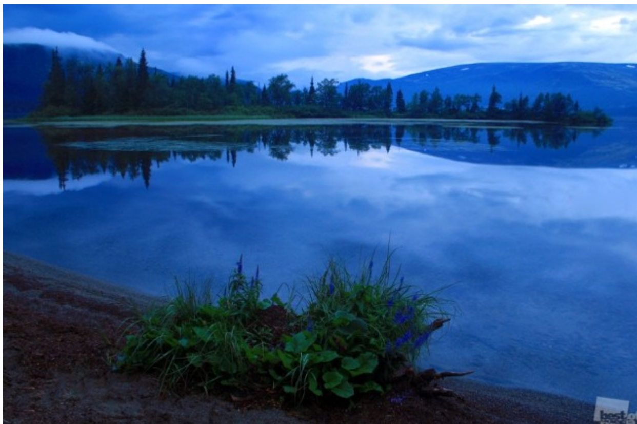
Έτσι, ακόμη και αν είναι σκοτεινή το μισό χρόνο... // «Η νύχτα της πολικής ημέρας», Ρέβντα