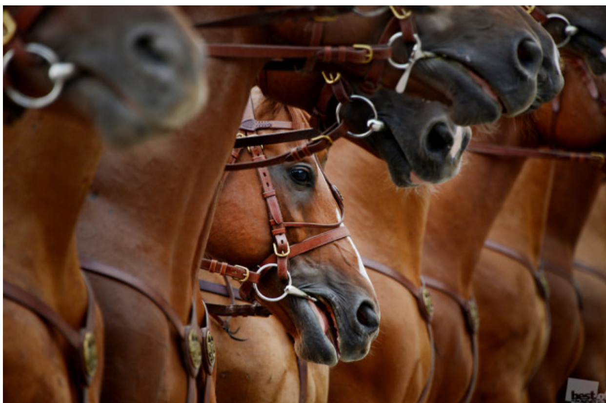
Πάντα θα υπάρχει κάποιος δίπλα σου // «Τα άλογα», Μόσχα.