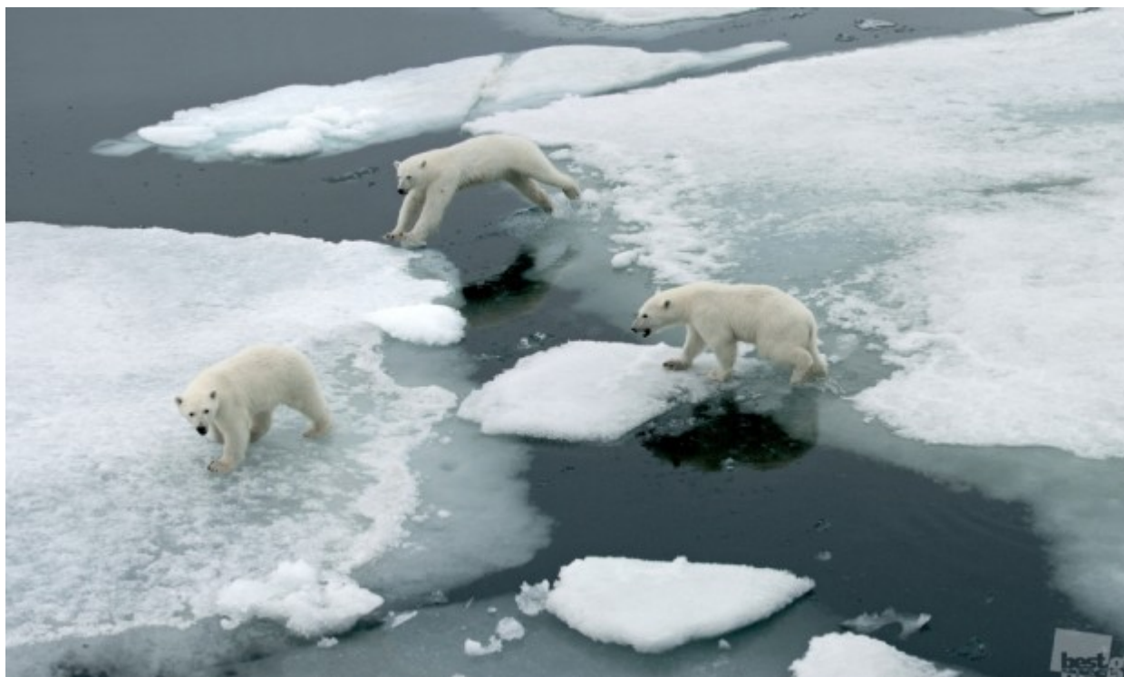
Ωστόσο, μπορεί να είναι χαρούμενη. // Αρκούδες, Γη του Franz Josef