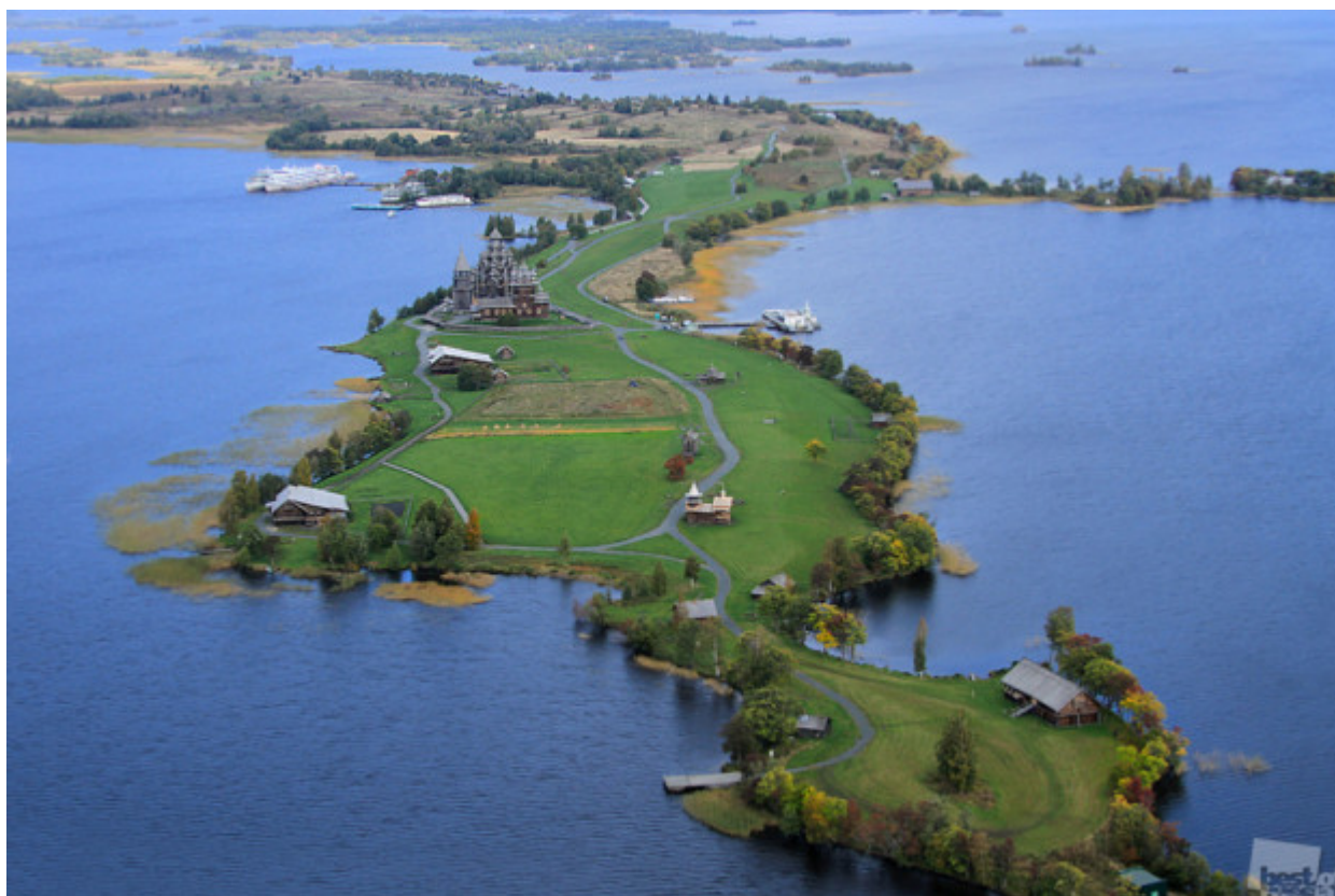
Μπορεί να είναι μια χαμένη γη στο κέντρο του άπειρου υγρού χώρου // Κίζι, Πετροζαβόντσκ