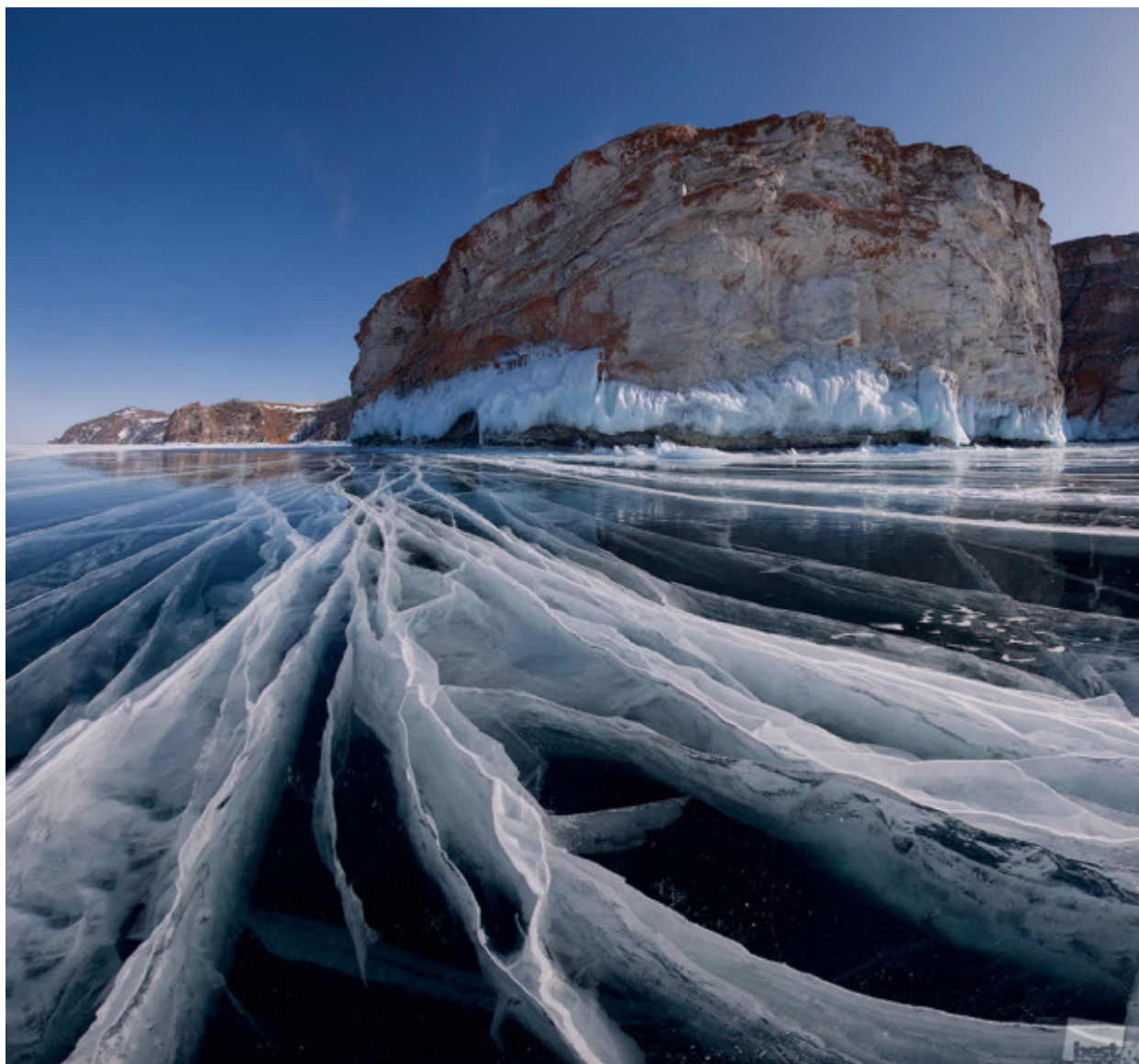
Αν κάνει κρύο έξω ... // «Το Μαμούθ», Κουζίρ.