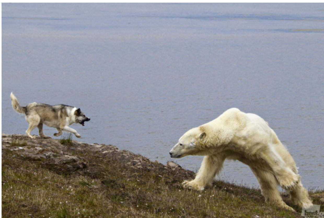
Ρωσική φύση διαθέτει απίστευτα μεγάλη ποικιλία: μπορεί να είναι άγρια και λυσσαλέα // «Η μάχη», Σάλεκχαρντ, στην περιοχή Γιάμαλο-Nenetsky.