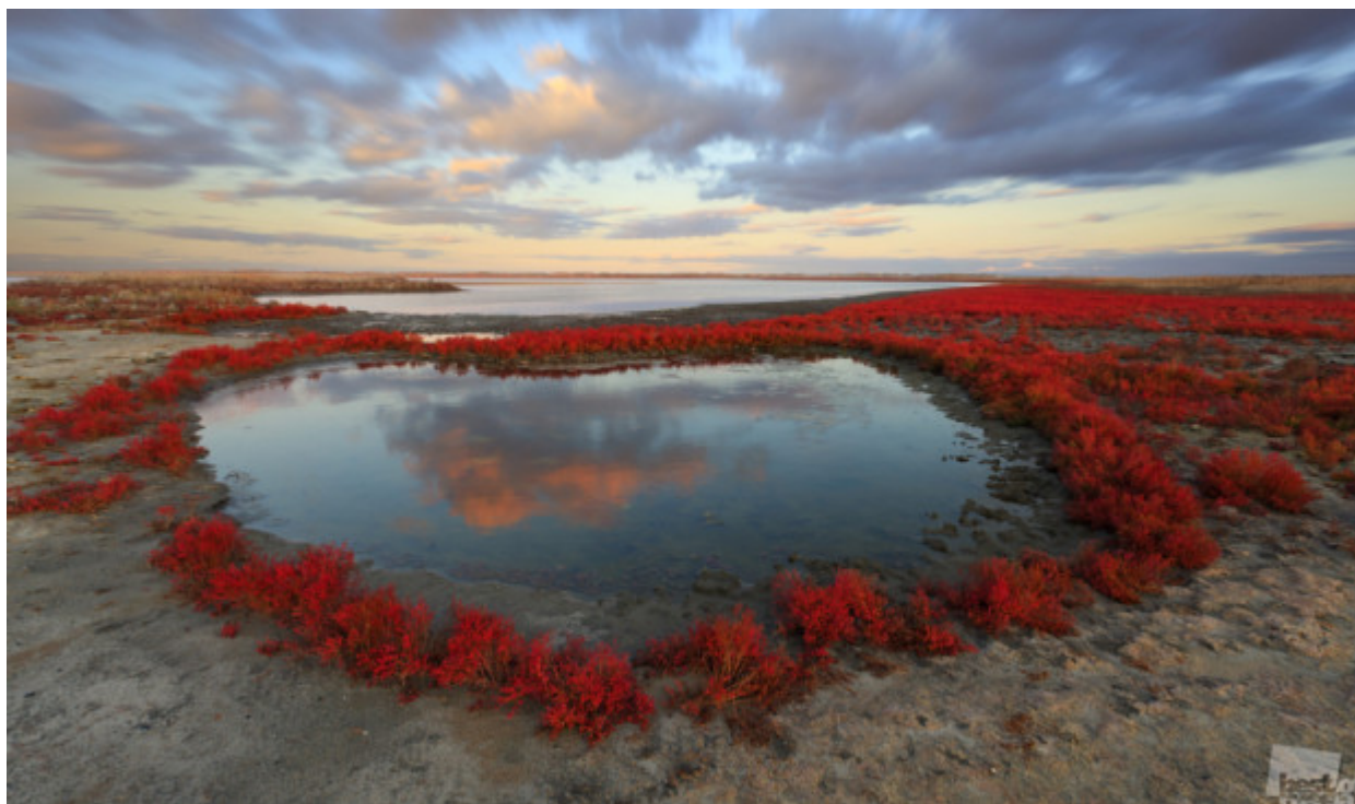
Ή το αντίθετο – μια μικρή άσση στην καρδιά μιας θαμνώδους ερήμου / «Πιάνοντας τα σύννεφα», οικισμός Μιάσκοε, Τσελιάμπινσκ