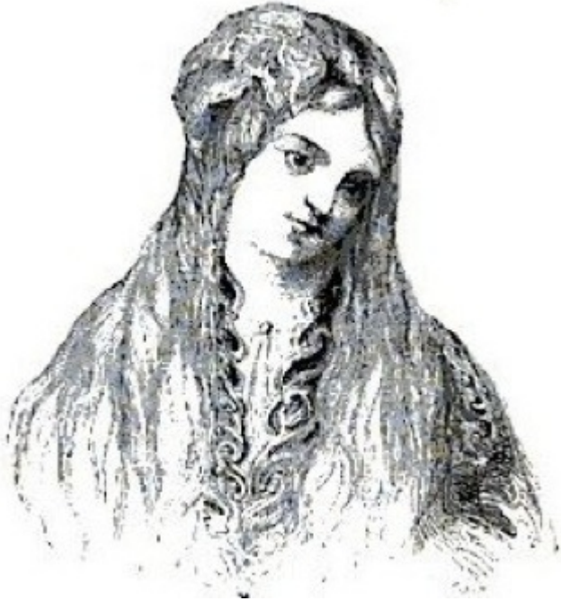
ΤΟ ΣΚΙΤΣΟ ΤΗΣ ANNE HALL ΓΙΑ ΤΗΝ Γ. ΜΟΧΆΛΒΗ, ΕΜΠΝΕΥΣΜΈΝΟ ΑΠΌ ΤΗΝ ΟΜΟΡΦΙΑ ΤΗΣ