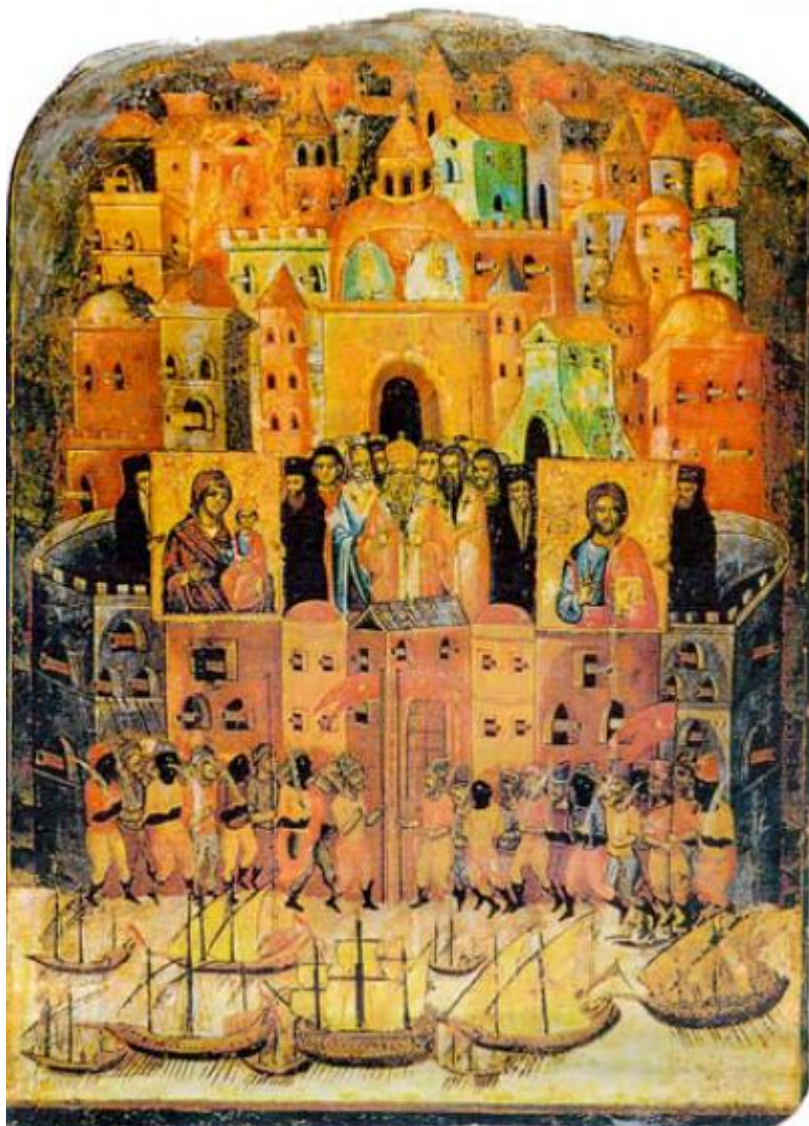
2. Η πολιορκία της Κωνσταντινουπόλεως από τους Αβάρους τον Ζ' αί., σε Εικόνα του Η' αί. Στα τείχη έχουν τοποθετηθή Εικόνες της Παναγίας και του Χριστού, ώστε να αποτραπή η είσοδος των εισβολέων.

Η πτώση και απώλεια της Πόλης εκλόνισε προς στιγμήν τις συνειδήσεις. Τη σημασία της, άλλωστε, για το Γένος διετύπωσε η Κυπριακή Λαϊκή Μούσα με ένα υπέροχο στιχούργημα της: