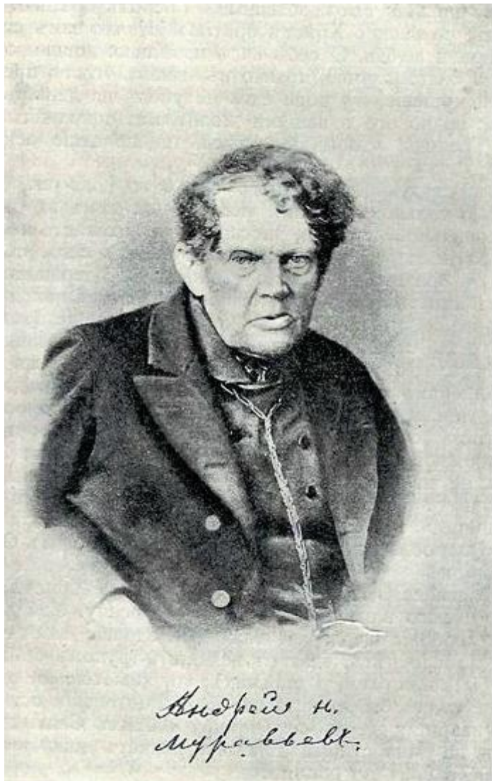
(φωτ. 3) Νικολάεβιτς Μουράβιελ