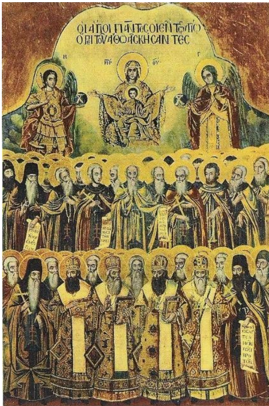
Οι Άγιοι Πάντες οι εν τω Αγίω Όρει του Άθω Ασκήσαντες Φορητή εικόνα Ιεράς Μονής Κουτλουμουσίου (19ος αι.)