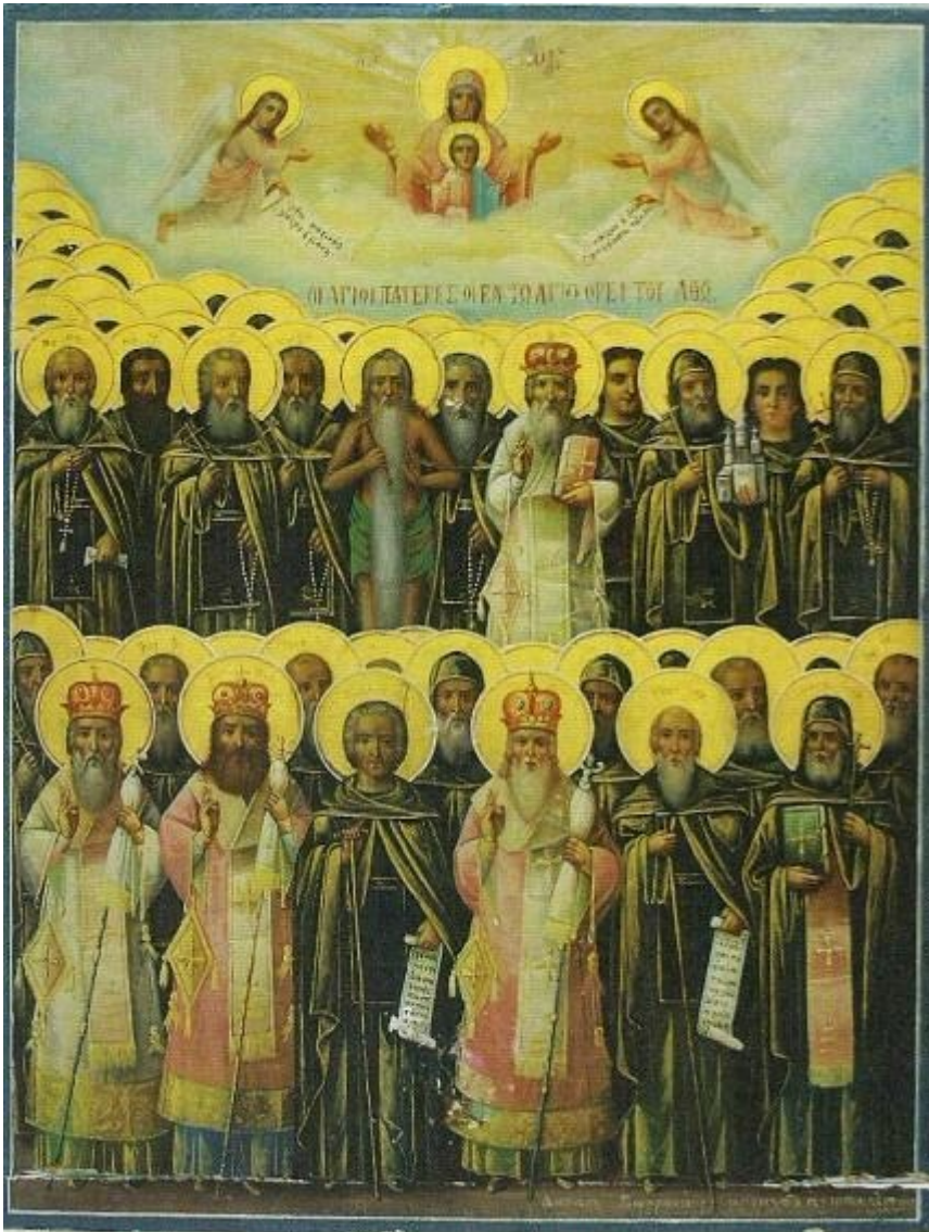
Οι Άγιοι Πατέρες οι εν τω Αγίω Όρει του Άθω Φορητή εικόνα Ιεράς Μονής Αγίου Παύλου (αρχές 20ου αι.)