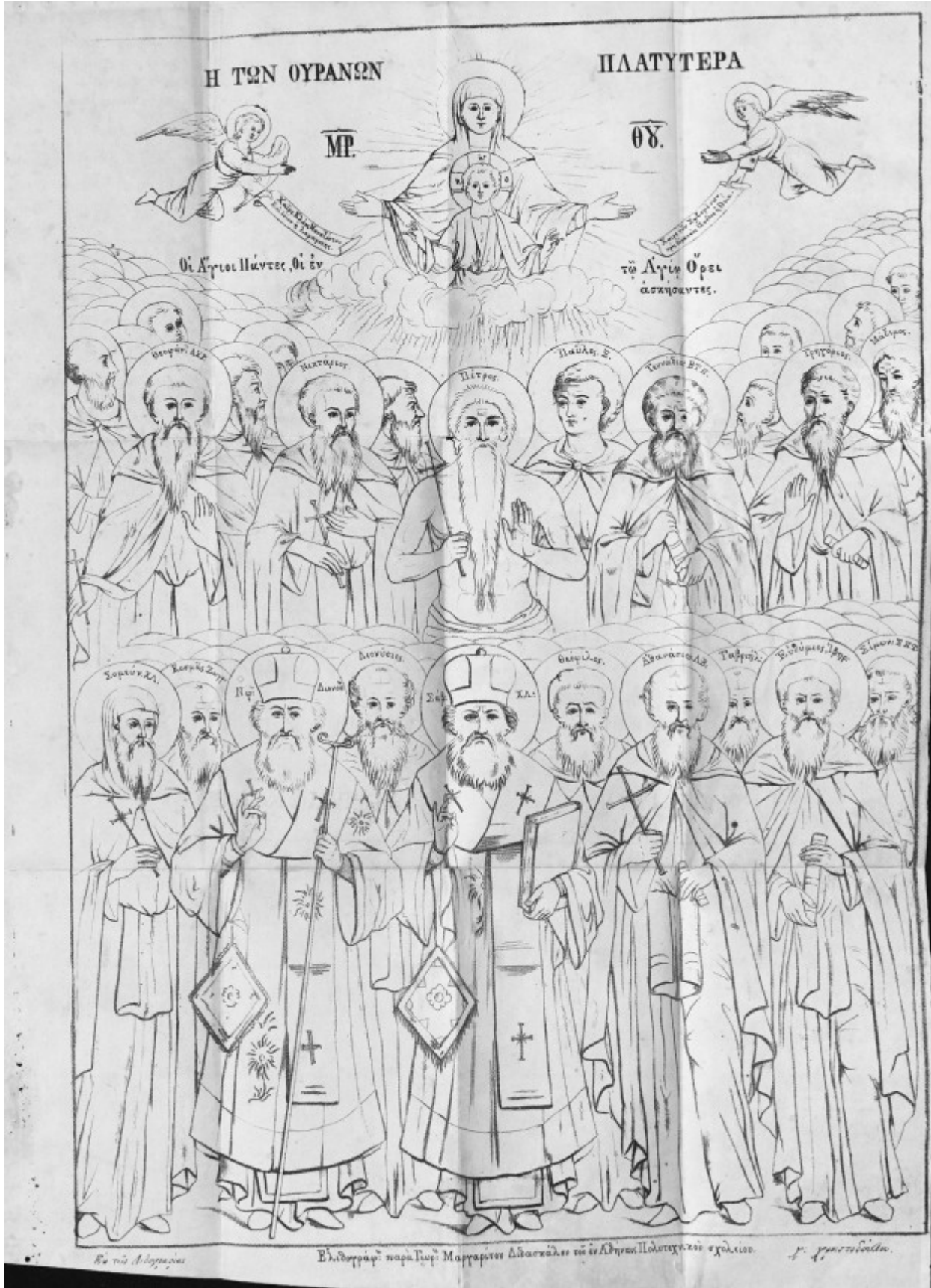
Σύναξη των Αγιορειτῶν Πατέρων