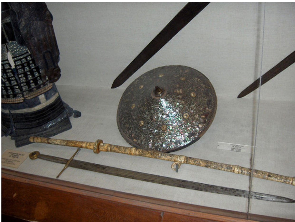
Το σπαθί του Αγίου Στεφάνου του Μέγα όπου βρίσκεται στο Τοπ-Καπί

Ο Άγιος Στεφάνος ο Μέγας ,ο βοεβόδας είχε συνήθεια μετά από κάθε μάχη να χτίζει μοναστήρια και εκκλησίες, ο αριθμός των οποίων ανέρχεται σε πέραν των σαράντα.