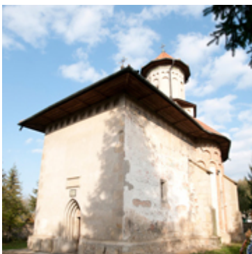
Ι.Ν.Προφήτου Ηλία Χτίστηκε μεταξύ 1 Μαΐου-15 Οκτωβρίου 1488