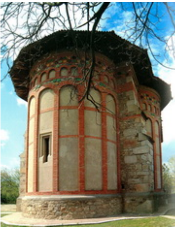
Ι.Ν.Αποτομής της κεφαλής του Αγίου Ιωάννου του Προδρόμου- Βασλούι Χτίστηκε μεταξύ 27 Απριλίου- 20 Σεπτεμβρίου 1490