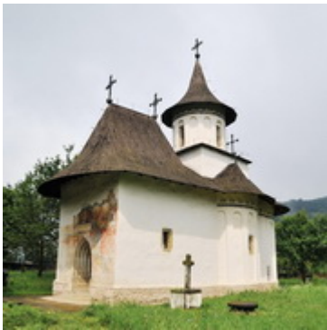
Ι.Ν.Τιμίου Σταυρού- Πατραούτσι 13 Ιουνίου 1487

Image not found or type unknown Ι.Ν.Αγίου Προκοπίου- Μιλισεούτσι Χτίστηκε μεταξύ 8 Ιουνίου-13 Νοεμβρίου 1487