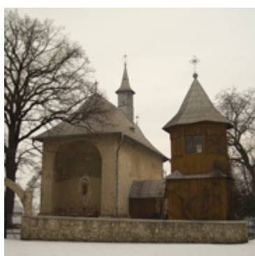
.Ν.Απότομής Τιμίας κεφαλής Αγίου Ιωάννου Προδρόμου- Ρεουσένι Χτίστηκε μεταξύ 8 Σεπτεμβρίου 1503-18 Σεπτεμβρίου 1504