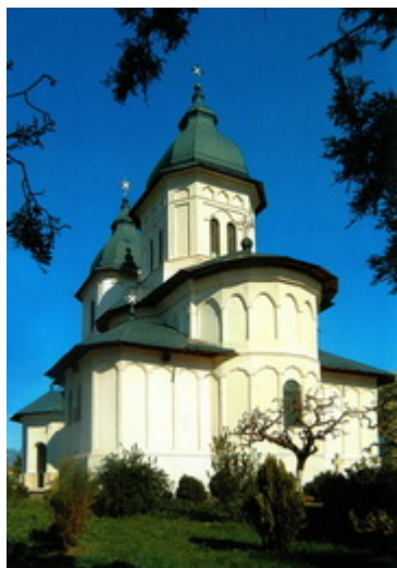
Επισκοπικός Ναός Αγ.Αποστόλων Πέτρου και Παύλου-Χούσι Χτίστηκε μεταξύ ...30 Νοεμβρίου 1495

Ι.Ν.Αγ.Νικολάου-Ντοροχί Χτίστηκε μεταξύ ...-18 Οκτωβρίου 1495