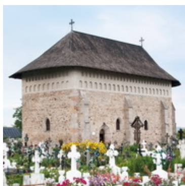
Image not found or type unknown Πυργοειδές καμπαναριό με παρεκκλήσι του Αγίου Ιωάννου του Νέου-Μονή Μπίστριτσα Χτίστηκε μεταξύ...- 13 Σεπτεμβρίου 1498

Ι.Ν.Υψώσεως του Τιμίου Σταυρου-Βολοβέτς Χτίστηκε μεταξύ 2 Απριλίου 1500-29 Αυγούστου 1502