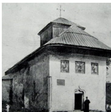
Ι.Ν.Αγίας Παρασκευής Επιβατηνής Ρέμνικου Σαράτ 1504.Ανακατασκευάστηκε 1704.