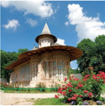
Μονή Βορονέτζς-Εορτάζει στις 23 Απριλίου Χτίστηκε μεταξύ 26 Μαΐου-14 Σεπτεμβρίου 1488