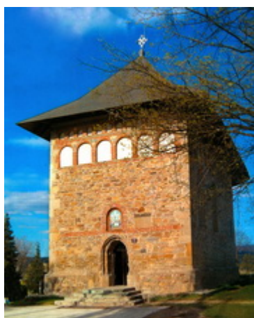
Ι.Ν.Κοιμήσεως της Θεοτόκου Μπορζέστι Χτίστηκε μεταξύ 9 Ιουλίου-12 Οκτωβρίου 1494

Image not found or type unknown Ι.Ν.Αγίου Γεωργίου -Χαρλέου Χτίστηκε μεταξύ 30 Μαΐου-28 Οκτωβρίου