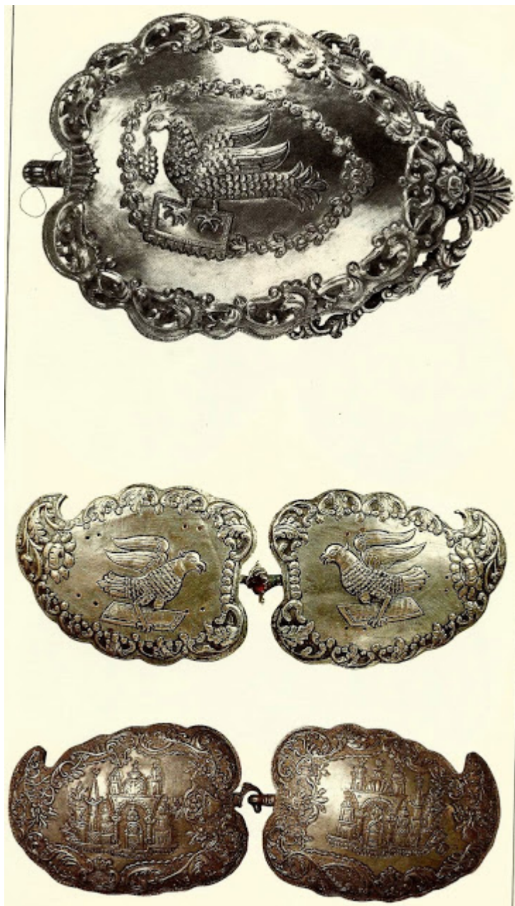
α). Ασημένια «πούκλα» με αετό. Συλλογή Κυπριακού Μουσείου, Λευκωσία.