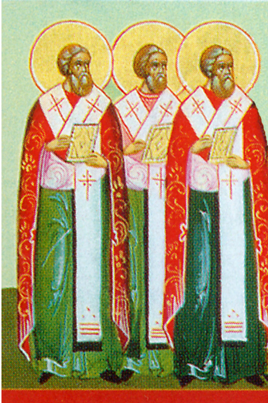
Ἅγιοι Ἀλέξανδρος, Ἰωάννης καὶ Παῦλος ὁ νέος, Πατριάρχες Κωνσταντινούπολης