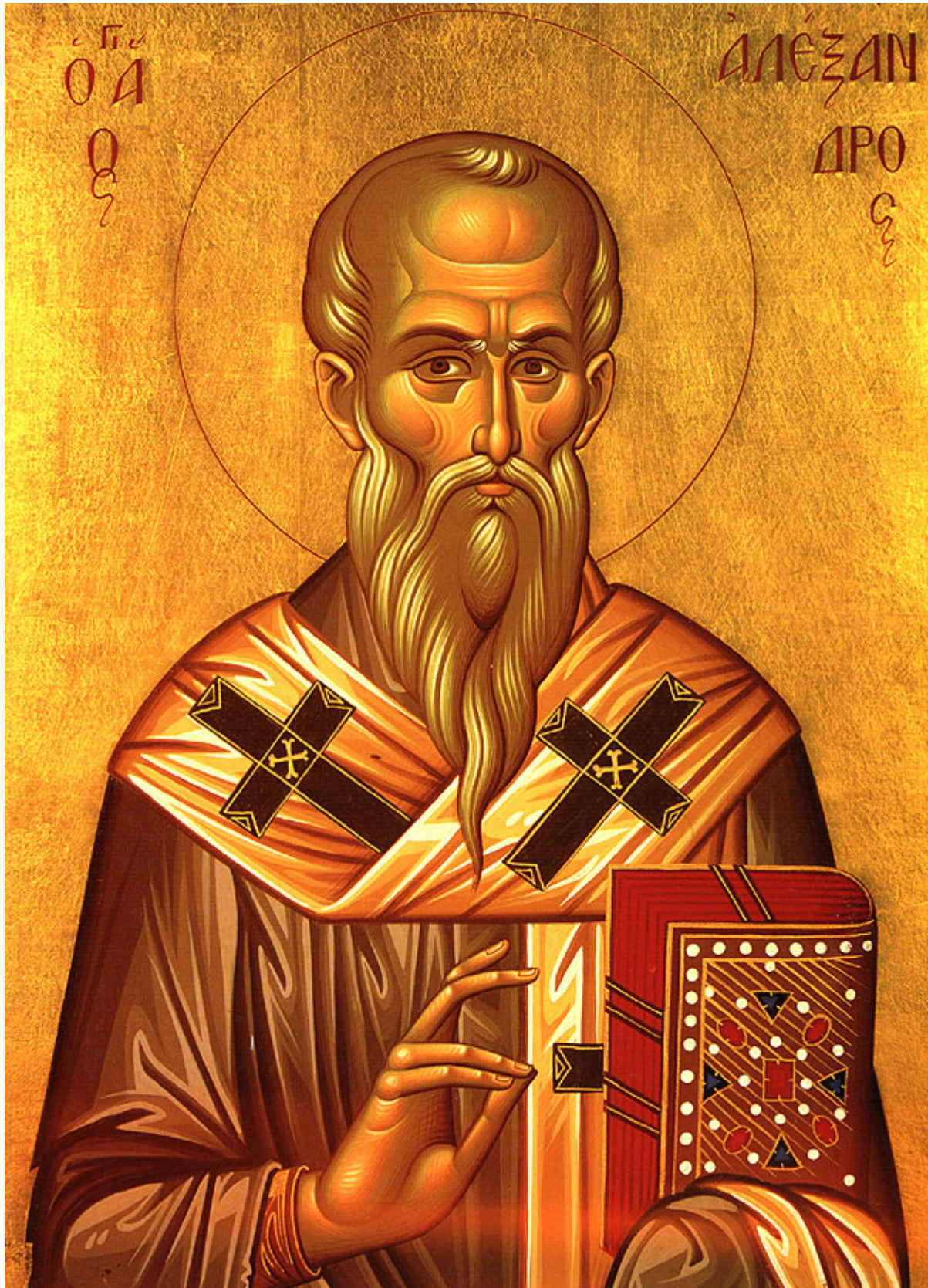
Άγιος Αλέξανδρος Πατριάρχης Κωνσταντινούπολης