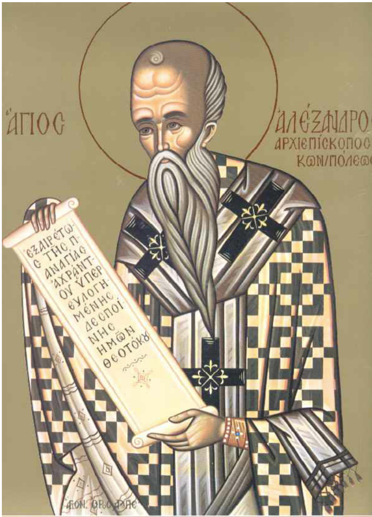
Άγιος Αλέξανδρος Πατριάρχης Κωνσταντινούπολης