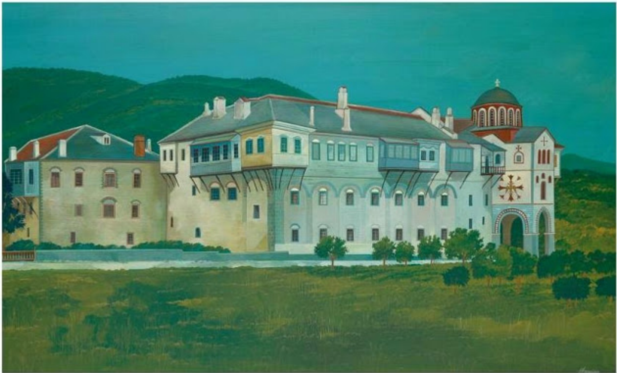
Θανάσης Μπακογιώργος - 1.Μ. Φιλοθέου, ΑΓΙΟΝ ΟΡΟΣ