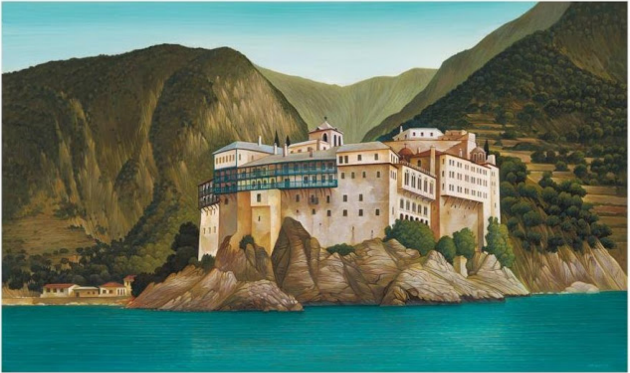
1. Μονή Γρηγορίου, Άγιον Όρος. 80x120 εκ. άκρυλικό