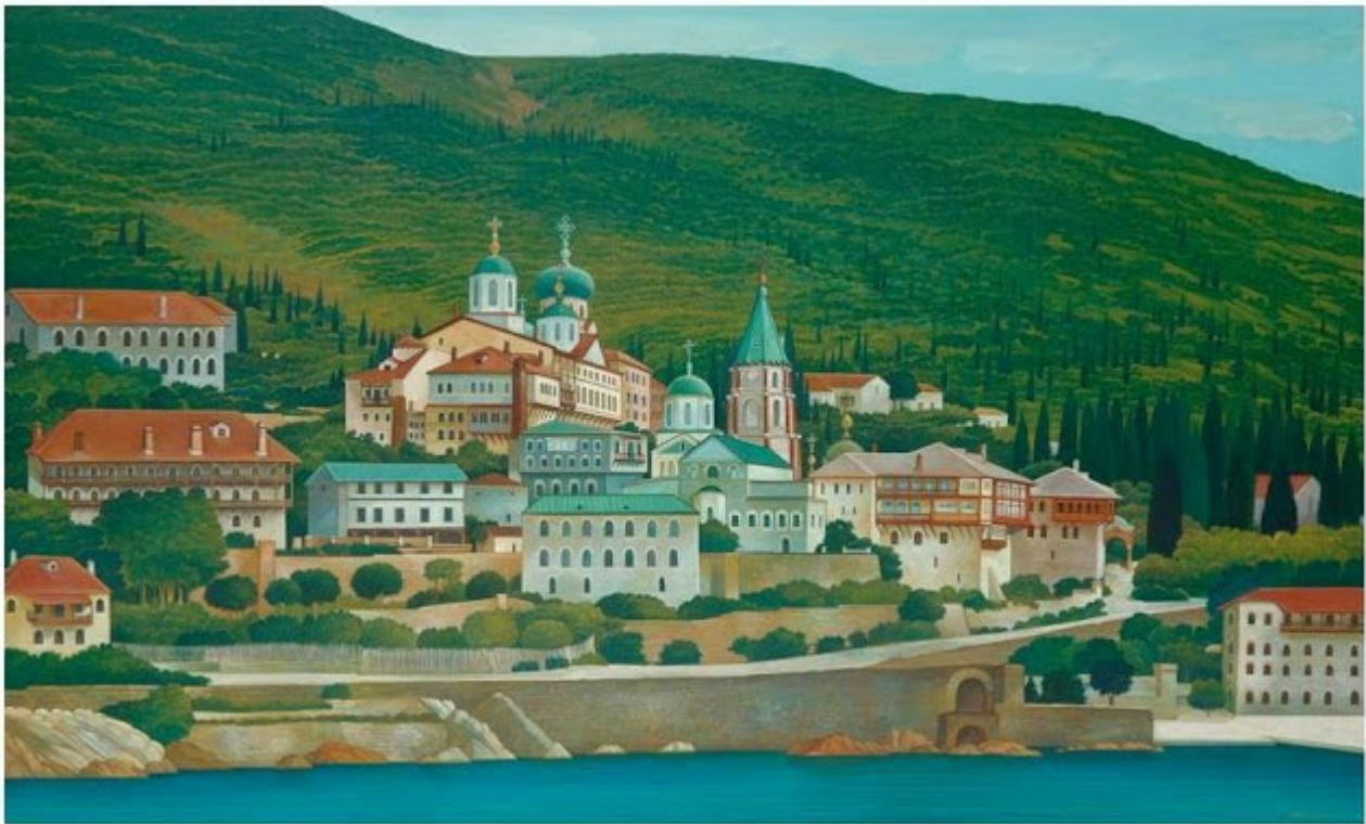
Θανάσης Μπακογιώργος - 1.Μ. Αγίου Παντελεήμονος, ΑΓΙΟΝ ΟΡΟΣ