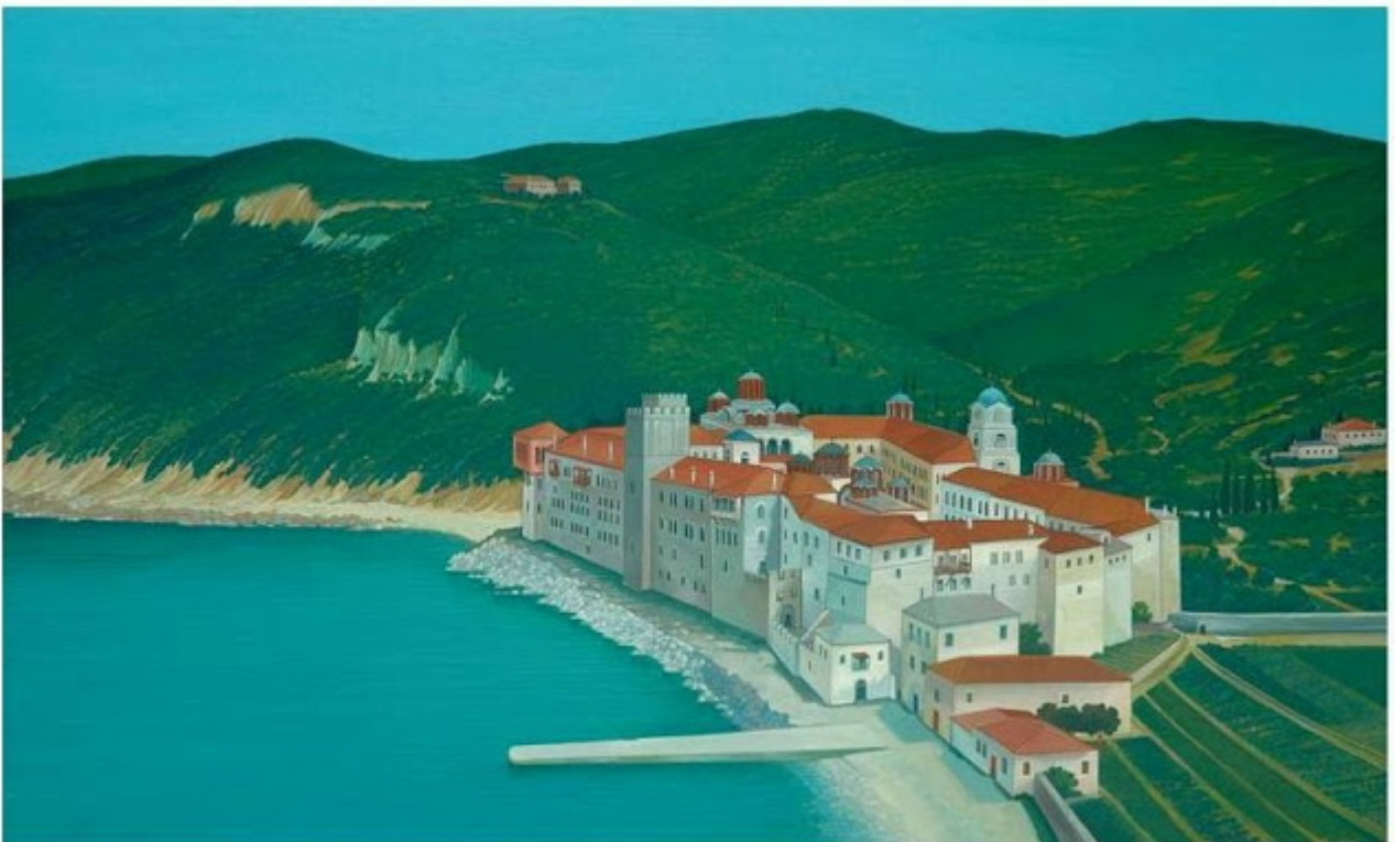
Θανάσης Μπακογιώργος - 1.Μ. Εσφηγμένου, ΑΓΙΟΝ ΟΡΟΣ