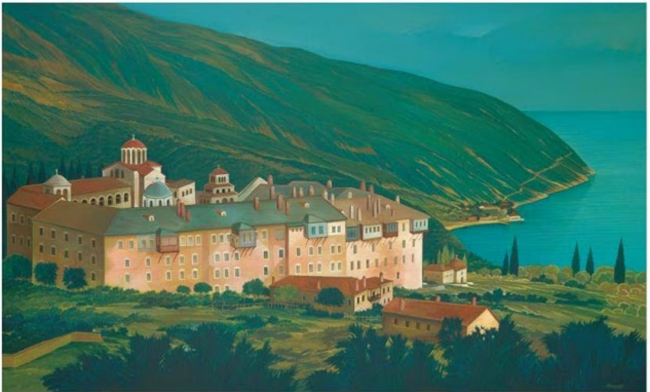
Θανάσης Μπακογιώργος - 1.Μ. Ξηροποτάμου, ΑΓΙΟΝ ΟΡΟΣ