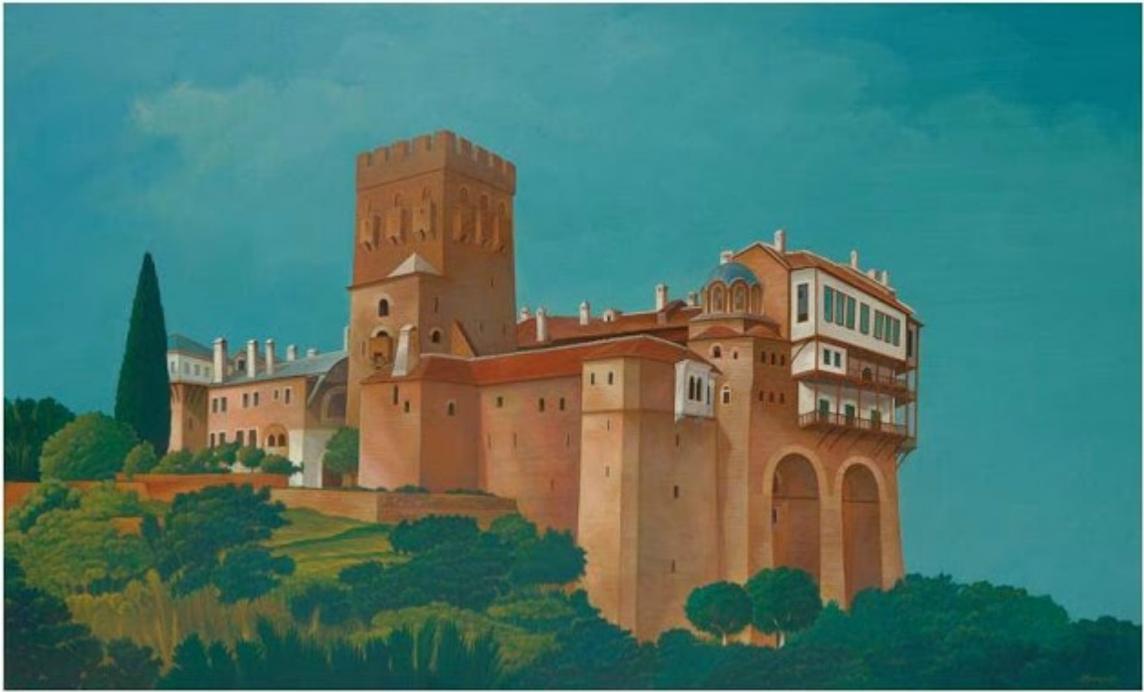
Θανάσης Μπακογιώργος - 1.Μ. Σταυρονικήτα, ΑΓΙΟΝ ΟΡΟΣ