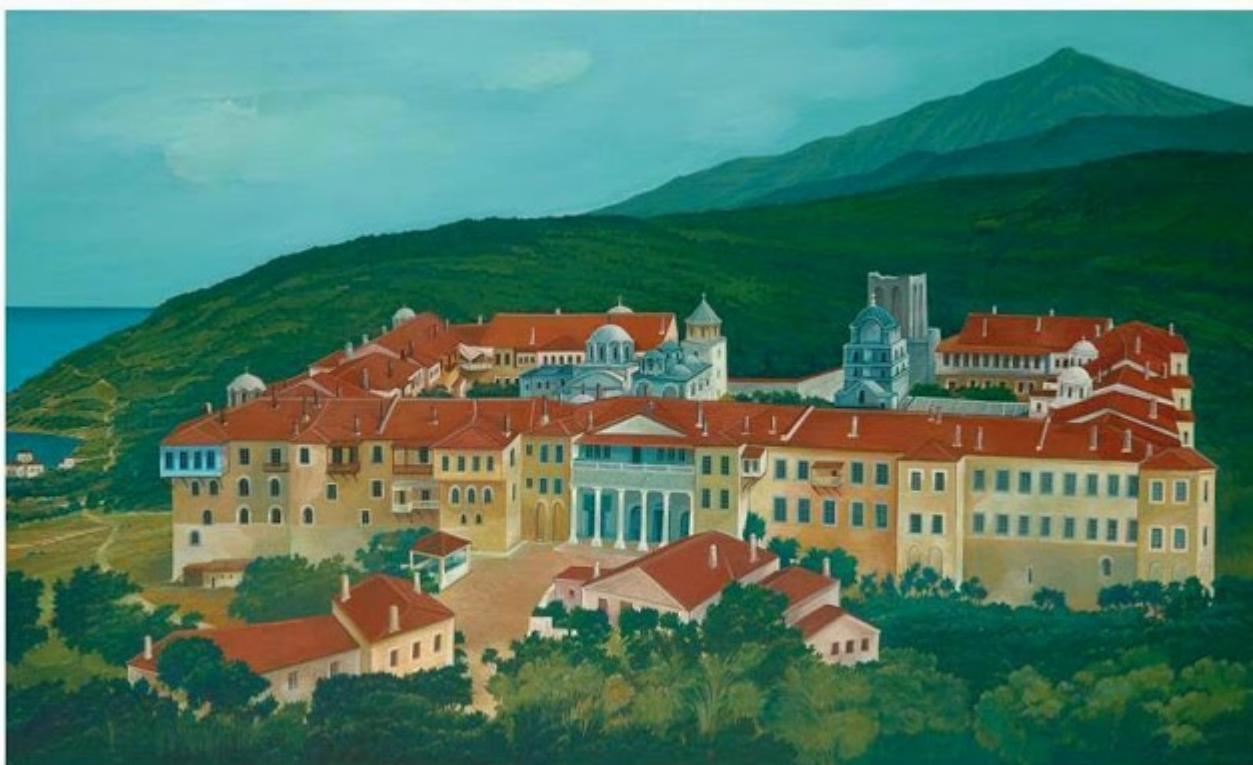
Θανάσης Μπακογιώργος - 1.Μ. Ιβήρων, ΑΓΙΟΝ ΟΡΟΣ