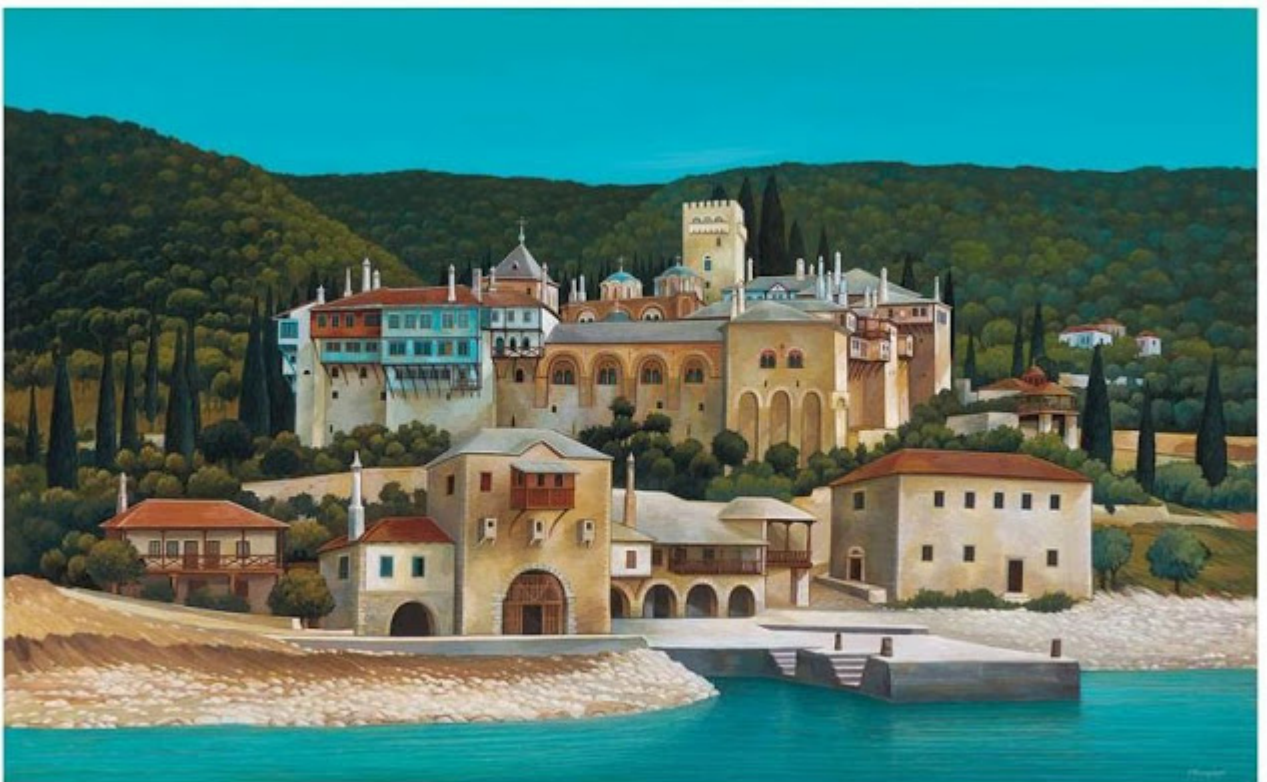
1. Μονή Δοχειαρίου, Άγιον Όρος. 80x120 εκ. άκρυλικό