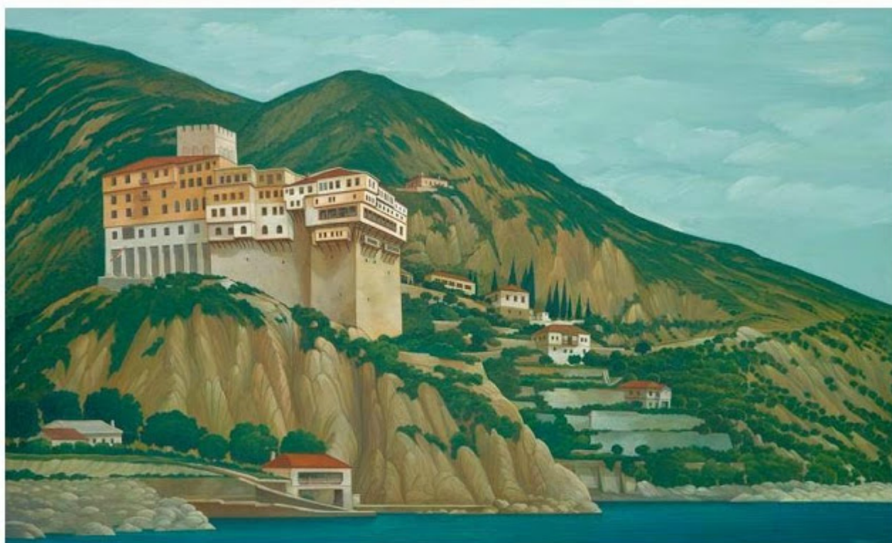
Θανάσης Μπακογιώργος - 1.Μ. Διονυσίου, ΑΓΙΟΝ ΟΡΟΣ