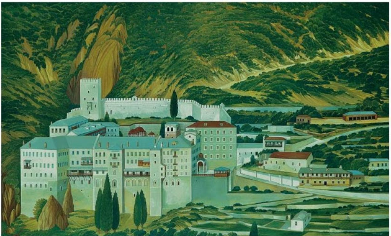
Θανάσης Μπακογιώργος - 1.Μ. Αγίου Παύλου, ΑΓΙΟΝ ΟΡΟΣ