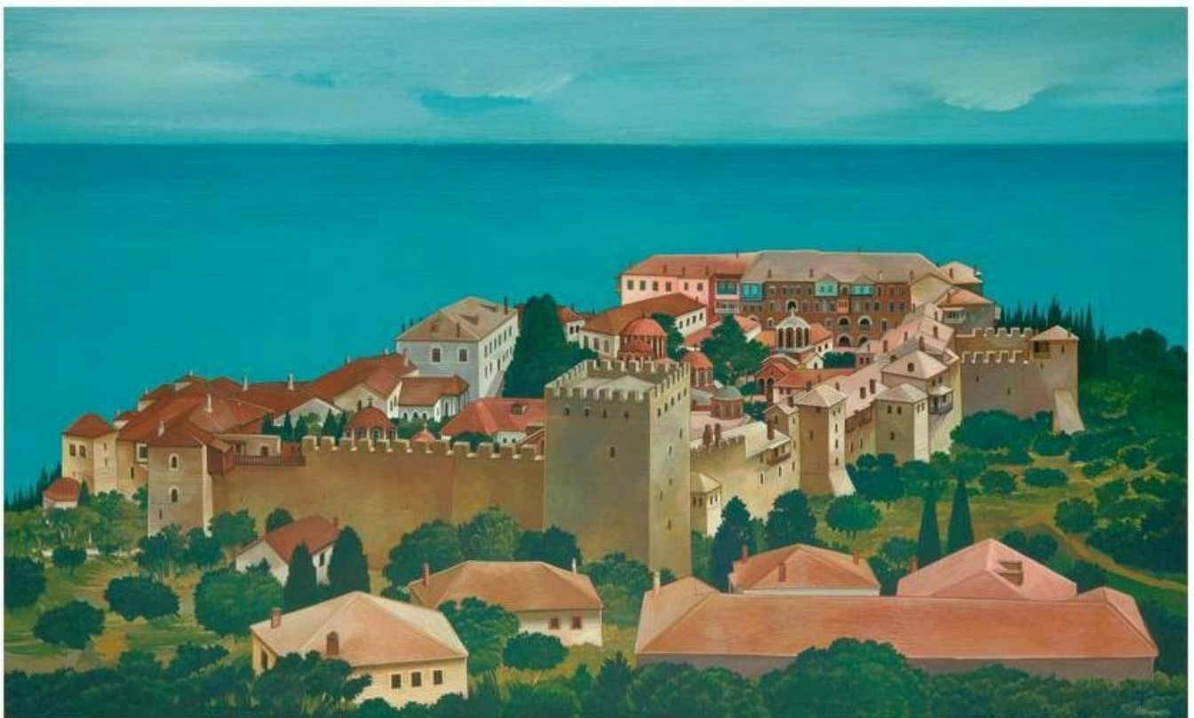
Θανάσης Μπακογιώργος - Ι.Μ. Μεγίστης Λαύρας, ΑΓΙΟΝ ΟΡΟΣ