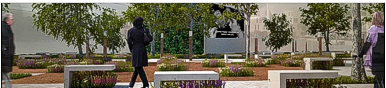
Urbanthreads | υφαίνοντας τον αστικό ιστό

Οι προτάσεις ανάπλασης υποβαθμισμένων περιοχών που πήραν βραβεία είναι οι εξής: