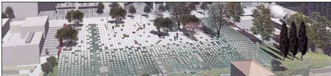
Πλατεία Αγ. Δημητρίου