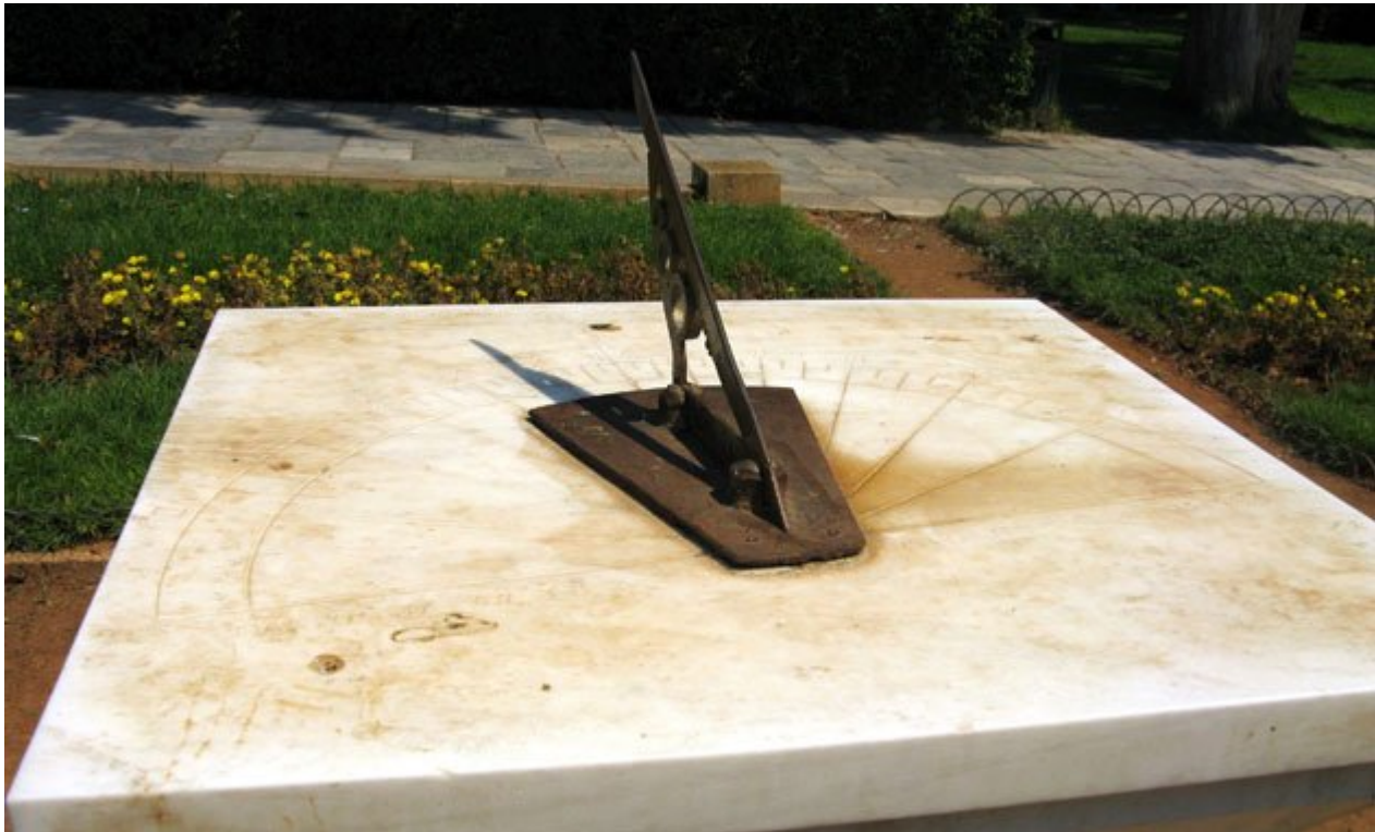
Ηλιακό ρολόι στον Εθνικό Κήπο