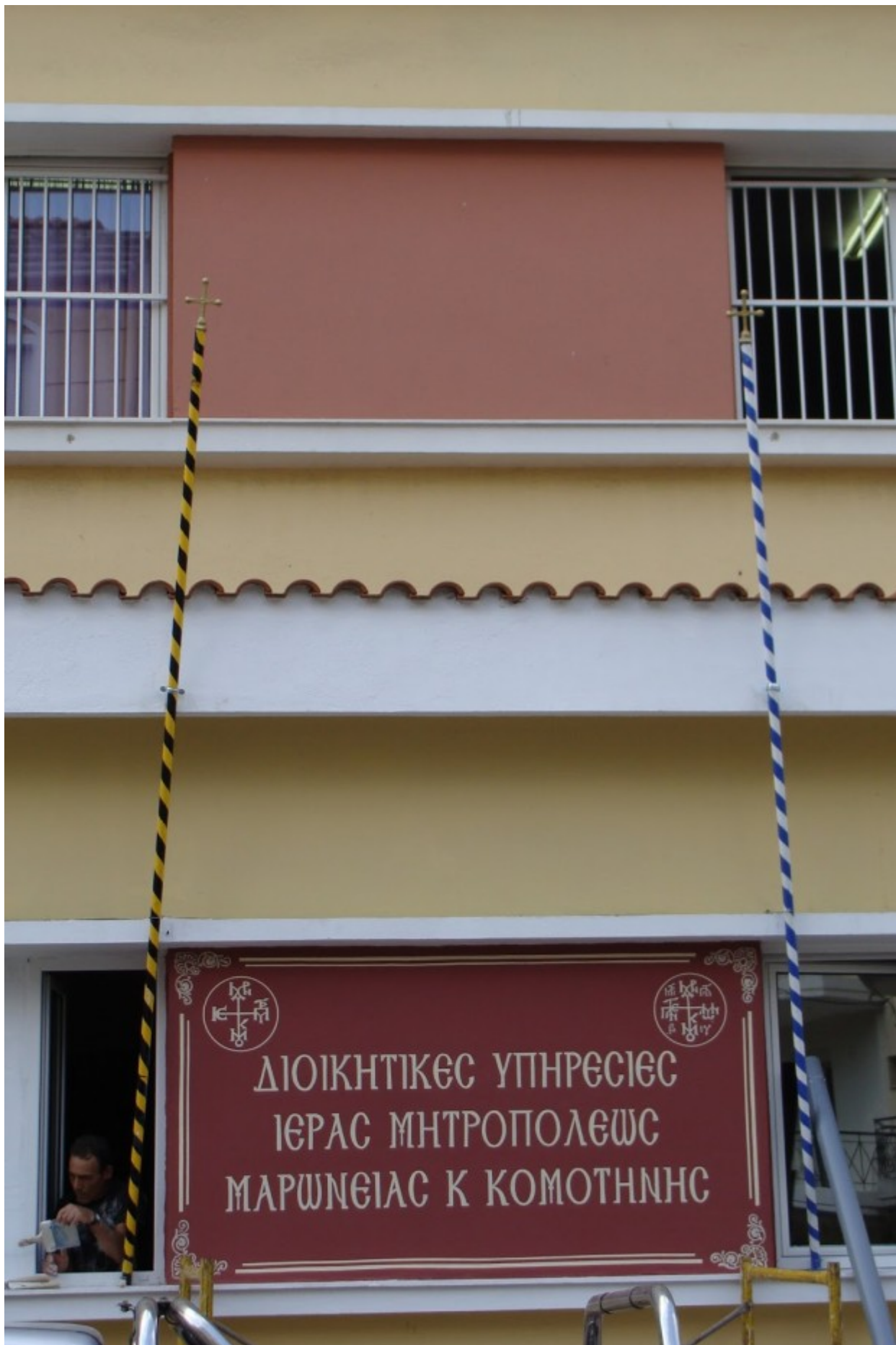
Εξωτερικές πινακίδες του κτιρίου