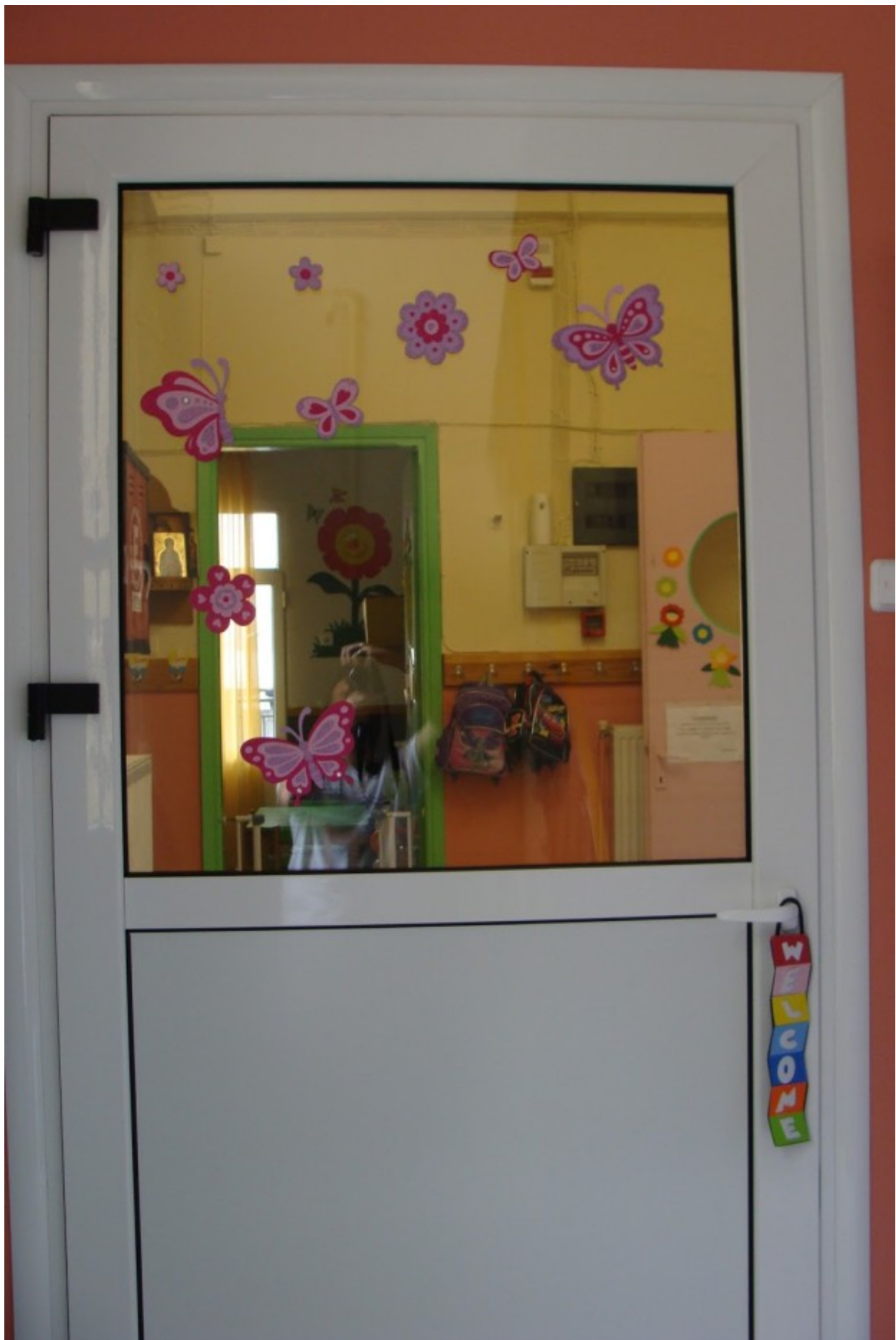
Η είσοδος του Β΄ βρεφονηπιακού σταθμού