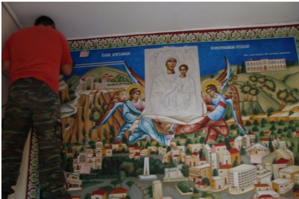
Αγιογραφία στην είσοδο του κτιρίου απεικονίζουσα την πόλη της Κομοτηνής υπό τη σκέπη της Παναγίας