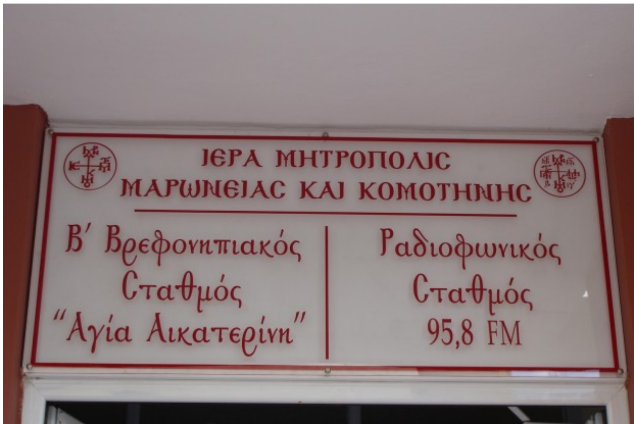
Εξωτερικές πινακίδες του κτιρίου