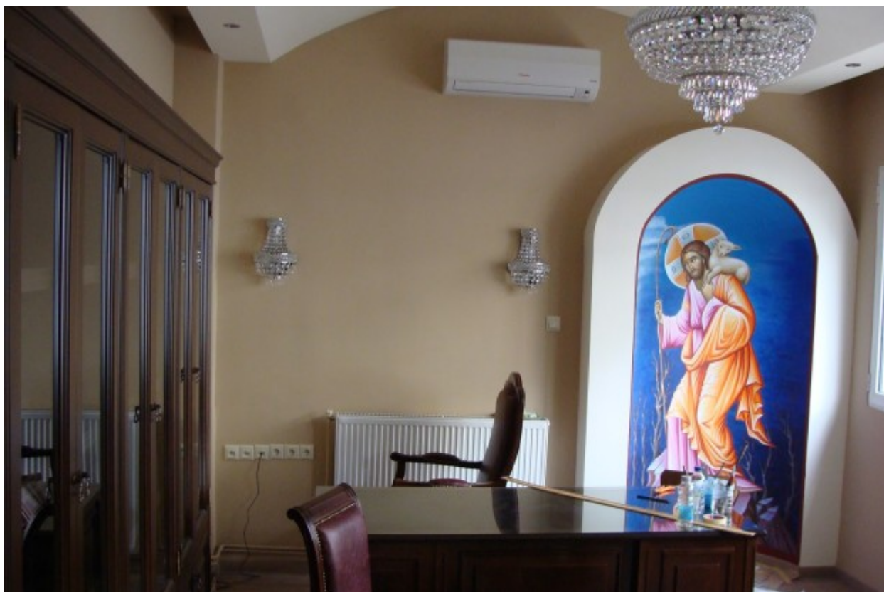
Τελευταίες εργασίες και