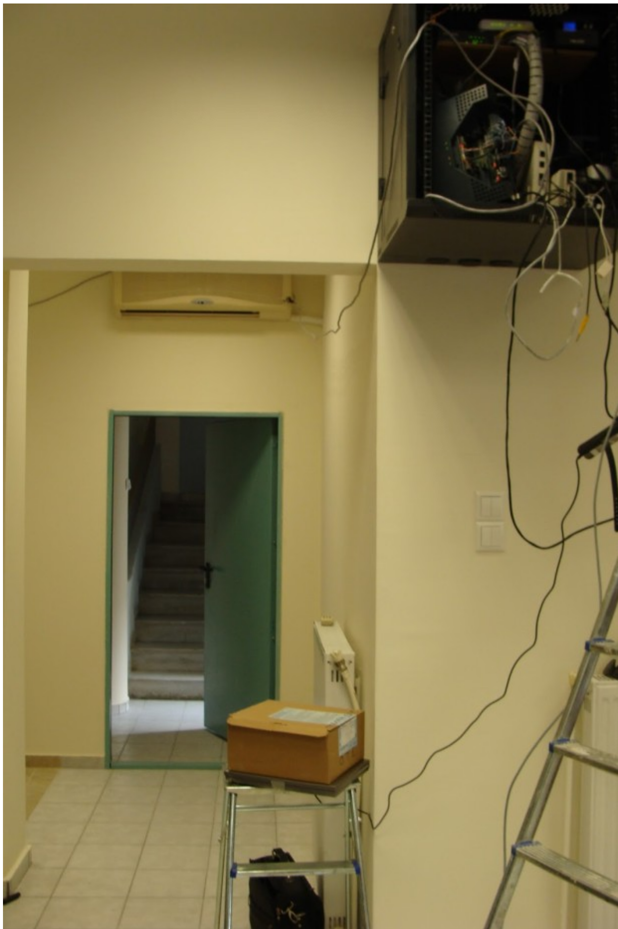
Οι εργασίες της υλικοτεχνικής υποδομής