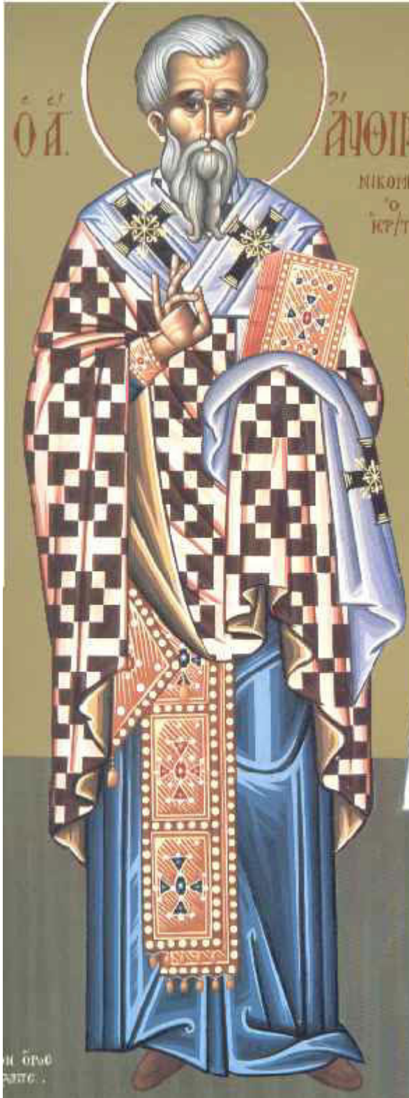
Άγιος Ανθιμος Ιερομάρτυρας επίσκοπος