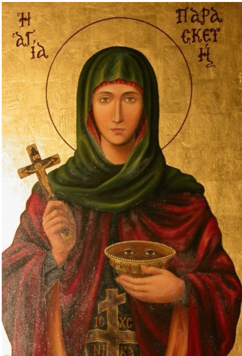
Αγία Παρασκευή η Οσιοπαρθενομάρτυς

- Οσιοπαρθενομάρτυρες. Έτσι ονομάζονται οι γυναίκες μοναχές, μάρτυρες της πίστης που θανατώθηκαν με μαρτυρικό τρόπο.