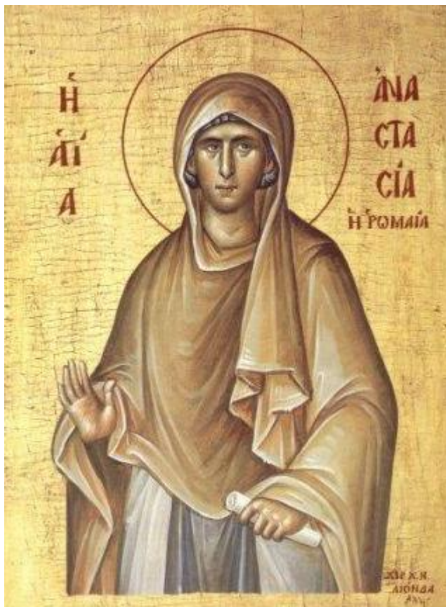
Αγία Αναστασία η Οσιομάρτυς

- Οσιομάρτυρες. Οι μοναχοί, οι ασκητές και οι ερημίτες έλαβαν αυτόν τον τίτλο.