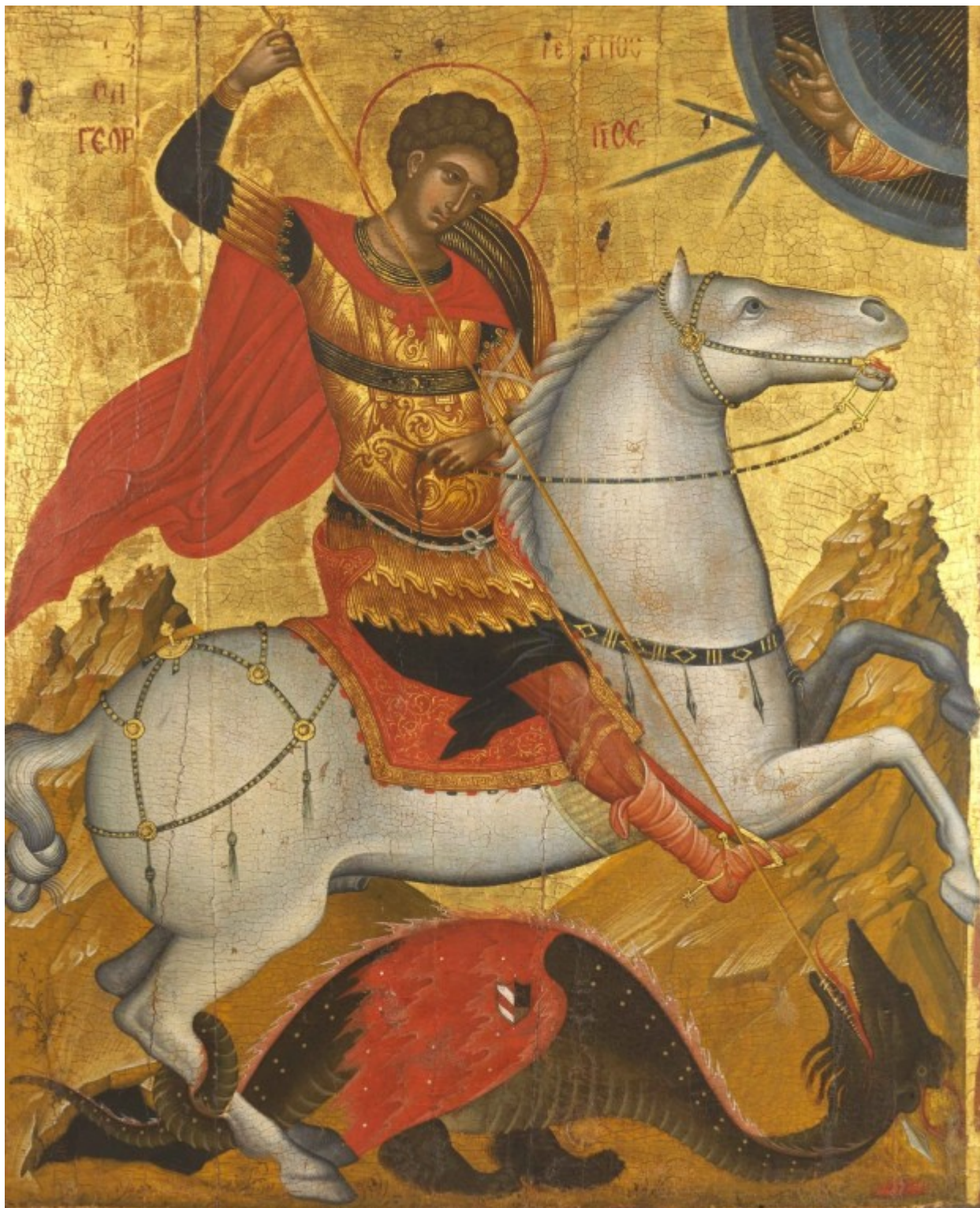
Άγιος Γεώργιος ο Μεγαλομάρτυρας ο Τροπαιοφόρος

- Μεγαλομάρτυρες. Όσοι από τους Μάρτυρες υπέστησαν μεγάλα βασανιστήρια και θανατώθηκαν με φρικτό - βάρβαρο τρόπο, έχουν πάρει από την Εκκλησία αυτόν τον τίτλο.