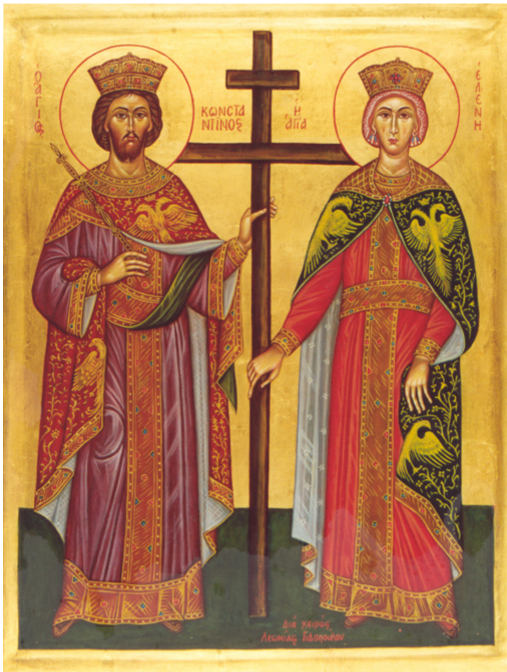
Άγιοι Κωνσταντίνος και Ελένη οι Ισαπόστολοι

- Ισαπόστολοι. Όλοι όσοι έκαναν αποστολικό έργο ισάξιο των Αποστόλων ονομάστηκαν έτσι.