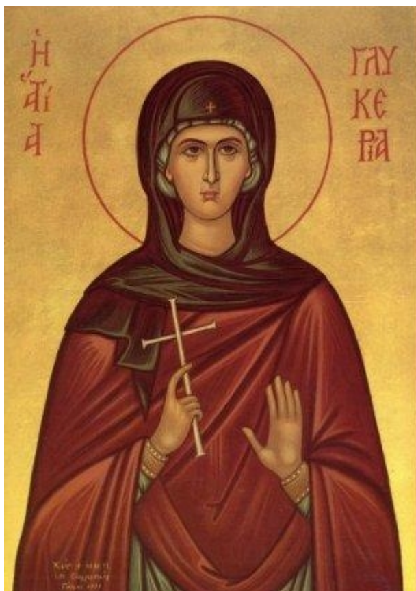
Αγία Γλυκερία η Μάρτυς

- Μάρτυρες. Ονομάζονται όλοι όσοι μαρτύρησαν για την πίστη τους, βασανίσθηκαν και θανατώθηκαν ιδιαίτερα κατά τους πρώτους μεγάλους διωγμούς.