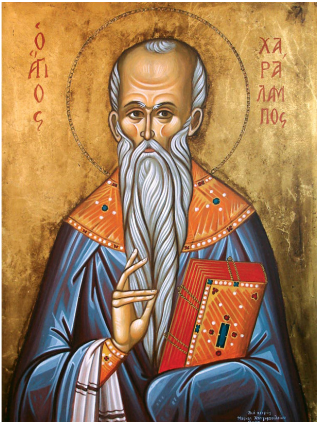
Άγιος Χαράλαμπος ο Ιερομάρτυρας

- Ιερομάρτυρες. Ονομάζονται όσοι από τους Μάρτυρες ήταν Ιερωμένοι.