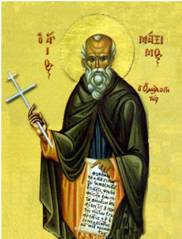
Όσιος Μάξιμος ο Ομολογητής

- Νεομάρτυρες. Έτσι ονομάζονται οι Άγιοι που μαρτύρησαν επί Τουρκοκρατίας.