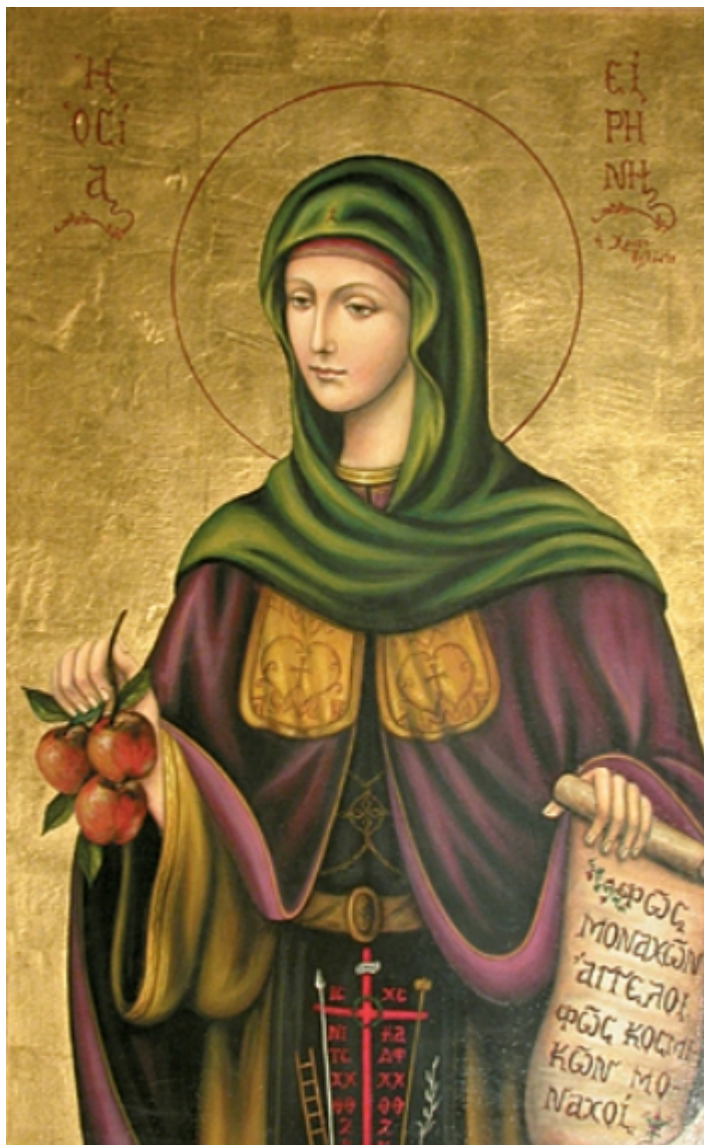
Οσία Ειρήνη η Χρυσοβαλάντου

- Ὅσιοι. Οἱ Ἄγιοι (εἰρημίτες, ἀναχωρητές, ἀσκητές...) που ἐγκατέλειψαν τὸν κόσμον καὶ ἀφιερῶθηκαν ἐξ ὀλοκλήρου στὸν Θεό.