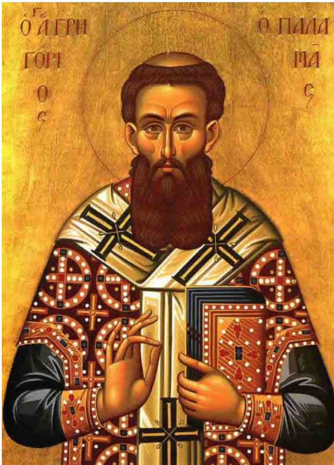
Άγιος Γρηγόριος ο Παλαμάς

- Πατέρες της Εκκλησίας. Οι μοναχοί, οι κληρικοί και ιδιαίτερα οι Επίσκοποι που διακρίθηκαν για το έργο τους δικαίως κατέχουν αυτόν τον τίτλο.