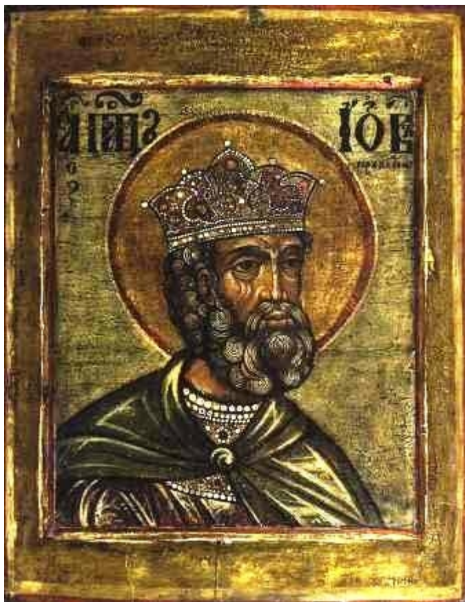
Προφήτης Ιώβ ο Δίκαιος

- Δίκαιοι. Είναι όλοι οι «Δίκαιοι» που έζησαν προ Χριστού έχοντας πίστη στον Έναν και Μοναδικό Θεό και ήλπιζαν ή προφήτευσαν τον ερχομό του Μεσσία - Χριστού.