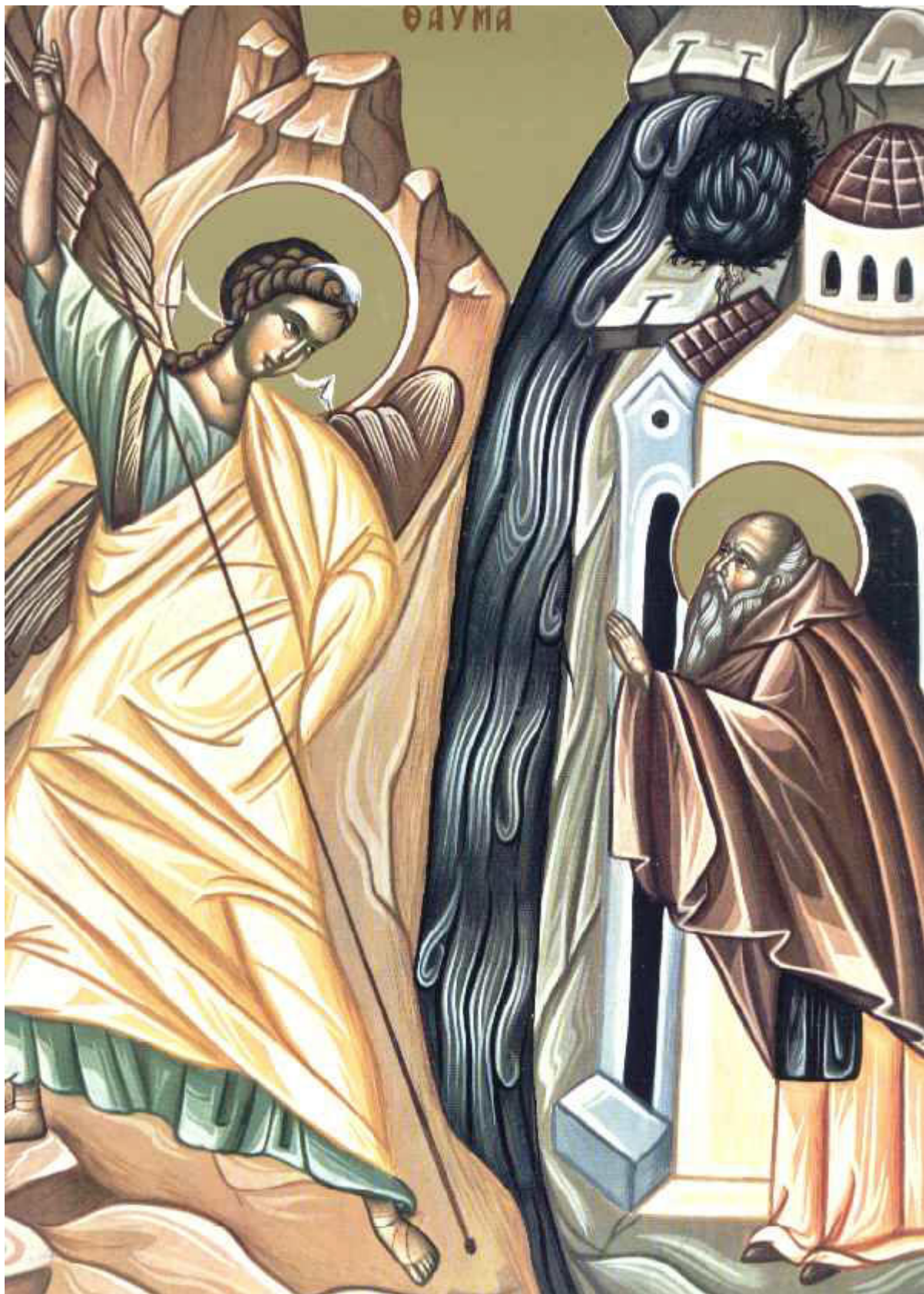
Το θαύμα του Αρχαγγέλου Μιχαήλ στις Χωναίς (ή Κολασσαίς)