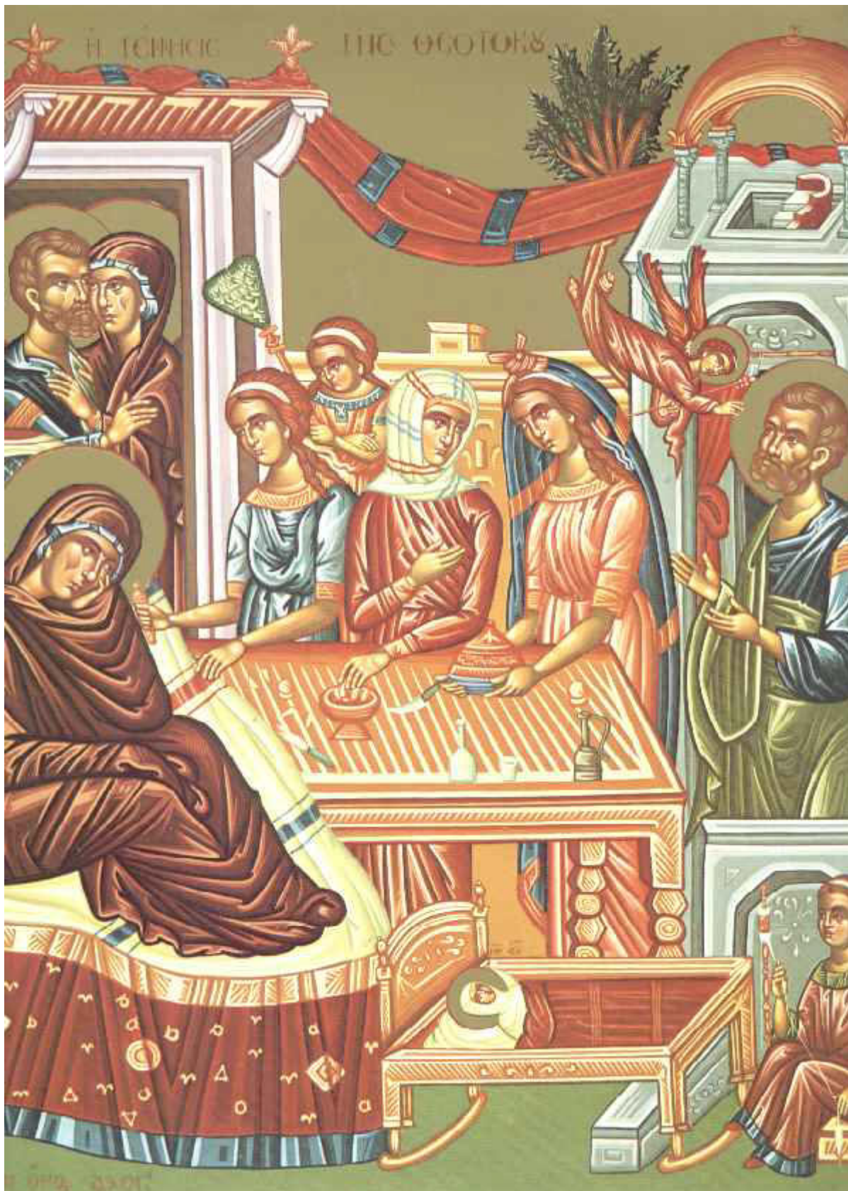
Γέννηση της Υπεραγίας Θεοτόκου

Εορτάζει στις 8 Σεπτεμβρίου εκάστου έτους.