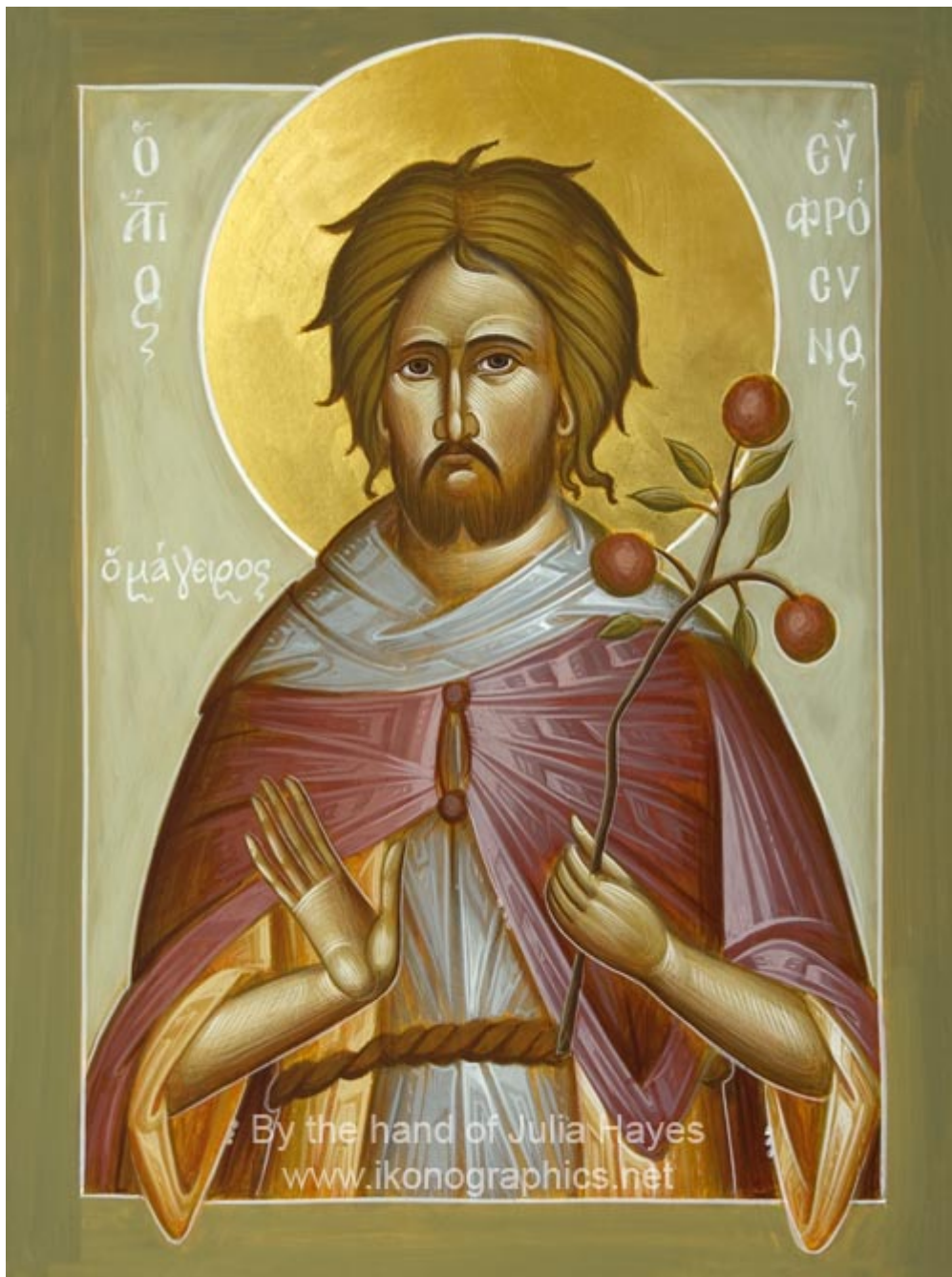
Άγιος Ευφρόσυνος ο μάγειρας - Julia Hayes© (www.ikonographics.net)