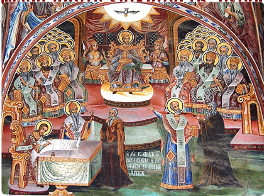
Εκθεση προσωπικής πείρας