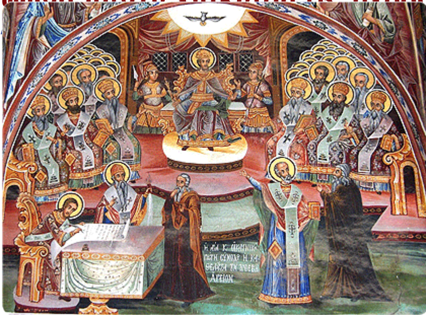
Εκθεση προσωπικής πείρας