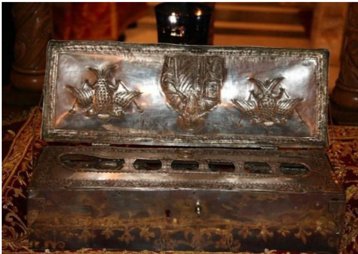
Η ασημένια λειψανοθήκη του 1849 με τους βυζαντινούς σταυρούς, όπου φυλάσσεται η δεξιά χείρα του Μεγάλου Βασιλείου. Αποθησαυρίζεται στην Ιερά Σύνοδο της Εκκλησίας της Ελλάδος.