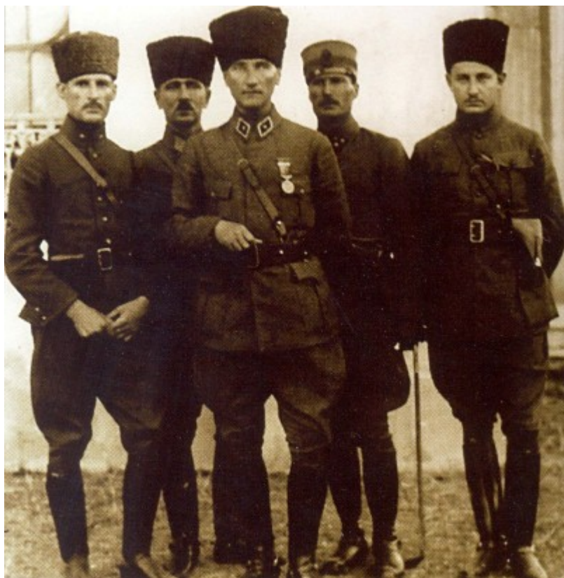
Ο Μουσταφά Κεμάλ Ατατούρκ στην Νικομήδεια τον Ιούνιο του 1922.

Τα περισωθέντα ιερά κειμήλια της Μητροπόλεως Νικομηδείας και της παρακειμένης Ιεράς Μονής του Αγίου Παντελεήμονος παρεδόθησαν, εντός κιβωτίων, στις 26 Ιουνίου 1921, στο πολεμικό πλοίο «Κιλκίς», το οποίο ναυλοχούσε στην Πρίγκηπο (σημ. 4).