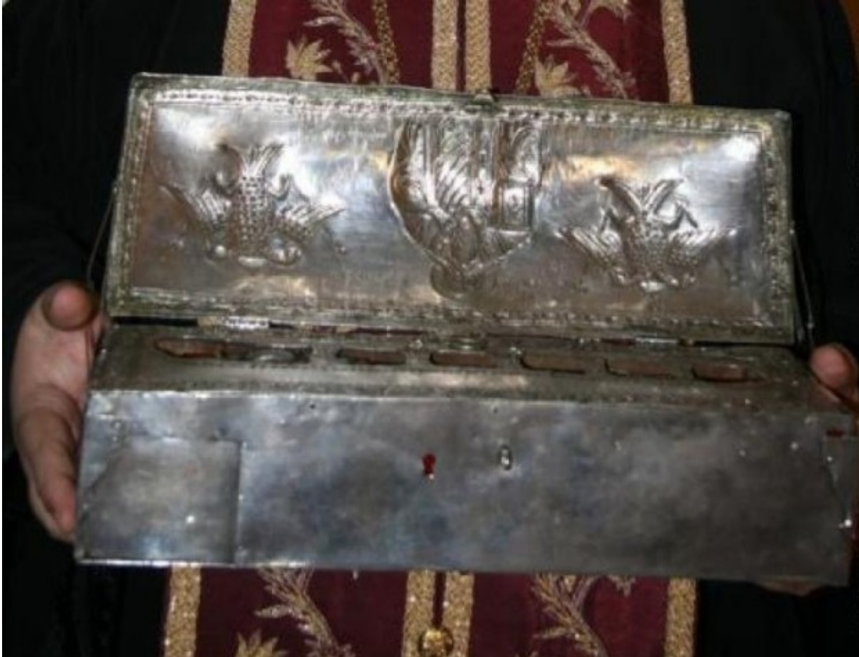
Η ασημένια λειψανοθήκη του 1849 με τους βυζαντινούς σταυρούς, όπου φυλάσσεται η δεξιά χείρα του Μεγάλου Βασιλείου. Αποθησαυρίζεται στην Ιερά Σύνοδο της Εκκλησίας της Ελλάδος.

/ Επιστήμες, Τέχνες & Πολιτισμός / Ορθόδοξη πίστη