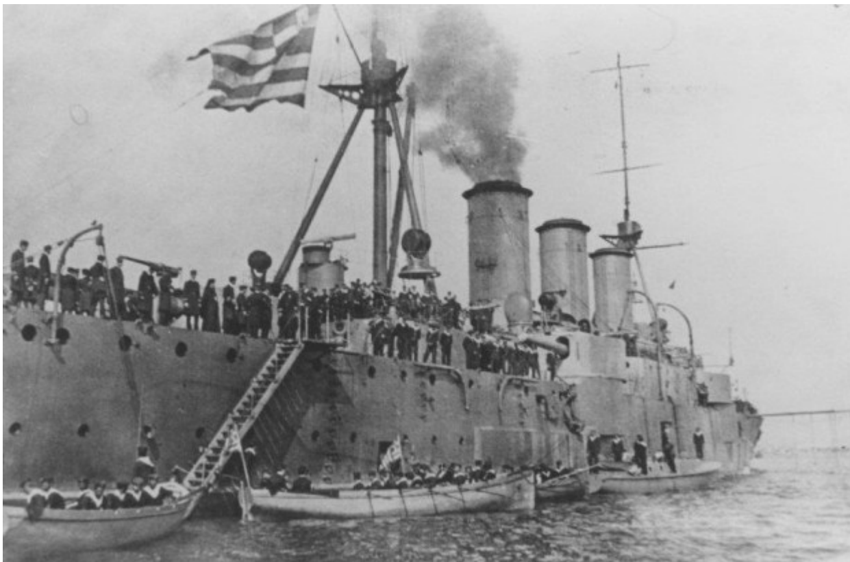
Το θωρηκτό Ἀβέρωφ.