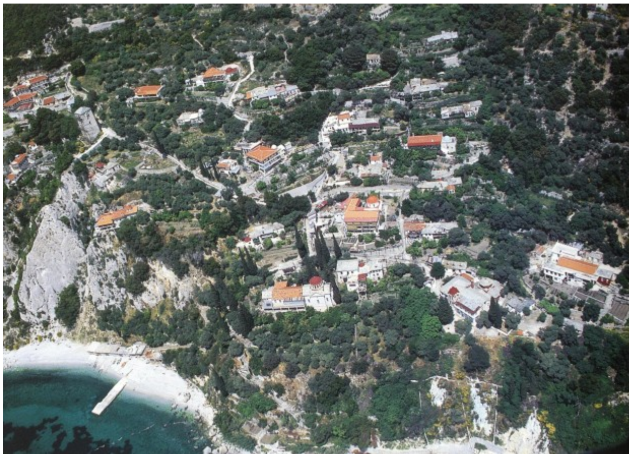
Πανοραμική άποψη της Νέας Σκήτης, η οποία διοικητικά υπάγεται στην Ιερά Μονή Αγίου Παύλου.

χάριτι με σαγήνεψαν ώστε έκτοτε να παραμείνω μαζί τους μέχρι της οσίας τελευτής τους.