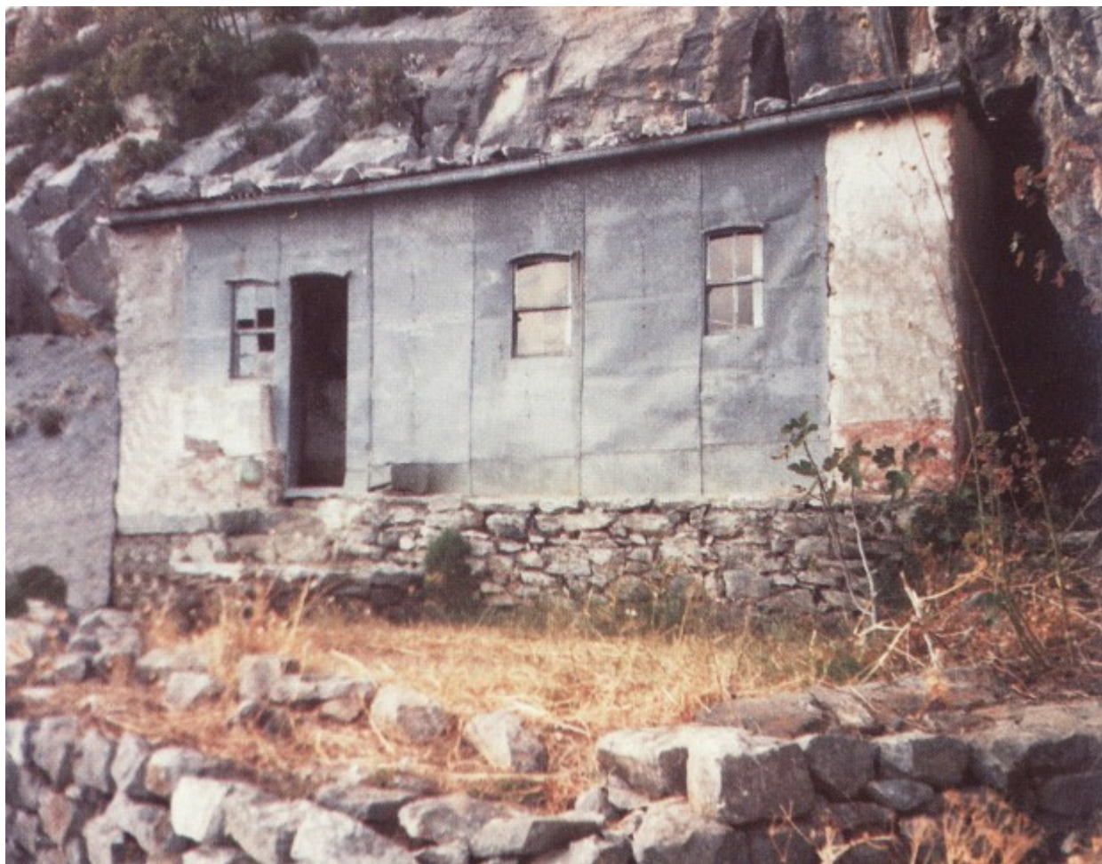
Ο Ιερός Ναός του Τιμίου Προδρόμου στην Σκήτη του Αγίου Βασιλείου.

Πέραν αυτών ο Γερο-Αρσένιος επεμελείτο και τις χειρονακτικές εργασίες. Ζώντας τα πρώτα χρόνια εκεί ψηλά στα βράχια του Αγίου Βασιλείου, ανεβοκατέβαινε 1-2 ώρες απότομο ανήφορο ανεβάζοντας προμήθειες όχι μόνο για τους εαυτούς τους αλλά και για όλους τους ασκητές. Κουβαλούσε στους ώμους πέτρες και διάφορα υλικά για την συντήρηση και επισκευή των λιθόκτιστων καλύβων και πεζουλιών.