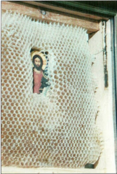
Οι μέλισσες σέβονται τὰ Ἅγια Πρόσωπα. Ἡ εἰκόνα τοῦ Κυρίου παραμένει ἀκάλυπτη.

Από τον Μοναχό Συμεών - Στην περιοχή του