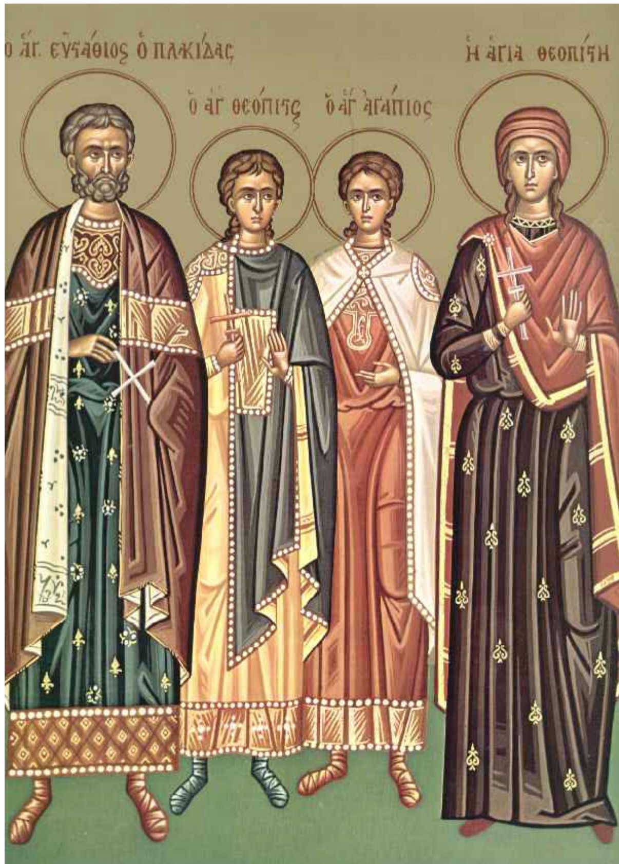
Ἅγιος Εὐστάθιος και η συνοδεία του, Θεοπίστη η σύζυγος του, Ἀγάπιος και Θεόπιστος τα παιδιά του