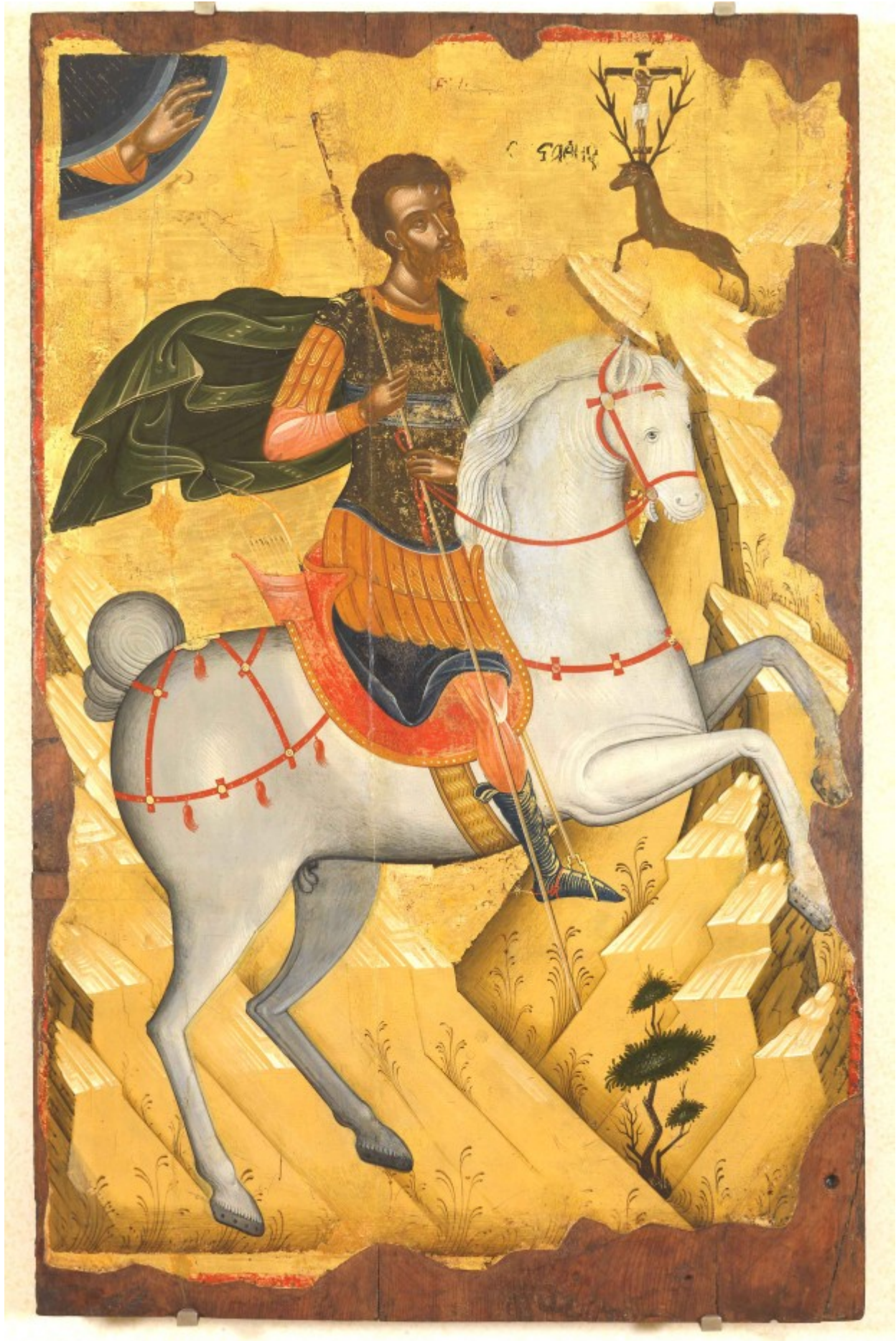
Άγιος Ευστάθιος - άγνωστος Κρητικός ζωγράφος, αρχές 16ου αιώνα μ.Χ.