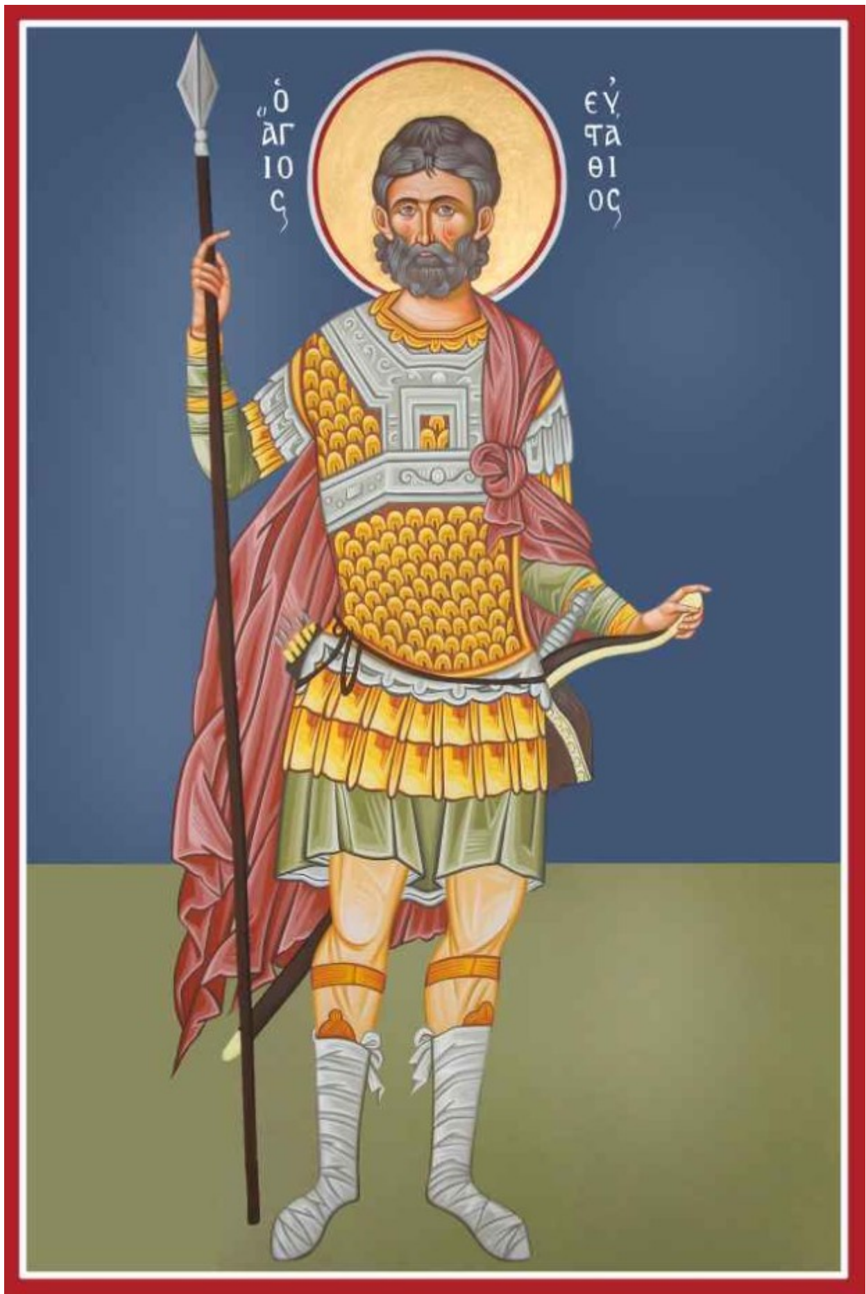
Άγιος Ευστάθιος - Καζακίδου Μαρία© ( byzantineartkazakidou.blogspot.com )