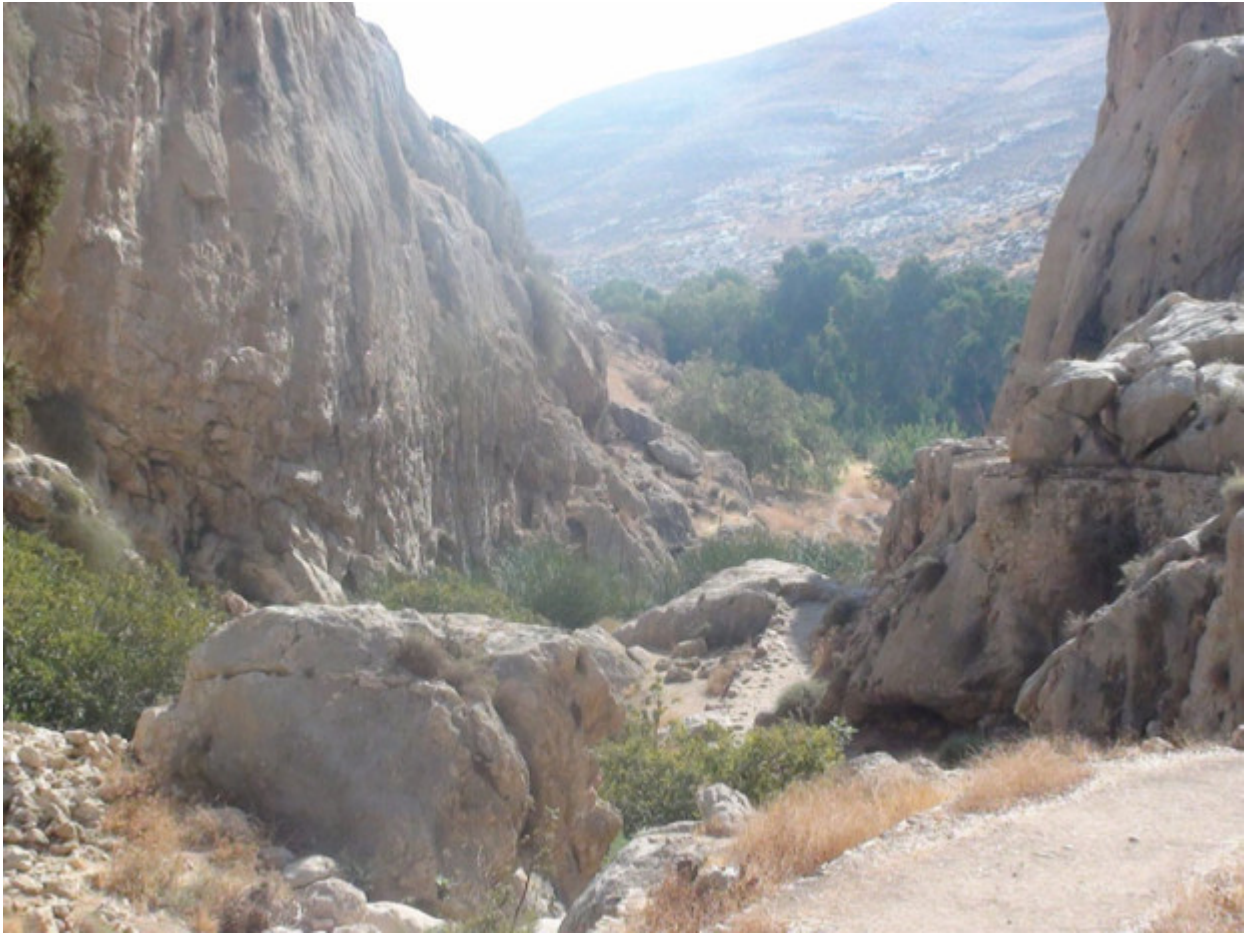
Ο τόπος ασκήσεως του Οσίου Χαρίτωνος