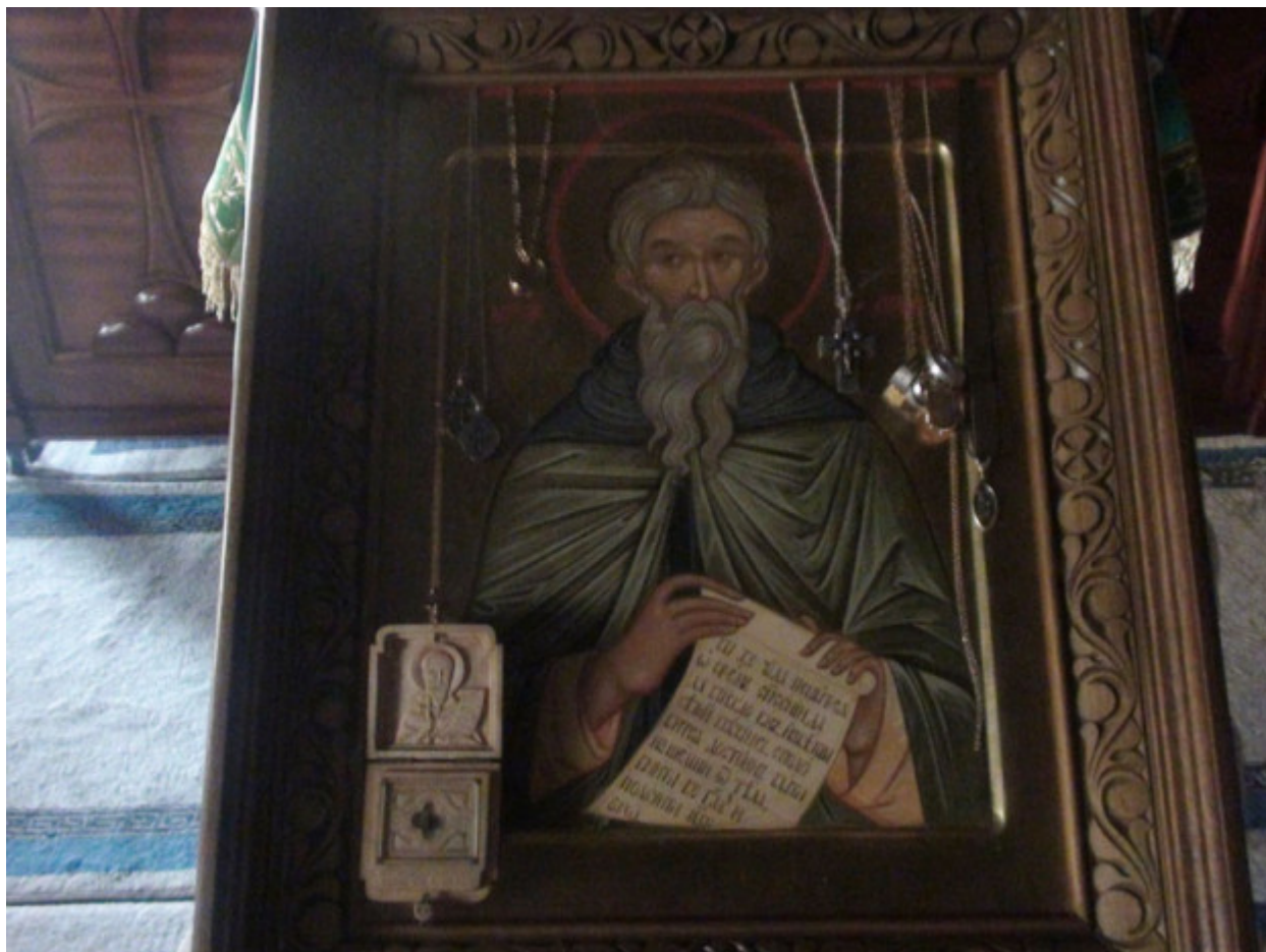
Όσιος Χαρίτων ο Ομολογητής