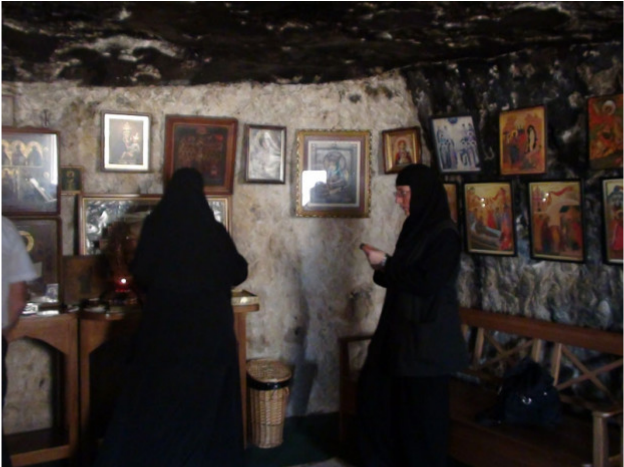
Στο σπήλαιο του Οσίου Χαρίτωνος