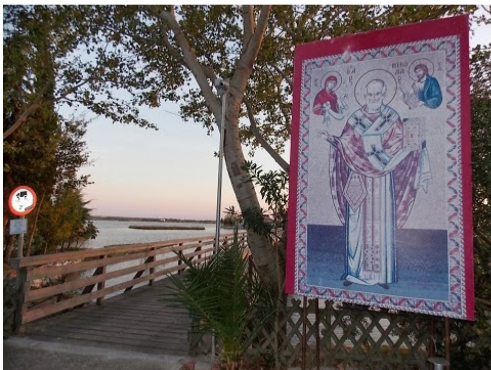
Προς τον Ιερό Ναό Παναγίας Παντάνασσας