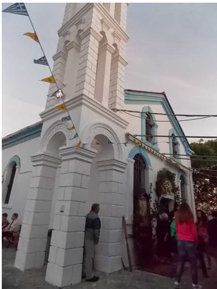
Ρώσοι προσκυνητές επισκέπτονται το Μετόχι της Μονής Βατοπαιδίου.