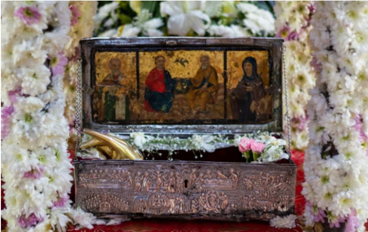
Η λειψανοθήκη με τη δεξιά χείρα του Αγίου Πολυκάρπου, του Ιερομάρτυρος Επισκόπου Σμύρνης.

Την 13η Μαρτίου του 2013 το βράδυ, άγνωστοι προς το παρόν ιερόσυλοι εισήλθαν στην Ιερά Μονή της Παναγίας της Αμπελακιώτισσας και έκλεψαν το ιερό λείψανο (δεξιά χείρα) του Αγίου Πολυκάρπου, του Ιερομάρτυρος Επισκόπου Σμύρνης, που φυλασσόταν στην Ιερά Μονή από το έτος 1474. Το άγιο λείψανο δεν έχει ακόμα βρεθεί. Οι ιερόσυλοι κλέφτες δεν έχουν ακόμα συλληφθεί.