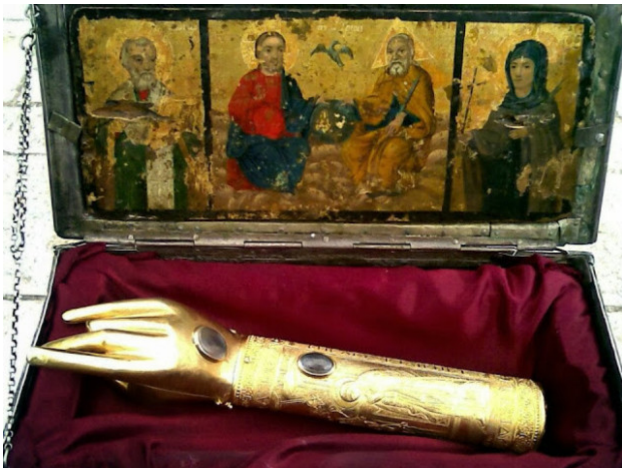
Η λειψανοθήκη με τη δεξιά χείρα του Αγίου Πολυκάρπου, του Ιερομάρτυρος Επισκόπου Σμύρνης. Η λειψανοθήκη είναι η νέα (σύγχρονη).

Δεόμεθά Σου, Κύριε ο Θεός ημών διάνοιξον τας πεπωρωμένας αυτών καρδίας και φώτισον τον σκοτεινόν και εωσφορικόν νουν των επιτελεσάντων την μιανάν και βδελυράν ταύτην πράξιν, ίνα ανανήψαντες εκ ζόφου κακίας επανάγωσι το άγιον και ιερόν Λείψανον εις τον οίκον αυτού, την Ιεράν ταύτην Μονήν. Δός αυτοίς εννοήσαι, ότι η ενέργεια αύτη φέρει αυτούς αφεύκτως εις βάραθρον κακίας, εις ασθένειαν ψυχής και σώματος, εις τα τάρταρα του Άδου, εις τόπον απωλείας και βασάνου. Έπρεπεν όντως αυτοίς, τοίς φυσικοίς και ηθικοίς αυτουργοίς, δοθήναι αφορισμός και αναθεματισμός, αλλ' αυτή αύτη η βέβηλος πράξις αυτοκατάκριτος εστι, εάν μη μετανοήσωσιν πικρώς, ως ο Πέτρος, ο Απόστολόσ Σου, επί τη αρνήσει αυτού.