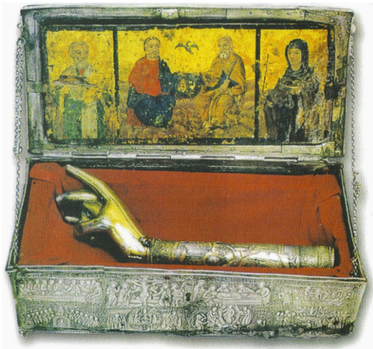
Η λειψανοθήκη με τη δεξιά χείρα του Αγίου Πολυκάρπου, του Ιερομάρτυρος Επισκόπου Σμύρνης. Η λειψανοθήκη είναι η παλαιά (μεταβυζαντινή).

Αρχιερατική Δέησης προς τον Θεόν δια την ανεύρεσιν του συληθέντος τιμίου Λειψάνου του εν αγίοις Ιερομάρτυρος Πολυκάρπου Επισκόπου Σμύρνης Προστάτου της Επαρχίας Ναυπακτίας