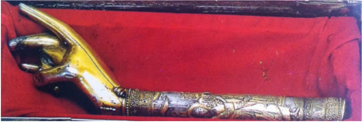
Η λειψανοθήκη με τη δεξιά χείρα του Αγίου Πολυκάρπου, του Ιερομάρτυρος Επισκόπου Σμύρνης. Το Άγιο Χέρι βρίσκεται σε στάση ευλογίας.

Συ ει ο δοτήρ των αγαθών και της ζωής χορηγός. Συ ει ο γινώσκων το βάθος των καρδιών ημών. Συ ει ο πλουτίζων ημάς εν πάση σοφία πνευματική. Συ ει ο ευλογήσας ημάς δια των ικεσιών του αγίου Σου και καταστήσας την Μονήν ταύτην θησαυρόν ακένωτον και ημάς κληρονόμους των του Αποστολικού Πατρός αγίων Λειψάνων. Διο Σε υμνούμεν, Σε ευλογούμεν, Σε δοξάζομεν, τον όντως όντα Θεόν ημών, τον ποιούντα μεγάλα και θαυμάσια, ένδοξά τε και εξαίσια.