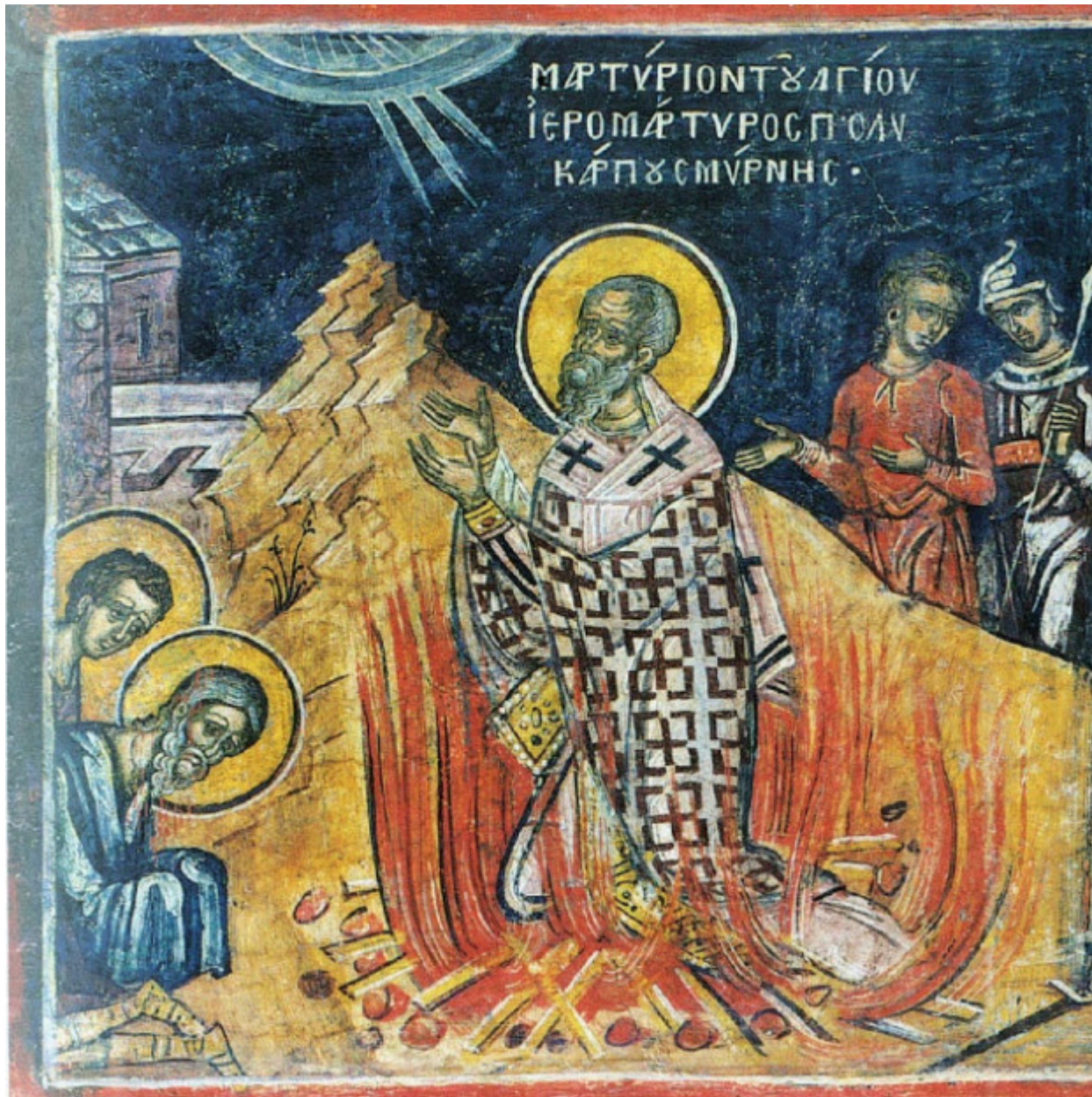
Το Μαρτύριον του Αγίου Ιερομάρτυρος Πολυκάρπου Σμύρνης (τοιχογραφία).

Η λειψανοθήκη ενώνει τη μικρή φωνή της μαζί με όλους αυτούς που προσεύχονται για την ανεύρεση της δεξιάς χείρας του Αγίου Πολυκάρπου και εύχεται για την επιτυχή και ευτυχή κατάληξη αυτής της περιπέτειας του αγίου λειψάνου, αλλά και του λαού της επαρχίας Ναυπακτίας από τον οποίον το ιερό λείψανο αφαιρέθηκε. Τα άγια λείψανα δεν είναι μόνο πνευματικοί και εκκλησιαστικοί θησαυροί, αλλά και εθνικοί. Και έτσι πρέπει να αντιμετωπίζονται.