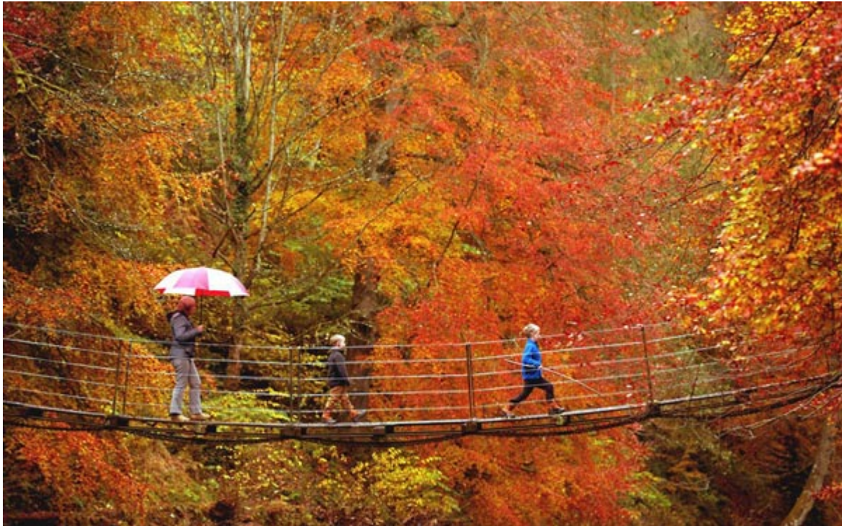
Πορτοκαλί της Βρετανίας

Θέλεις έναν μπλε προορισμό, μια χώρα ή μια πόλη βουτηγμένη στο πορτοκαλί, στο κόκκινο ή μήπως στο λευκό. Χώρες στον κόσμο, αγαπημένοι ταξιδιωτικού προορισμοί συνδυάζονται επιτυχημένα με ένα από τα βασικά χρώματα του ουράνιου τόξου, καθώς δεν είναι λίγες οι φορές που ο ταξιδιώτης ταυτίζει στο μυαλό του μια απόχρωση με έναν τόπο.