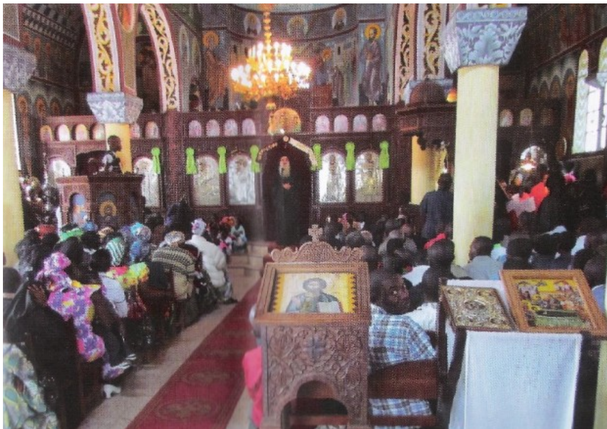
Εκκλησία στο Κονγκό

Υπάρχουν όμως κάποιοι Ορθόδοξοι, μάλιστα διανοούμενοι και ενίοτε μερικοί διδάσκαλοι της Θεολογίας, οι οποίοι αμφισβητούν τη μοναδικότητα αυτή της Ορθόδοξης μας. Πιστεύουν ότι, επειδή το Άγιο Πνεύμα είναι Θεός και πανταχού παρών, μπορεί να επισκέπτεται και να χορηγεί τη Θεία Χάρη του και σε ανθρώπους εκτός της Ορθόδοξου Εκκλησίας. Όμως, ούτε και εμείς αμφισβητούμε αυτή την ελευθερία και δράση του Αγίου Πνεύματος και σε μη Ορθοδόξους και αλλοθρήσκους ανθρώπους. Άλλωστε ποιός άνθρωπος μπορεί να ελέγξει ή να κηδεμονεύσει το Άγιο Πνεύμα το οποίο είναι Θεός; Δύναται λοιπόν να πνεύσει, σύμφωνα με την Αγία Γραφή (Ιωαν. 3, 8), όπου και όπως θέλει, στο νού και στην καρδιά ενός ανθρώπου, δια να τον χειραγωγήσει εως ότου έλθει στην Ορθοδοξία και τελικά να τον σώσει.