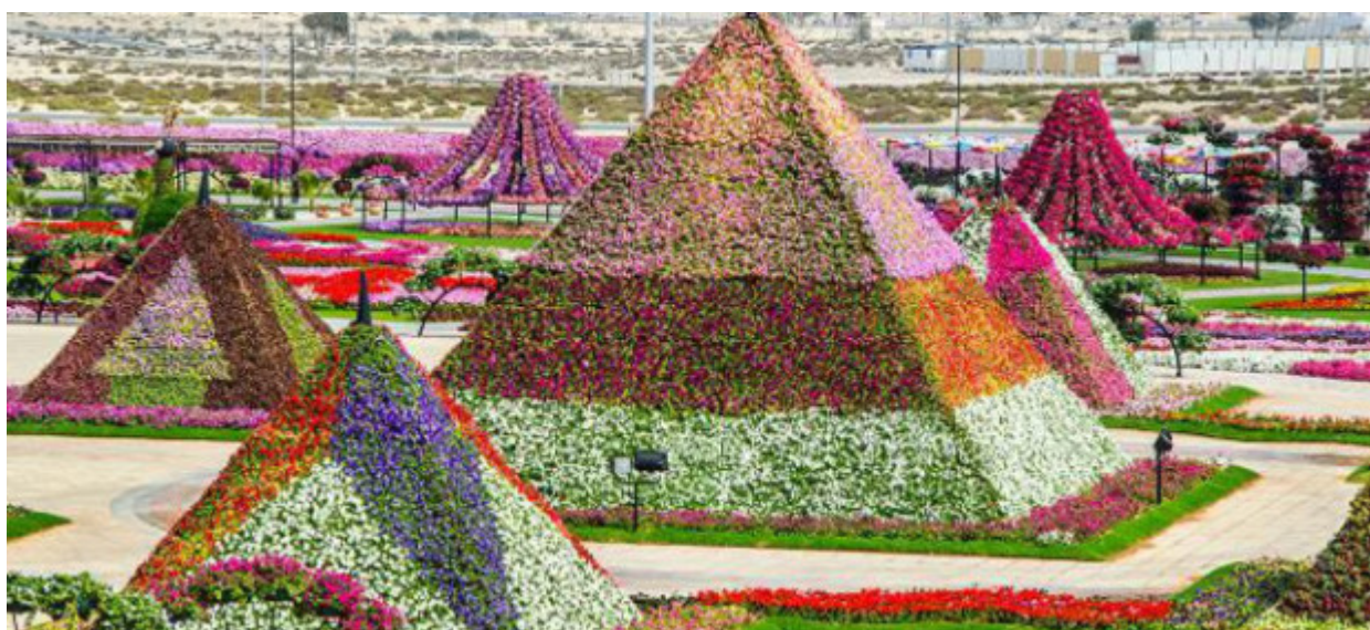
45 εκατομμύρια λουλούδια

Σε καμία περίπτωση δεν θεωρείται άθλημα της ερήμου. Παρόλα αυτά, άτομα εξοπλισμένα με τα μαστούνια τους απολαμβάνουν εκεί το χόμπι τους. Το εμιράτο διαθέτει περισσότερα από 20 γήπεδα αυτού του είδους με το πιο πράσινο γρασίδι που έχει δει κανείς. Το μυστικό σε αυτό το τελευταίο στοιχείο δεν είναι ιδιαίτερα ευχάριστο, αφού το γκαζόν διατηρείται χάρη στη χρήση επεξεργασμένων λυμάτων.