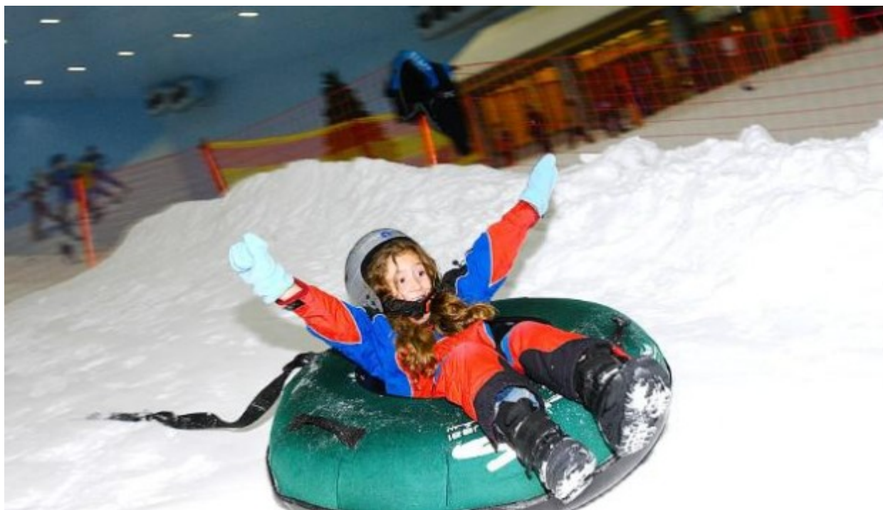
Πιγκουίνοι και χιόνι

Ακούγεται τουλάχιστον σουρεαλιστικό, αλλά μία μικρή αποικία 20 πιγκουίνων δημιουργήθηκε πρόσφατα στην έρημο. Εκεί όπου μπορεί κανείς να τους δει να κάνουν βόλτες σε χιονισμένες πλαγιές! Οι πιγκουίνοι είναι το λιγότερο. Το Mall of Emirates είναι ένα μοναδικό κλειστό χιονοδρομικό κέντρο, το οποίο λειτουργεί από το 2006, με πέντε διαδρομές που έχουν ακόμη και λιφτ. Αυτό το τεράστιο «ψυγείο» έχει -1 βαθμούς την ημέρα και -6 τη νύχτα, την ώρα που έξω... ψήνεται ο τόπος.