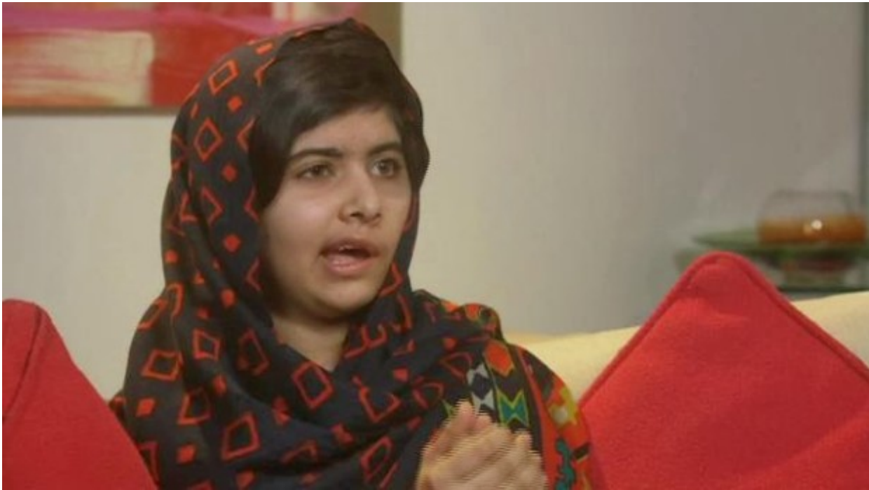
Με νωπά τα σημάδια της επίθεσης