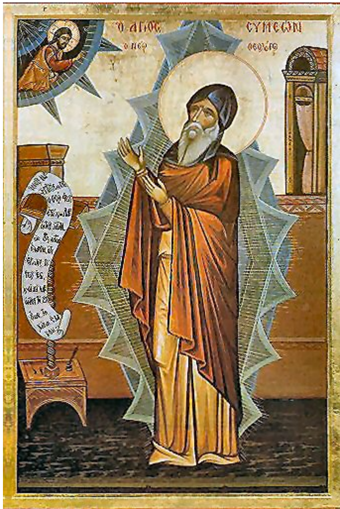
Όσιος Συμεών ο Νέος Θεολόγος

Εορτάζει στις 12 Οκτωβρίου εκάστου έτους.