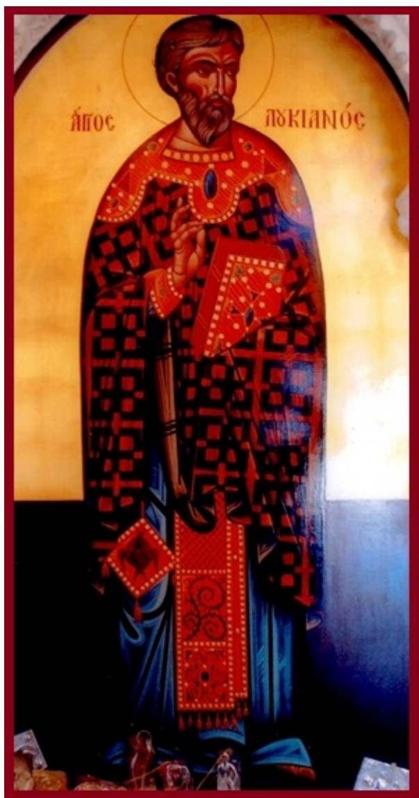
Άγιος Λουκιανός ο ιερομάρτυρας Πρεσβύτερος της Εκκλησίας της