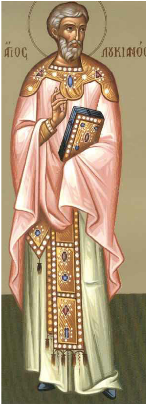
Άγιος Λουκιανός ο ιερομάρτυρας Πρεσβύτερος της Εκκλησίας της