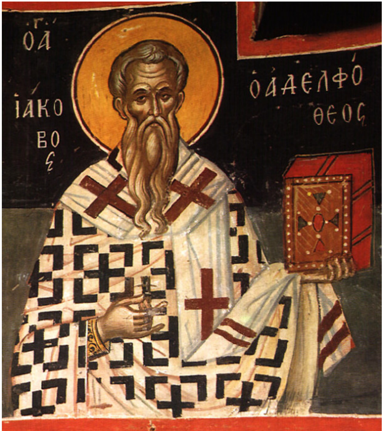
Άγιος Ιάκωβος ο Απόστολος και Αδελφός