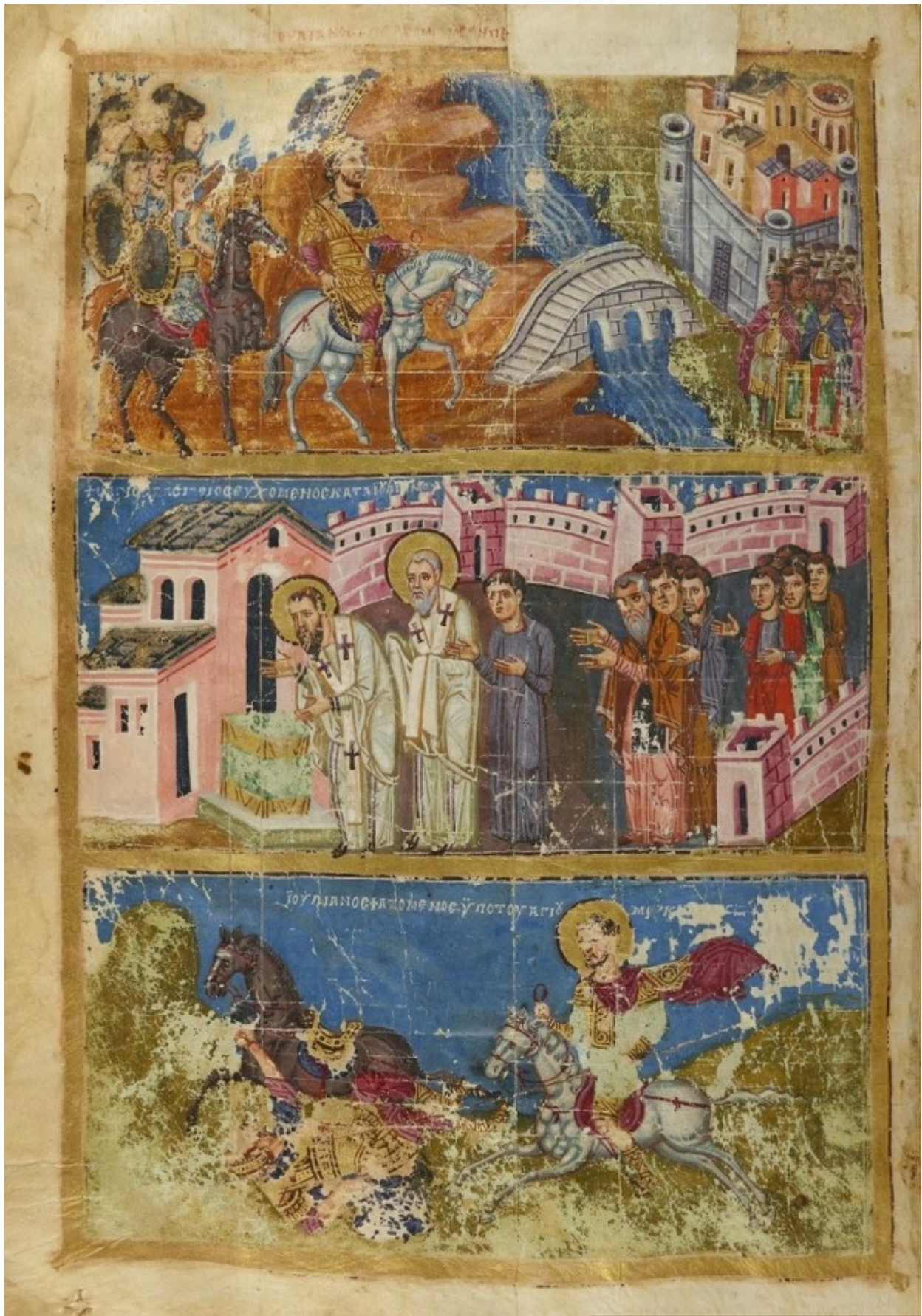
Μικρογραφίες. Διακρίνονται οι επιγραφές: Ο Άγιος Βασίλειος ευχόμενος κατά Ιουλιανού (μέση). Ιουλιανός σφαζόμενος υπό του Αγίου Μερκουρίου (κάτω).