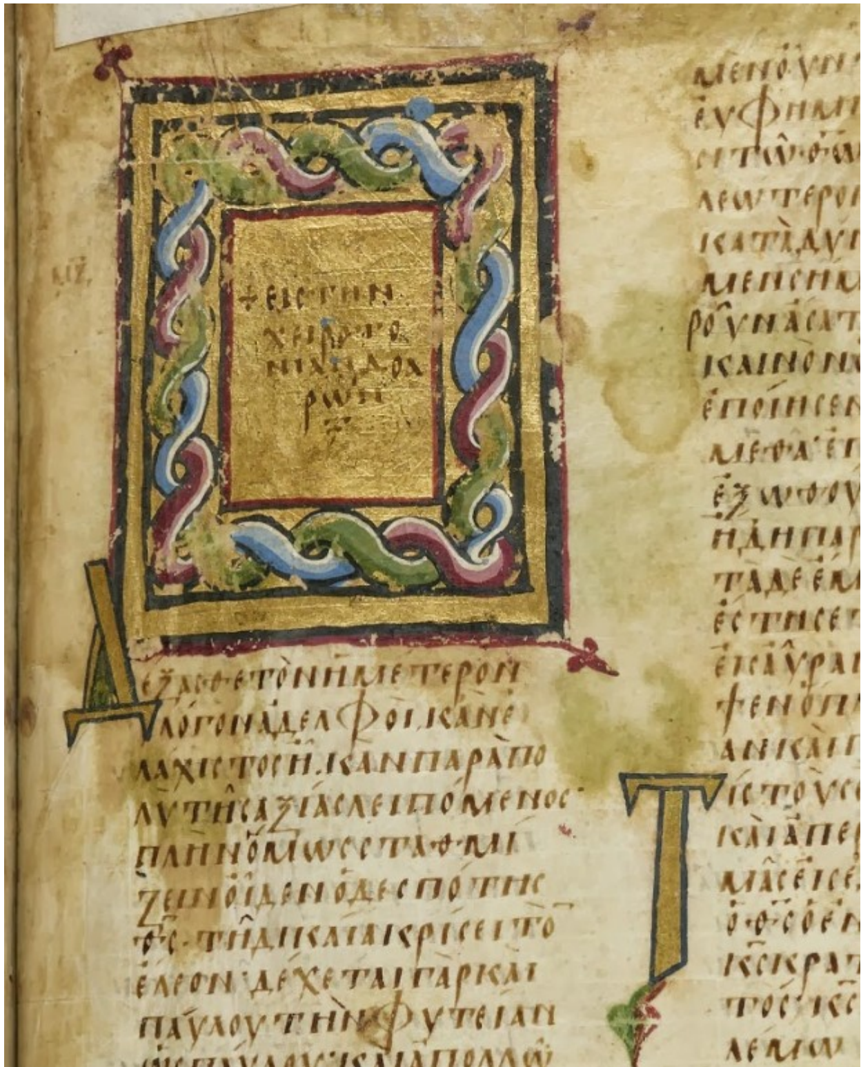
Επίχρσο τετράγωνο διακοσμητικό κόσμημα κατά το πλάτος μιας στήλης που φέρει στο κέντρο του τον τίτλο της ομιλίας: + Εις την χειροτονίαν Δοαρών. Διακοσμητικά αρχικά γράμματα (Δ και Τ).