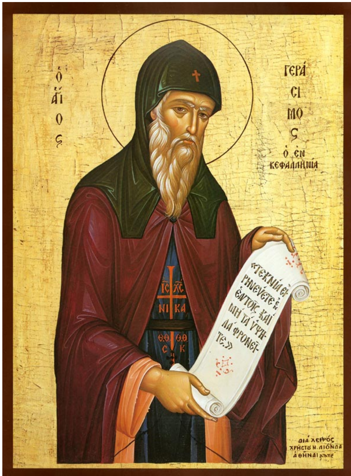
Όσιος Γεράσιμος ο νέος ασκητής

Εορτάζει στις 20 Οκτωβρίου εκάστου έτους.