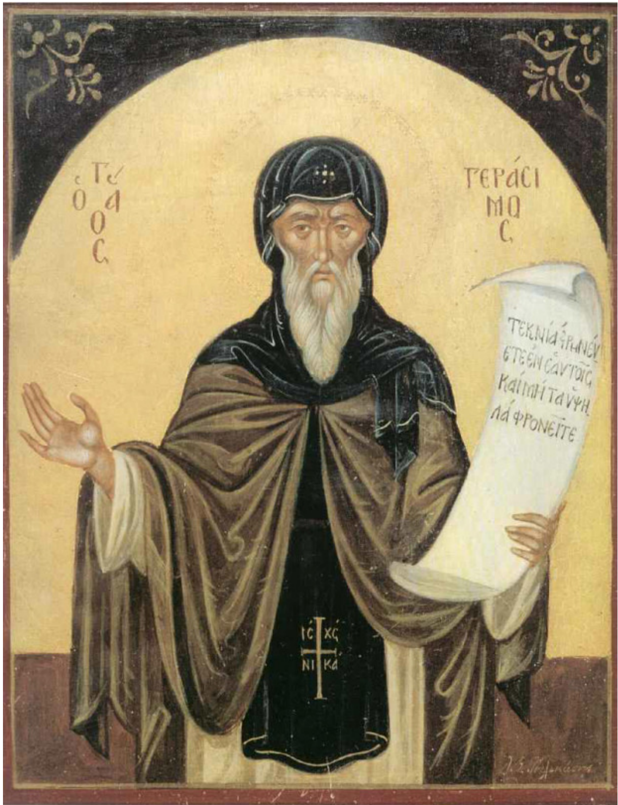
Όσιος Γεράσιμος ο νέος ασκητής