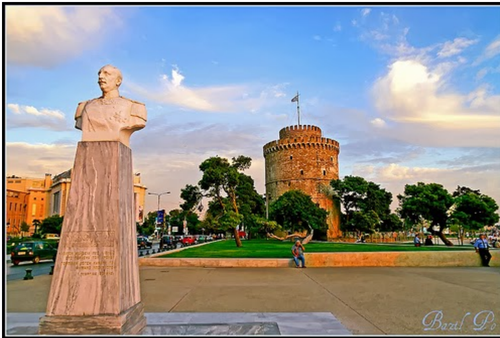
Το άγαλμα του Ν. Βότση μπροστά στον Λευκό Πύργο

Να πώς περιγράφει το γεγονός ο ίδιος ο υποπλοίαρχος Βότσης σε αναφορά του προς το τότε υπουργείο Ναυτικών την καταδρομική επιχείρηση του τορπιλοβόλου 11 και την βύθιση του τούρκικου θωρηκτού στο λιμάνι της Θεσσαλονίκης: