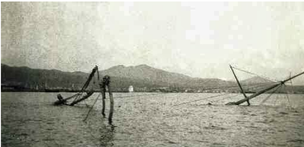
Τα υπολείμματα του Φετχί Μπουλέντ όπως φαίνονταν στον Θερμαϊκό

Το Ελληνικό торπιλοβόλο πλησίασε το «Φετχί Μπουλέντ» και από απόσταση 150 μέτρων το έπληξε με τρεις παλαιού τύπου торπίλες[3] κατασκευής του 1870[4]. Παρά την παλαιότητά τους, οι δύο από τις τρεις торπίλες έπληξαν με μεγάλη ακρίβεια το παροπλισμένο Τουρκικό θωρηκτό σε καίριο σημείο στην μέση του σκάφους προκαλώντας του ανεπανόρθωτες ζημιές.