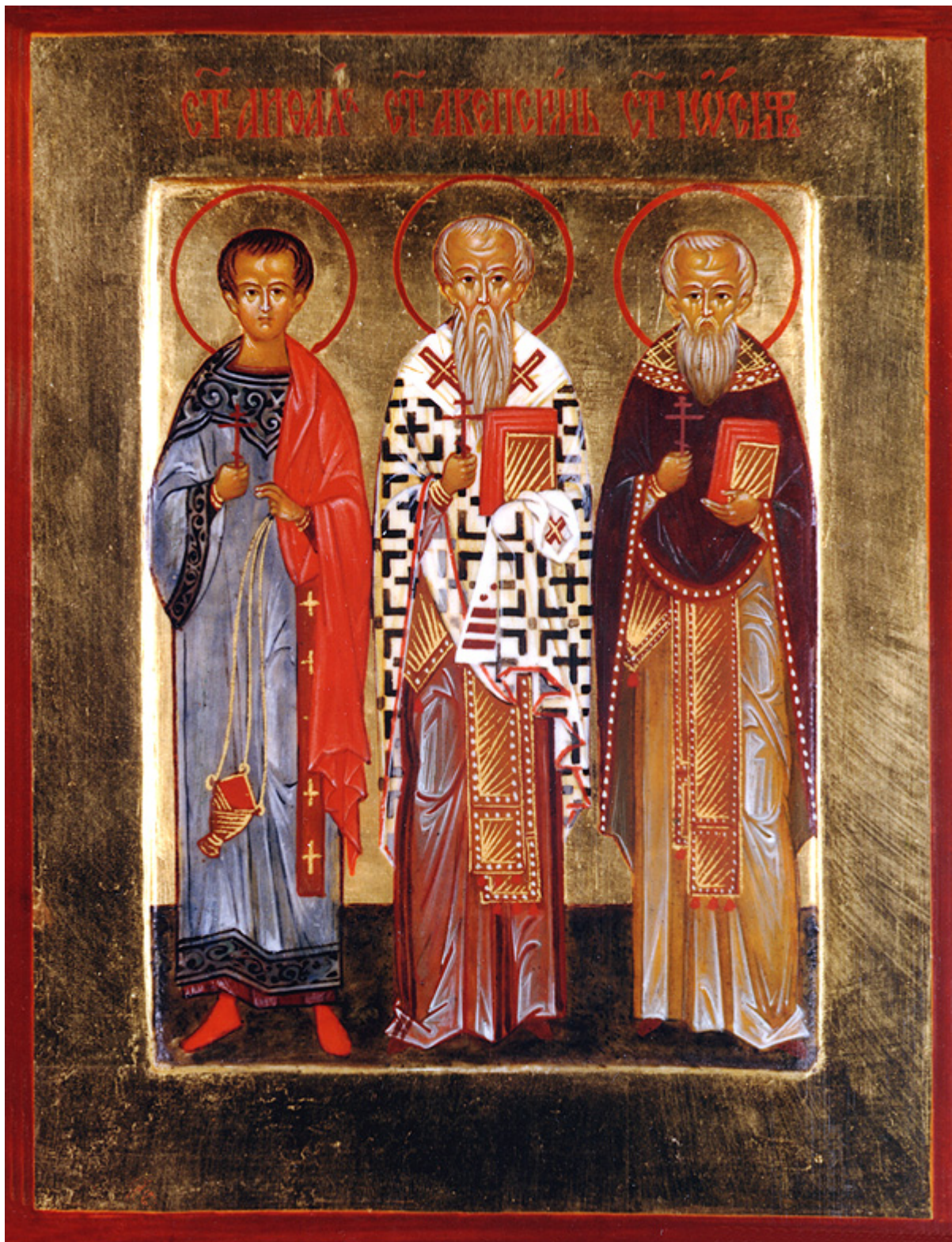
Άγιοι Ακεψιμάς, Ιωσήφ και Αειθαλάς

Εορτάζει στις 3 Νοεμβρίου εκάστου έτους.